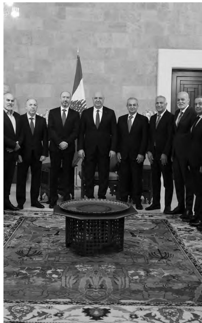
عون مع محافظ الجنوب ووفد من اتحاد بلديات صيدا - الزهراني

وشكر الرئيس عون الوزير الاميركي على دعم بلاده للبنان، مشدداً «على ضرورة توقف الاعتداءات الاسرائيلية على الأراضي اللبنانية، من خلال تحقيق وقف شامل لإطلاق النار الذي يعتبره لبنان ركيزة اساسية لتقدم المفاوضات اللبنانية الاميركية الاسرائيلية المقررة في واشنطن الأسبوع المقبل، للوصول إلى الأهداف الثابتة التي انطلقت منها هذه المفاوضات لاستعادة لبنان امنه