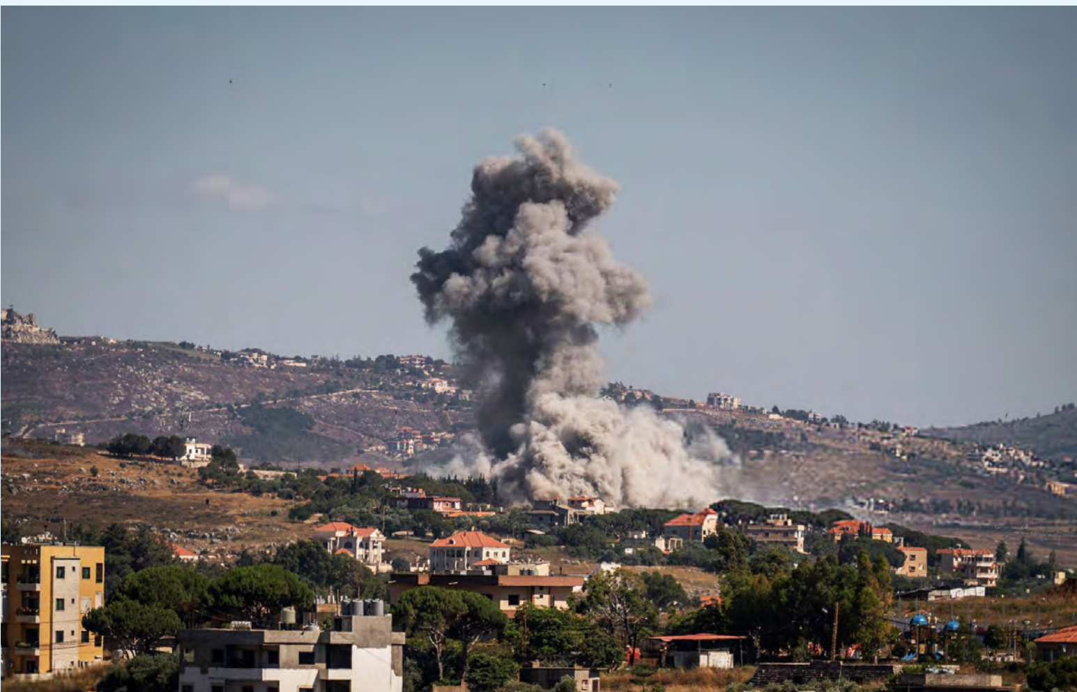
الغارات المعادية على النبطية

إشتباكات أدت الى مقتل 4 جنود «إسرائيليين» واستشهاد 47 مواطناً لبنانياً