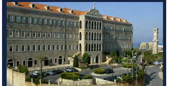
ميشال نصر 3