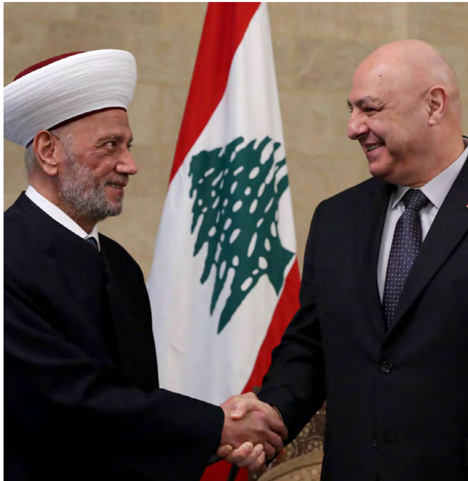
عون مستقبلاً دريان