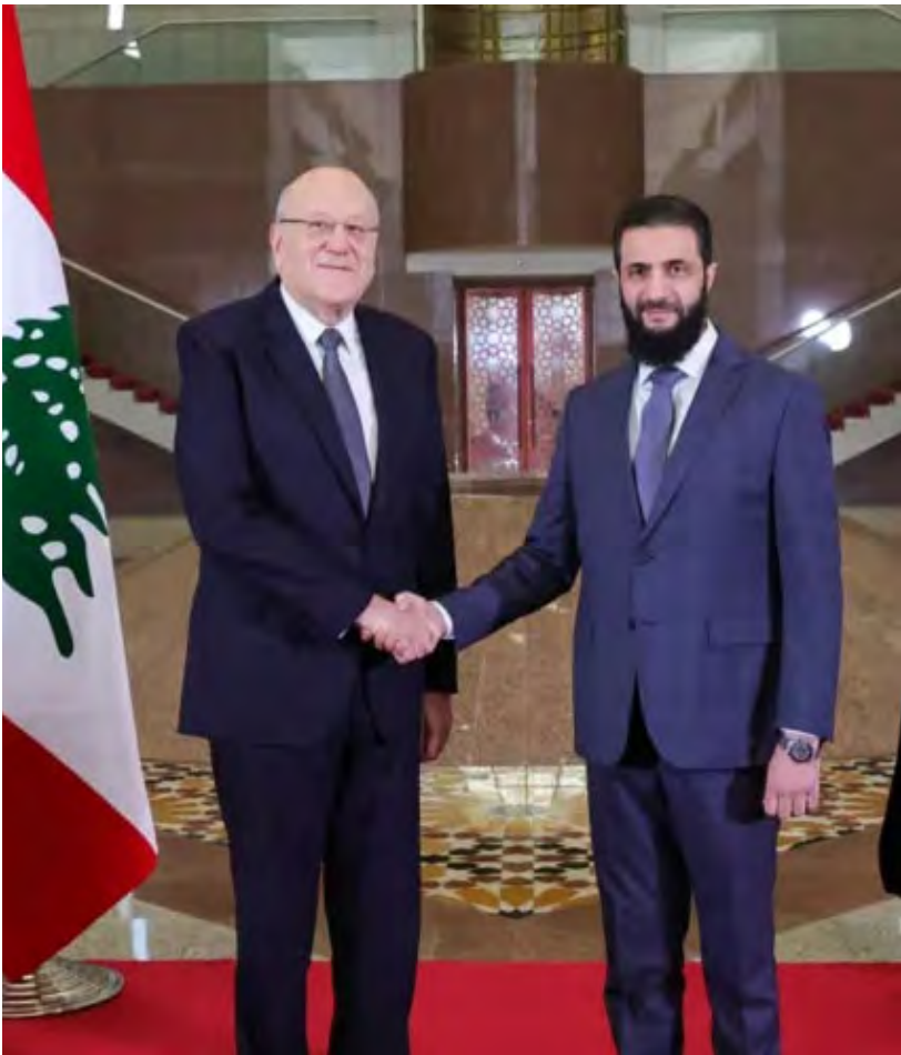
الشرع مستقبلاً ميقاتي