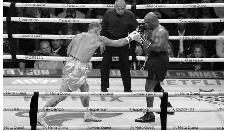
لقطة من النزال

انتهى صدام الملاكمة المثير بين اليتوبير الأمريكي جييك بول ومواطنه الأسطورة مايك تايسون، أمس السبت بسقوط «الرجل الحديدي».