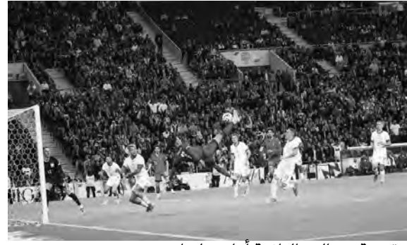
مقصية رونالدو الرائعة أمام بولندا

يوفنتوس الإيطالي في دوري أبطال أوروبا عام 2018.