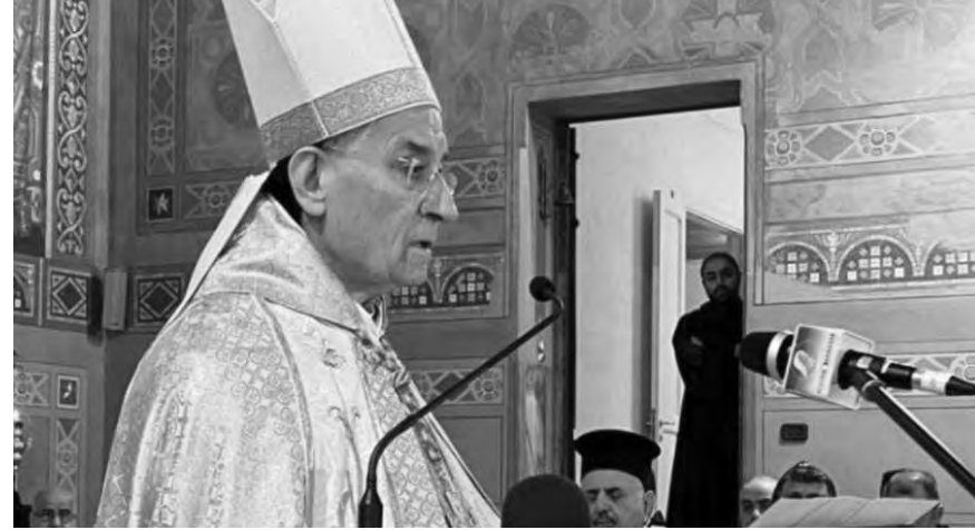
الراعي يلقي عظته

انهم ان لم يسجلوا أبناءهم، فهذا يعني انهم أصبحوا امواتا وغير موجودين على لوائح الشطب في لبنان بينما هم في الخارج يملؤون الكون وهذا شيء غير طبيعي ان يستمر، لذلك نأمل منهم ان يعوا حقيقة هذا الموضوع.» وفي الختام، قدم الراعي للحاج ميداليات البطريركية عربون وفاء وتقدير وبركة، سائلاً الله ان يوفقه مع عائلته ويقيه سندا للكنيسة المارونية ويغدق عليه بفائض نعمه وخيراته، كما سلم الشوريي مرسوم تعيينها، متمنيا لها التوفيق في مسيرتها.