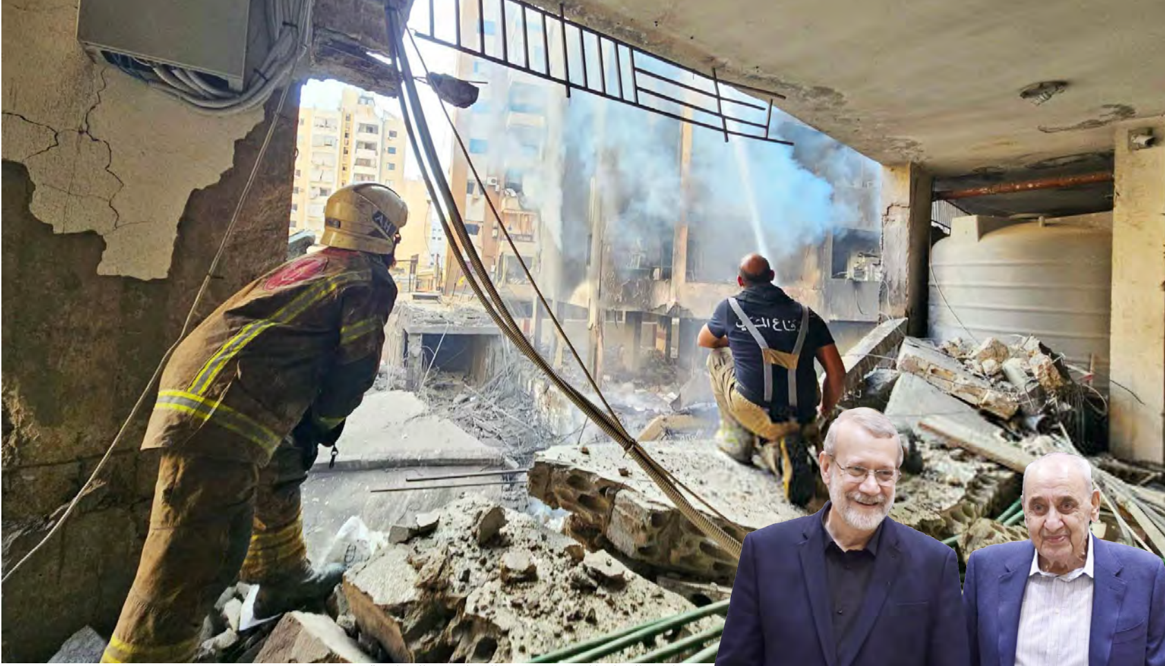
عناصر الدفاع المدني يخمدون النيران في الضاحية

● إسرائيل تحاول اقتناص المكاسب من خارج نص الاتفاق وتفشل عند أبواب موسكو ● جهنم الغارات الاسرائيلية على صور والضاحية الجنوبية وحزب الله يلهب حيفا