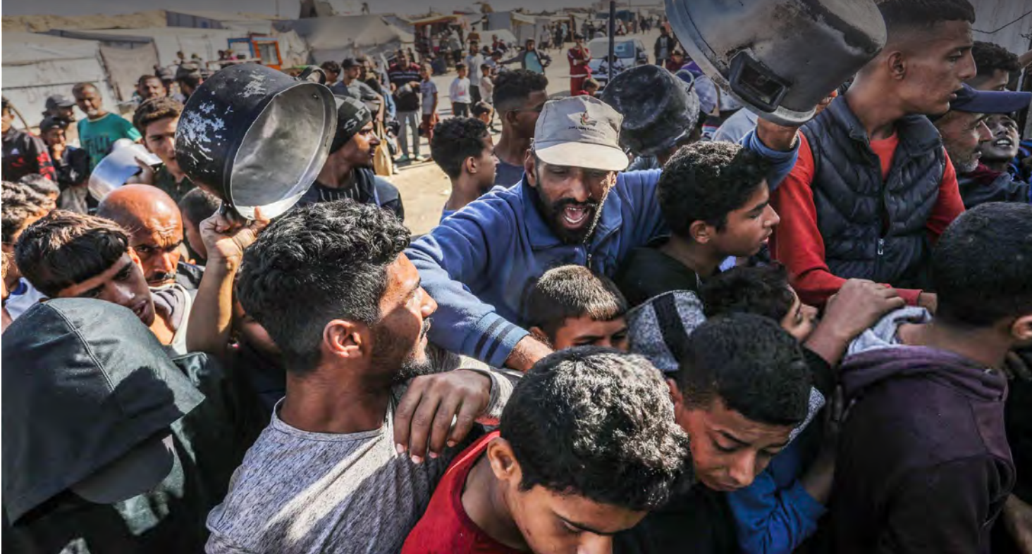
انعدام الامن الغذائي في غزة

تمهيدا لإقامة بؤرتين استيطانيتين جديدتين. سياسيا اعلن وزير الامن الإسرائيلي كاتس، أنه سيسمح بإرسال 7000 أمر تجنيد للحريديم في صفوف «الجيش».