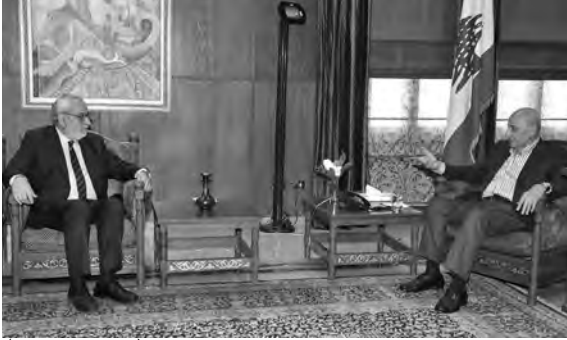
بري مستقبلاً بقرادونيان

استقبل رئيس مجلس النواب نبيه بري في مقر الرئاسة الثانية في عين التينة، رئيس لجنة الشباب والرياضة النيابية النائب سيمون أبي رميا، حيث جرى عرض للأوضاع العامة والمستجدات السياسية وشؤوناً تشريعية.