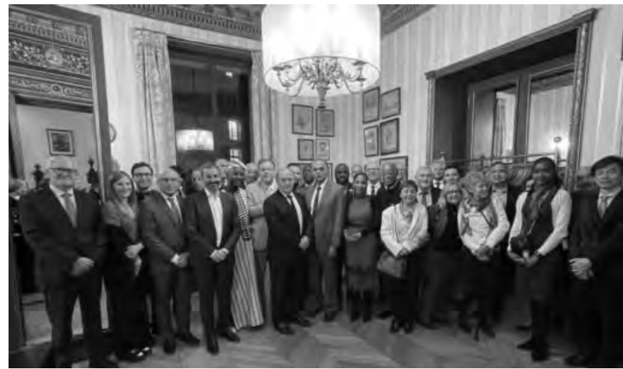
المشاركين في المؤتمر

وختم: «نعمل كمجتمع طبي في لبنان الذي يتعرض لتحديات كبيرة لاعاد السياسات والخطط لما بعد الحرب حيث سيحتاج الآلاف من المصابين إلى متابعة طبية مكثفة قد تمتد إلى سنوات طويلة».