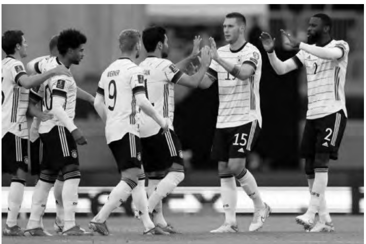
ألمانيا تبحث عن الصدارة

ويتصدر هذه المجموعة منتخب مولدوفا بست نقاط، يليه مالطا بنفس الرصيد، وتتذلل أندورا بلا رصيد.