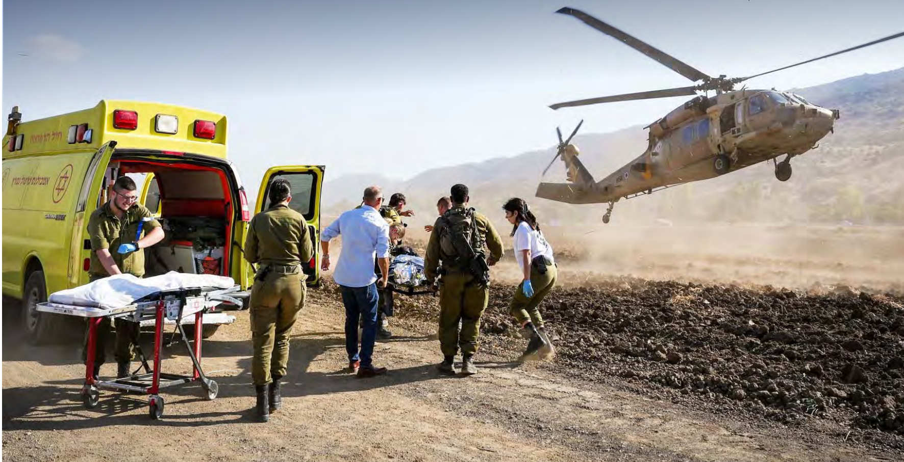
نقل المصابين في جنوب لبنان الى مستشفيات «الكيان»