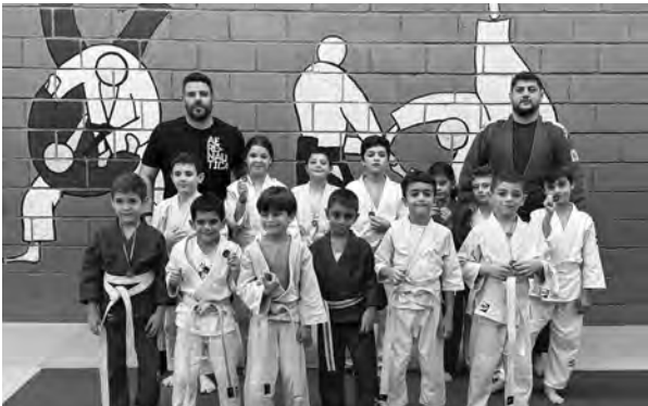
تتويج إحدى الفئات