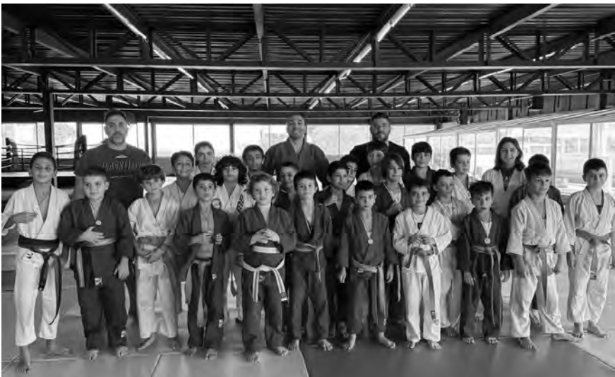
لاعبو الناديين في صورة تذكارية