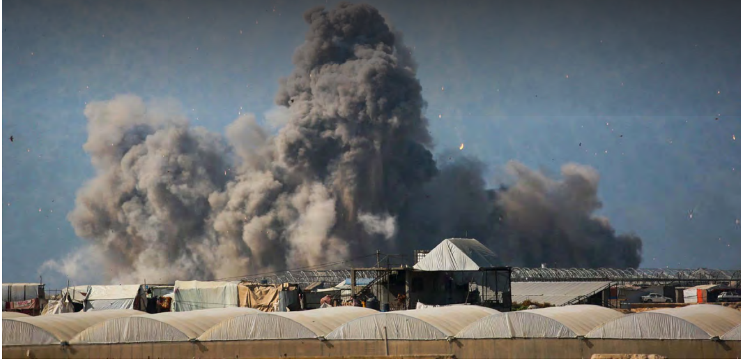
استهداف مخيمات النازحين في خان يونس

● مجزرتان في خان يونس وجباليا واحتدام المعارك شمال غزة