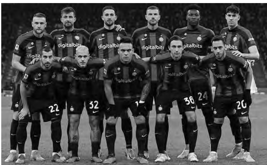
فريق إنتر ميلان

وبقي المباريات وفي باقي المباريات، يلعب بولونيا مع أتالانتا اليوم السبت، وفي مباريات يوم غد الأحد، يلعب تورينو مع لانسو وكومو مع فيرونا، وروما مع فينيزيا، وإمبولي مع فيورنتينا، ونابولي مع مونا، فيما تختمت منافسات الجولة يوم الإثنين، بمباراة تجمع بين بارما وضيغه كالياري.