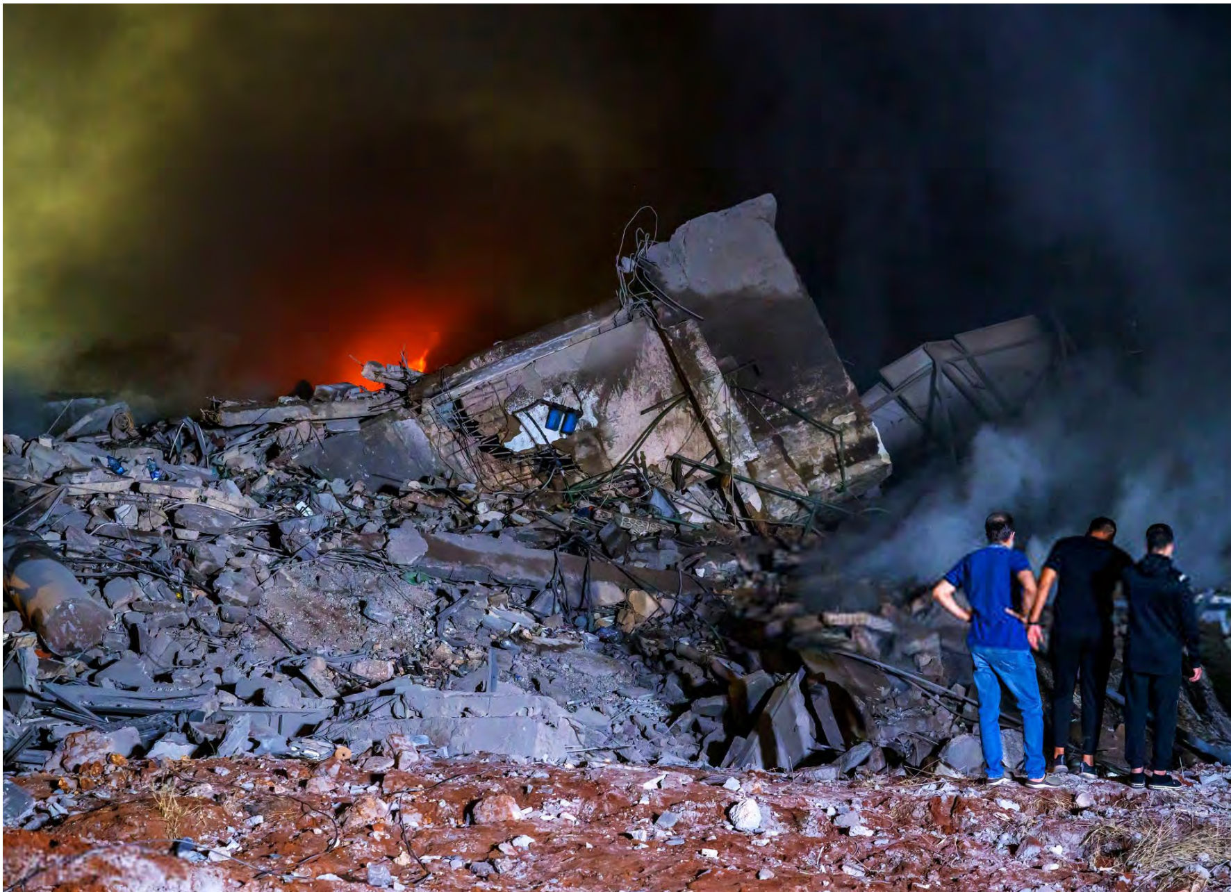
الدمار الهائل التي سببته الغارات الوحشية على الضاحية