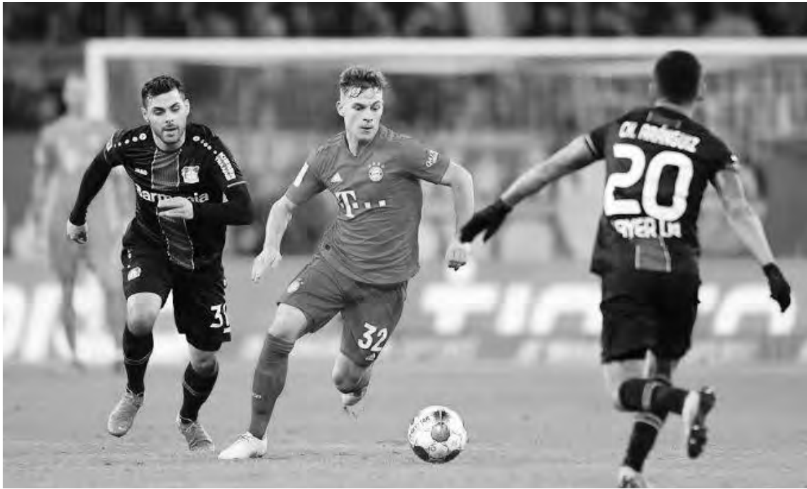
قمة نارية بين بايرن ميونخ وباير ليفركوزن

الانتصار، ويبقى سجله 3 هزائم وتعادل واحد والتأخر في مجموع نتائج تلك المباريات (-3 11). وأنت آخر زيارة في عام 2022 وانتهت بهزيمة ثقيلة استقرت عند (0-4)، ويأمل ليفركوزن الانضمام لقائمة الفرق التي نجحت في إسقاط ميونخ على ملعبه في أكتوبر فريست والتعبيد البافاري أول هزيمة له هذا الموسم اليوم السبت.