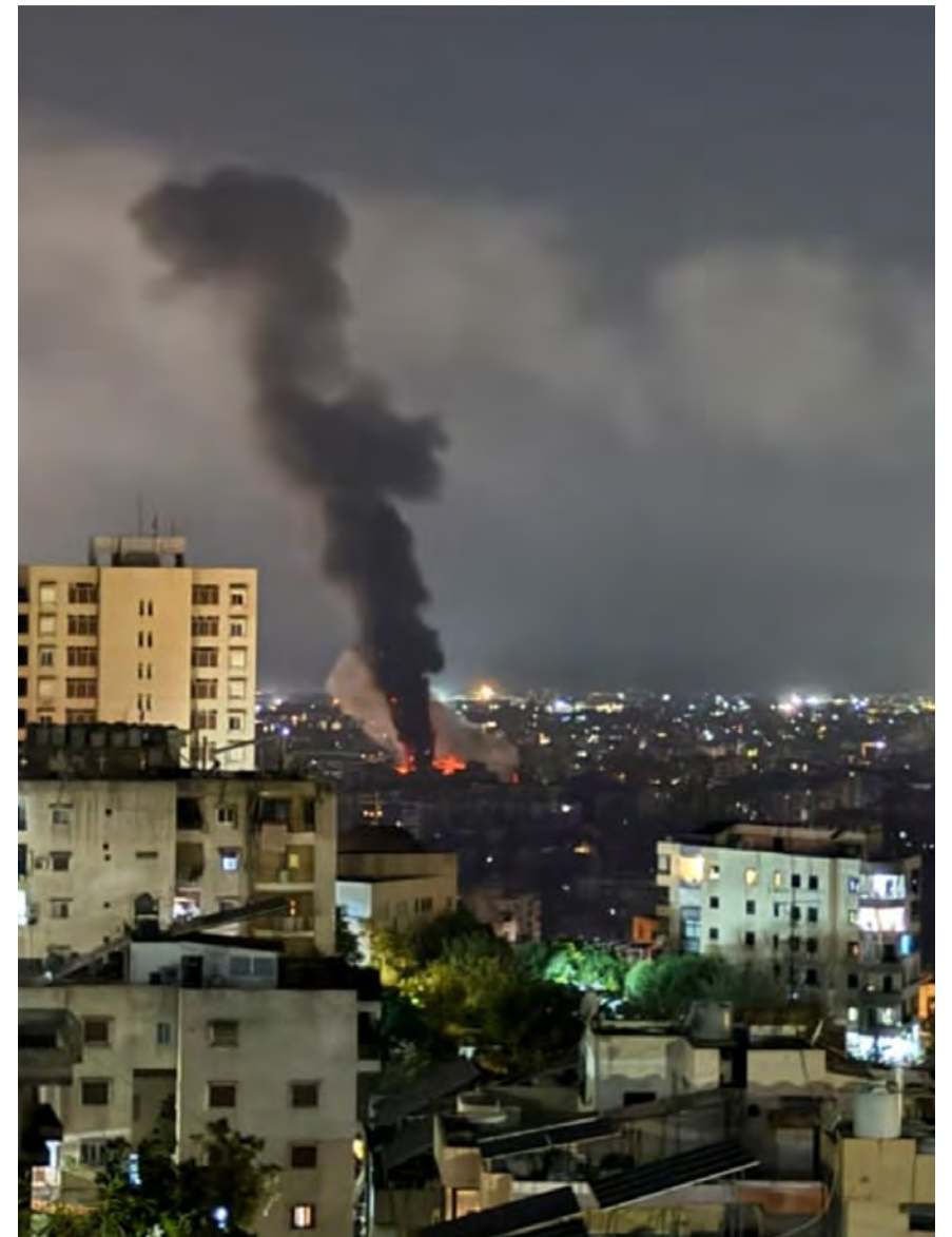
الغارات الليلية على الليكبي