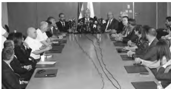
خلال الإعلان عن العيادات التخصصية

فردياً، بل هو جهد مشترك مع الشركاء والنقابات. وقال إن المبادرة التي تقوم تحت مظلة وزارة الصحة العامة بالتعاون مع النقابات الطبية والبصرية ونقابات العلاج النفسي والأطباء الإختصاصيين، تهدف إلى استكمال واجباتنا تجاه أهلنا ومرافقتهم في رحلة التعافي وإعادة اكتساب دور لهم في المجتمع.