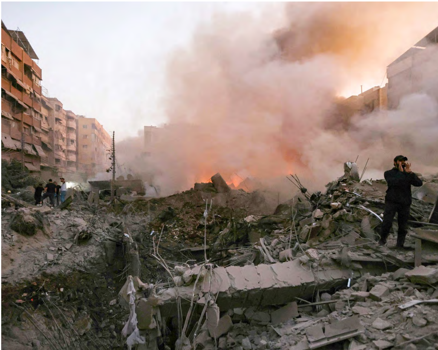
دمار كبير في حارة حريك

هذا، وكذبت الصور والفيديوهات المسجلة لما بعد الغارة ادعاءات العدو الاسرائيلي، حيث لم ينفجر اي ذخيرة او صواريخ جراء العدوان بل جل ما حصل اندلاع حريق في الابنية المستهدفة ما يؤكد زيف ادعاءات جيش العدو، ونيته المسبقة بقتل اكبر عدد من المدنيين.