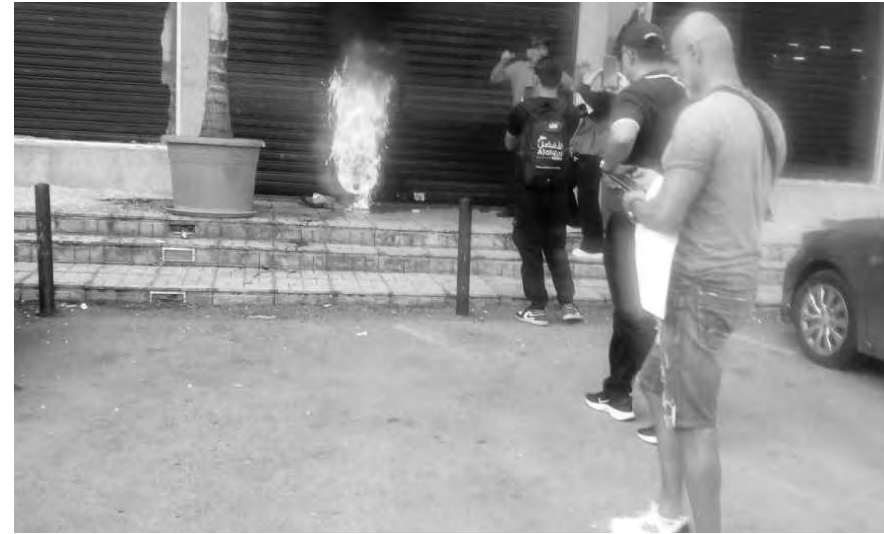
محاولة احراق مداخل احد المصارف

ستقضي على معظم الودائع». وطالبت بـ «تغيير سعر سحب الدولار المصرفي ليصبح على السعر الرسمي». كما طالبت «بإيجاد حل لكل الودائع الخاصة مودعي الليرة الذين فقدوا قيمة جنى عمرهم بعد تدهور سعر العملة اللبنانية». ختمت البيان: «نحن على مشارف السنة السادسة وما زال الهيكرات سيد الموقف وهذا الأمر مرفوض. يجب البدء بإعادة الودائع لأصحابها من دون هيكرات».