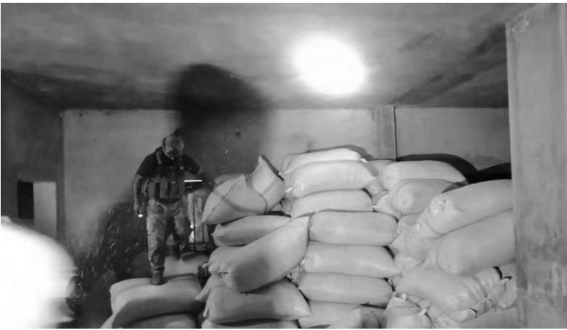
ضبط حشيشة في البقاع

سُلمت المضبوطات وبوشر التحقيق مع الموقوفين بإشراف القضاء المختص».