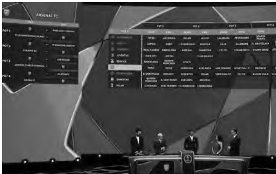
لقطة عامة من القرعة

ميونيخ وأتلانتا ويونغ بويز وستاد بريست، فيما يرحل خارج الديار لمواجهة دورتموند وبنفيكا والنجم الأحمر وموناكو.