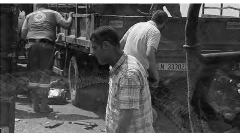
حادث على طريق انفة - بيروت

وقعا ضحية اعمالهما الاتصال بفرع معلومات جبل لبنان على رقم الهاتف: 01-513732، تمهيداً لاتخاذ الإجراءات القانونية حيالهما».