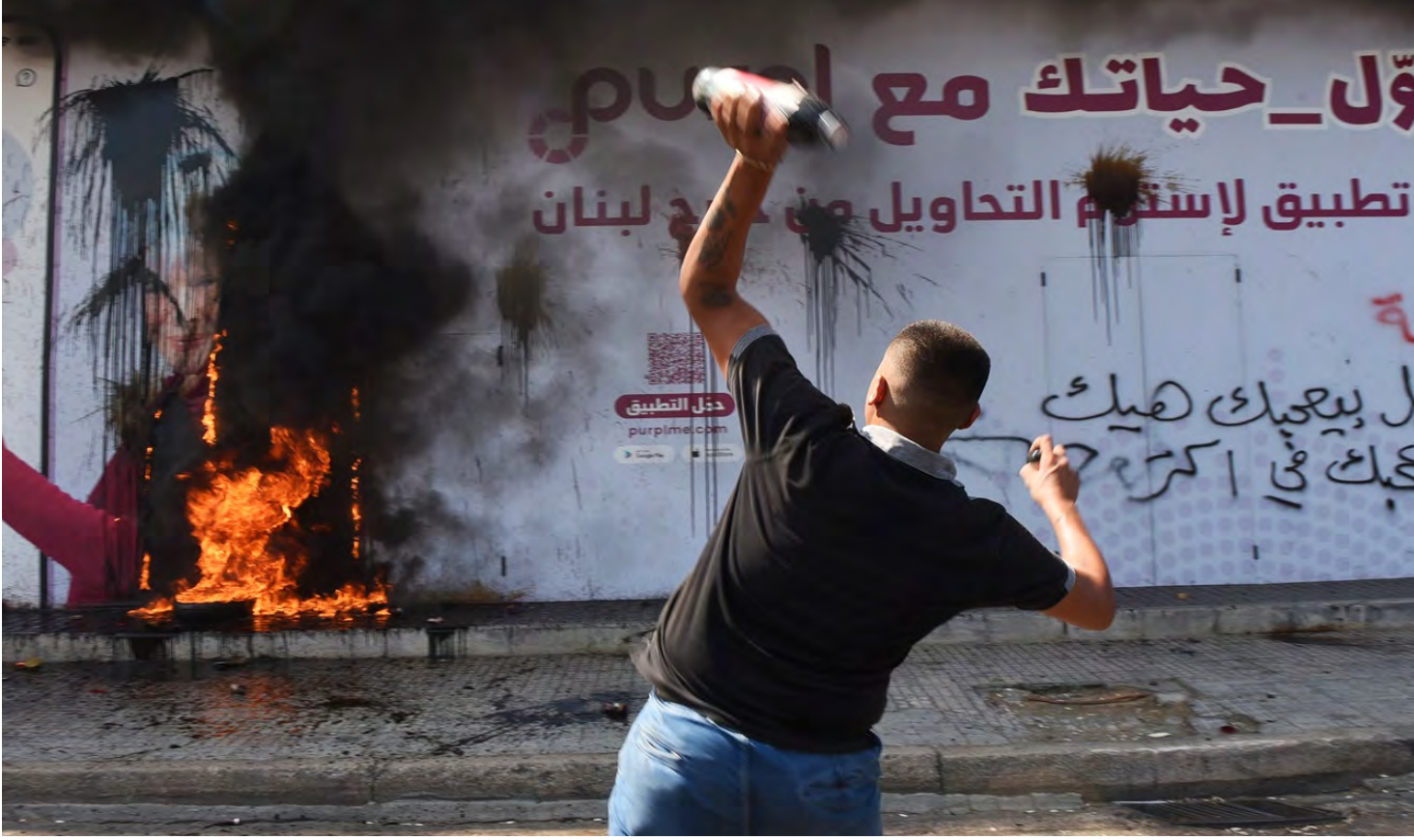
المودعون عاودوا تحركاتهم

معلومات مؤكدة: 6 مسيرات اخترقت الدفاعات الجوية «الاسرائيلية» واصابت قاعدة «غليوت» وتعميم اعلامي شديد