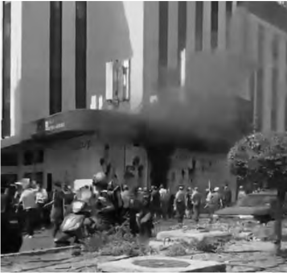
الاحتشاد امام احد المصارف في الدورة

إحراق مداخل بعض المصارف وتكسير واجهاتها في الدورة