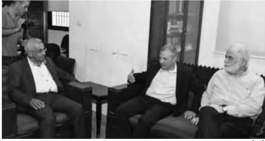
باسيل يزور سعد

بعدها، زار باسيل المفتي الجعفري الشيخ محمد عسيران، وقال باسيل «إننا أكدنا أهمية التضامن الوطني في مواجهة إسرائيل، كما عبرنا عن تقديرنا للردود الجامع الذي يؤديه