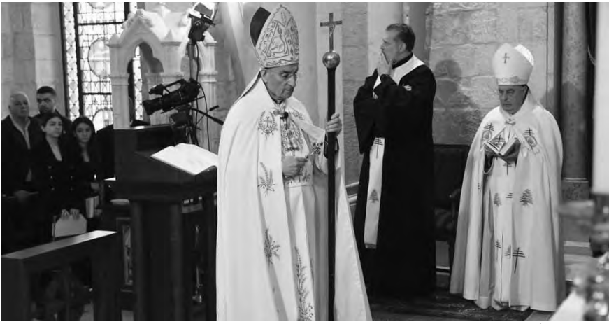
الراعي يترأس القداس

المسافات بين جنبلاط والمعارضة تتسع... «لا كيمياء» تغيّب لافت لـ«الاشتراكي» عن لقاء معراب... صونيا رزق