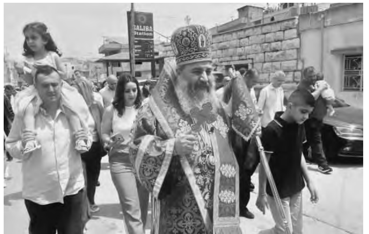
المطران الصوري خلال الزياح في زحلة