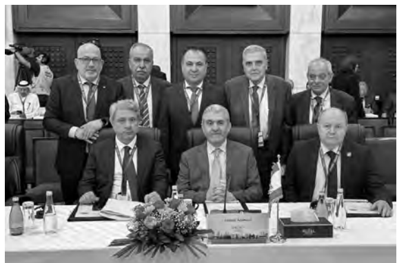
بيرم والوفد الاقتصادي اللبناني

وتابع: «صحيح أننا في لبنان نرد الصاع صاعين وهجرنا المستوطنين الصهاينة من الشمال الفلسطيني، وهذه سابقة تحصل لأول مرة منذ 75 عاماً، أن نرى المستوطنين يتركون المستوطنات هرباً من صواريخ المقاومة في لبنان. هذا التوازن وهذا الردع يجعلنا محترمين في العالم، فعندما تكون ضعيفاً وتعرض لعاداة ما، فكل ما قد تحصل عليه من العالم هو القليل من الشفقة لأن الناس في داخلهم لا يحترمون الضعفاء لذلك ألبنا أن ندافع عن أنفسنا وعن حقنا ووجودنا. نحن كعرب، جميعنا، لم نعدت على أحد ولم نحفل دولة أحد