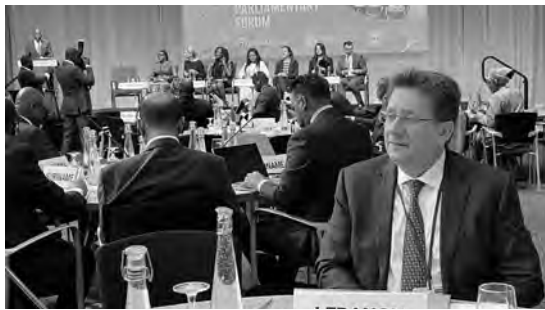
كنعان من واشنطن