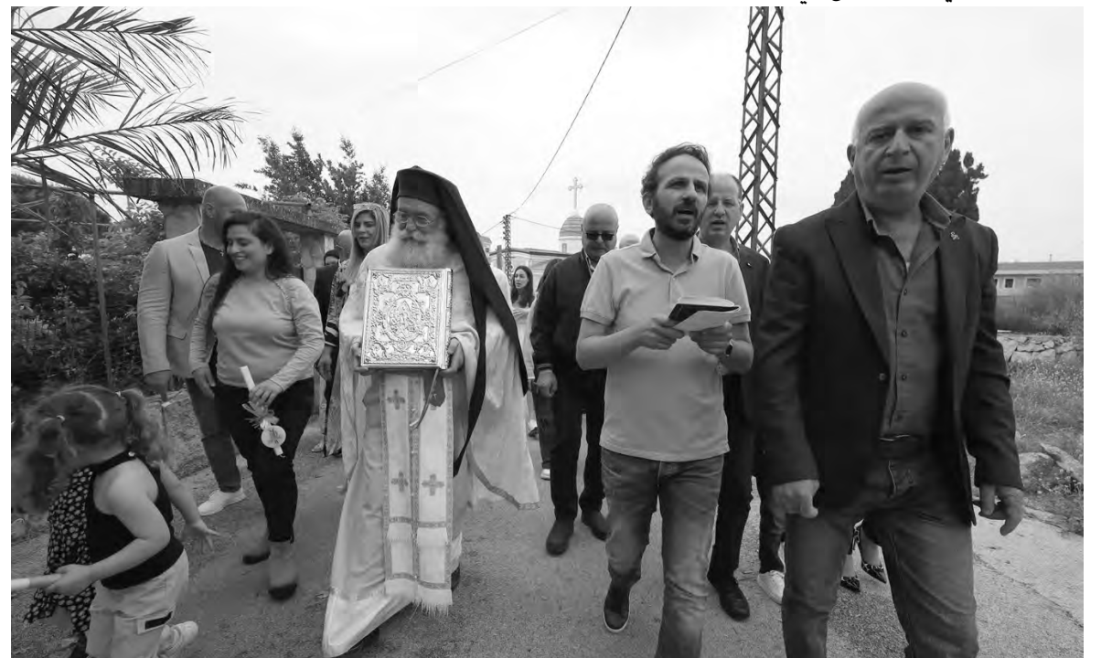
في برج الملوک