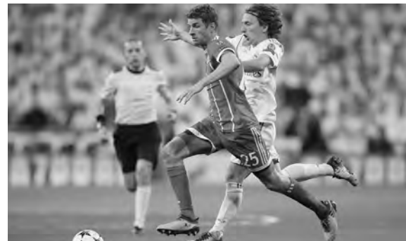
من إحدى مواجهات بايرن ميونيخ وريال مدريد

يعتبر كلاسيكو بايرن ميونيخ الألماني وريال مدريد الإسباني هو أكثر مواجهات نصف النهائي المكررة في تاريخ دوري أبطال أوروبا إجمالاً، برصيد 26 مرة، بحسب موقع الاتحاد الأوروبي لكرة القدم «بوفيفا». وحقق بايرن ميونيخ 12 انتصاراً على ريال مدريد، مقابل 11 من نصيب «الملك» و3 تعادلات، في المواجهات التي بدأت لأول مرة في نسخة 1976 وتوقفت في 2018، قبل أن تعود من جديد في 2024.