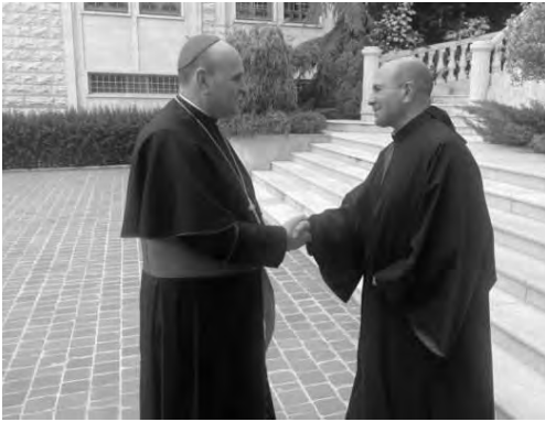
السفير البابوي والمطران معوض

التي، عندها، تفرض على الطالب أن يكون بارعا فيها حصرا ليؤمن نجاحه». اضاف: «إن المكتب التربوي في التيار يشدد على أهمية المحافظة على الشهادة اللبنانية وعدم وضع اولادنا رهائن لقرارات تتغير قبل الامتحانات، وقد تتكرر تباعا في كل سنة إن لم نضع حدا لها، وتسبب الضياع للاملاذ وأهاليهم، ويدعو الوزير مع كافة مكونات وزارة التربية إلى البت بالموضوع بطريقة علمية رافضين التدخلات التي حصلت في الأونة الأخيرة في هذا الموضوع وانهاء البلبلية الحاصلة مع المحافظة على قيمة الشهادة اللبنانية». وختم المكتب التربوي، داعيا إلى «دراسة وضع المدارس المغفلة في الجنوب والنطبية بشكل علمي بالتشاور مع اهلتنا الصامدين في القرى الحدودية وإيجاد الحل المناسب لهم ومستقبلهم».