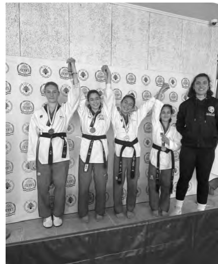
نتيجة فئة الإناث