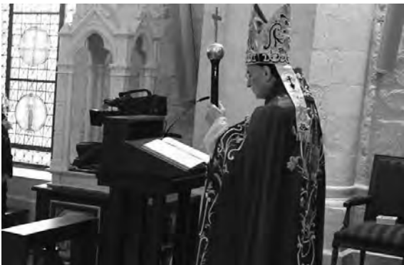
الراعي يلقي عظته

التي تُرتكب هناك ضد الشعب الفلسطيني على يد «الإسرائيليين» الأثيمة؛ يقتلون عمداً العشرات من المنتظرين المساعدات الغذائية، وهم يتخسرون جوعاً. وآخرون يموتون جوعاً على الطرقات تحت أنظارهم، وآخرون يُقتلون عمداً وهم على طرقات التشريد من بيوتهم المهذّمة، والهرب تحت نيران المدافع والصواريخ. فبا لإجرام الوحشي».