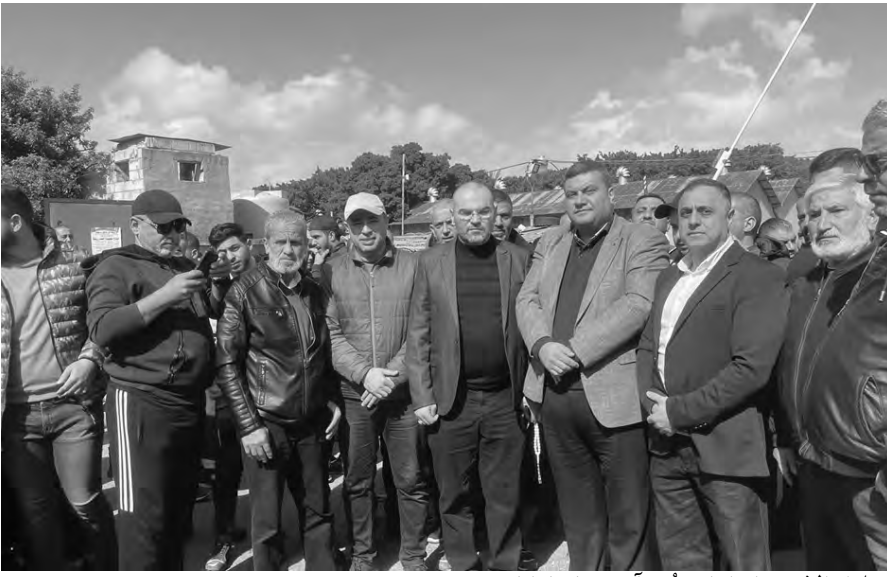
خلال الاعتصام امام منشآت نفط طرابلس