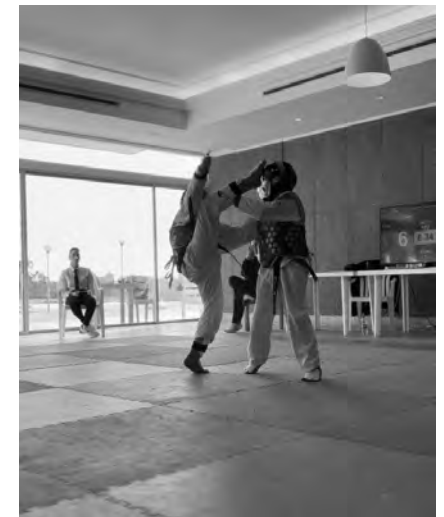
خلال إحدى العروض

نظّم نادي «تايكواندو فايترز أكاديمي» بطولة ودية في لعبتي البومسيه والفايت بإشراف الإتحاد اللبناني للتايكواندو إستضافها نادي الغولف اللبناني في منطقة الجناح وشارك فيها 100 لاعب ولاعبة من الذكور والإناث لجميع الفئات العمرية وهم يمثلون 5 أندية هي: الرياضي بسيروت، التعاضد المرزعة، هوبس، اللبناني الأوسترالي ونادي الغولف.