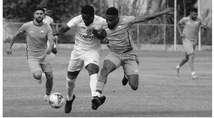
من مباراة طرابلس الرياضي والشباب الغازية