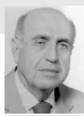
اعداد : لوران ناكوزي