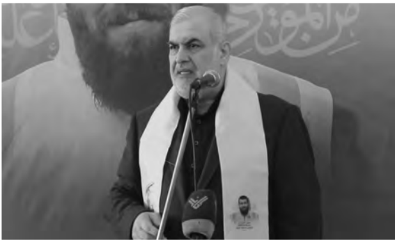
رعد يلقي كلمته