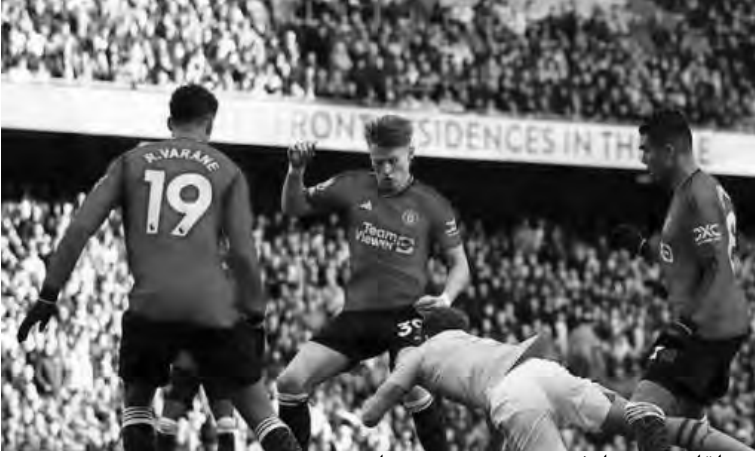
من لقاء دربي مانشستر بين سيتي ويونايتد

وبهذا التعادل صار لفروسينوني 24 نقطة في المركز الـ 16 ولليتشي 25 نقطة في المركز الـ 13.