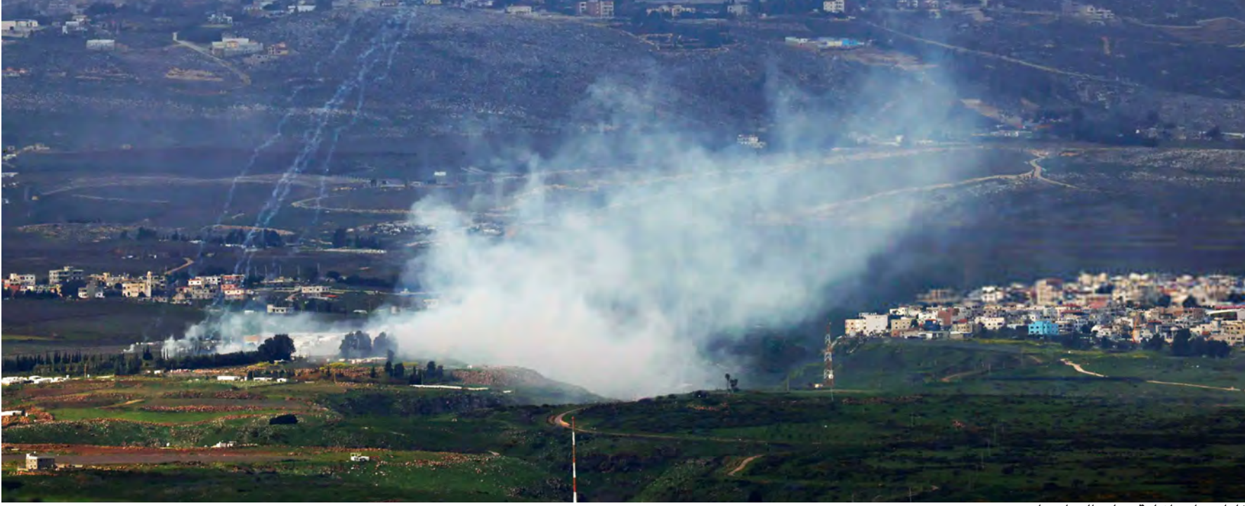
غارات «إسرائيلية» على الوزاني امس

● هوكشيتاين في لبنان بمحاولة ديبلوماسية أخيرة قبل احتمال الحرب الموسّعة؟