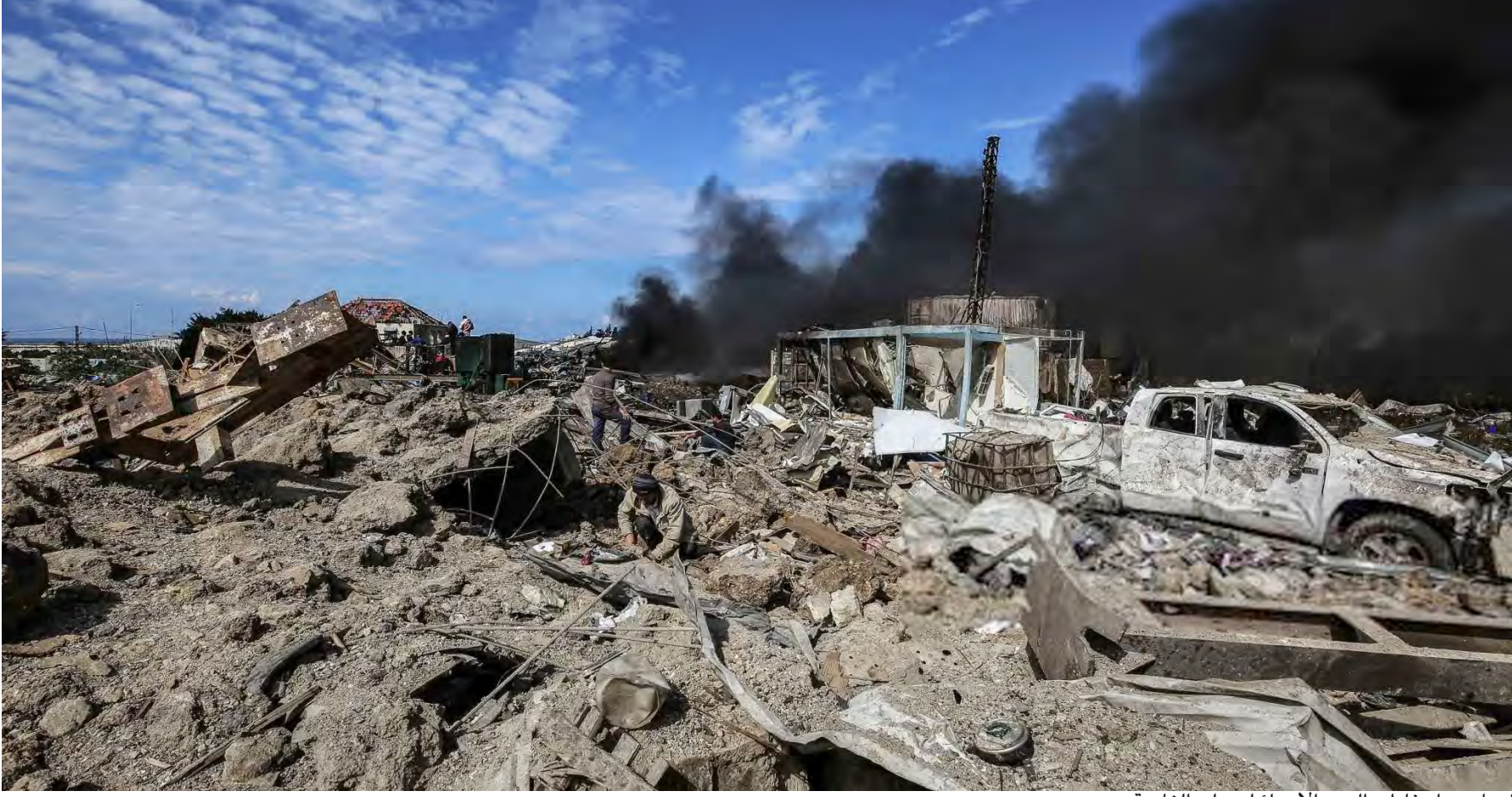
الدمار جراء غارات العدو الإسرائيلي على الغازية

● باسيل يحذر من إقصاء المسيحيين عن الحكم ● العسكريون المتقاعدون الى العصيان المدني