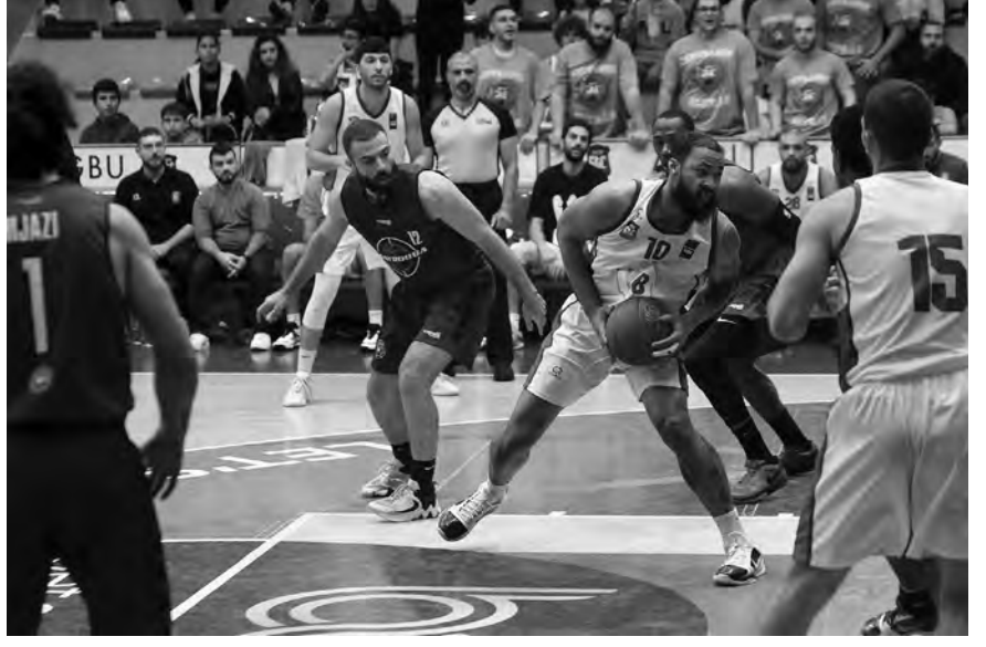
من مباراة الاترنيك وميروبا

حقق فريق الاترنيك فوزاً لافتاً على ميروبا (69-86)، في المباراة التي جرت أمس الخميس على ملعب «سنتر ديميرجيان» في النقاش، ضمن المرحلة السابعة من بطولة لبنان في كرة السلة. وكان فريق الحكمة حقق فوزاً مستحقاً على ضيفه ماريست، في المباراة التي جمعتها الأربعاء.