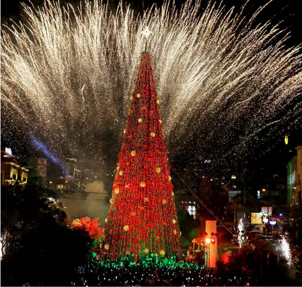
إضاءة شجرة الميلاد في جبيل