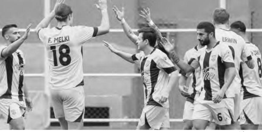
فرحة لاعبي العهد