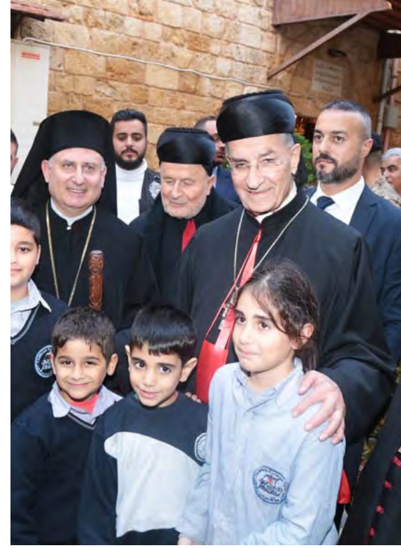
البطريك الراعي خلال جولته في صور