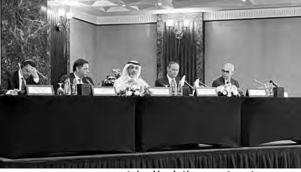
منصوري في مؤتمر محافظي المصارف

قريباً بمجموعة إجراءات ونشاطات داعمة لسلسلة اجتماعات جانبية قد تظهر نتائجها للبنان ومصرفه المركزي.