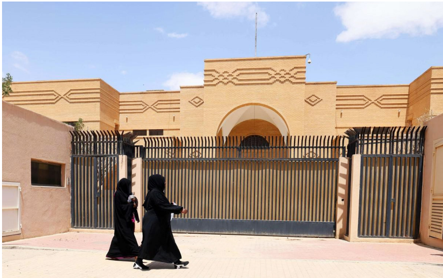
السفارة الإيرانية في الرياض

فيما كانت الخارجية الإيرانية تعلن عن فتح سفارتها في الرياض اليوم، في اطار تنفيذ الاتفاق السعودي-الإيراني برعاية بكين، كان رئيس الوكالة الدولية للطاقة الذرية يصف