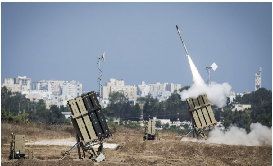
فشل القبة الحديدية دفع بواشنطن لتطويرها

حذر وزير الدفاع الإسرائيلي يوآف غالانت امس، من تعرض الجبهة الداخلية لتحديات لم تعدها «إسرائيل» من قبل في حال اندلاع حرب متعددة الجبهات، فيما أعلن وزير الخارجية الأميركي أنتوني بلينكن تقديم مليار دولار لـ «إسرائيل» لتطوير منظومة القبة الحديدية. وقال غالانت إنه ينبغي الاستعداد المسبق والتحصين لهذا السيناريو بأفضل ما يمكن. وأضاف خلال جولة تفقدية لمقر قيادة الجبهة الداخلية التابعة لجيش العدو أن ثمة دورا مهما وكبيرا لتلك الجبهة على مجريات أي معركة، كما أن أداءها يؤثر في قدرة تمكين الجيش والأجهزة الأمنية على القيام بمهامها العسكرية في الميدان. وتأتي هذه الجولة للوقوف على جاهزية الجبهة الداخلية ضمن تدريبات الجيش الإسرائيلي السنوية التي بدأها الأسبوع الماضي لمحاكاة حرب متعددة الجبهات، والتي أطلق عليها اسم «القبة الساحقة».