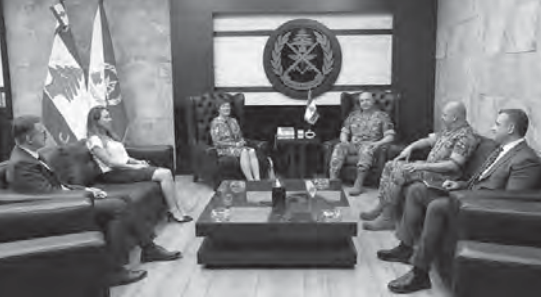
عون مجتمعاً مع فرونتسكا

زارت المنسقة الخاصة للامم المتحدة السيدة يوانا فرونتسكا، نائب رئيس مجلس النواب الياس بوضعب في مكتبه في المجلس قبل ظهر امس، حيث تم عرض للاستحقاقات الداخلية الراهنة.