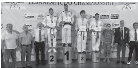
.. وجو حداد