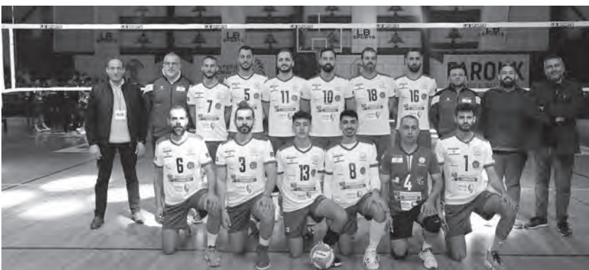
فريق سبيدبول شكا