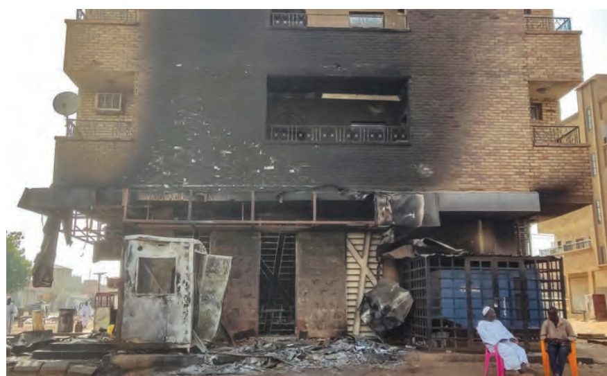
خرق للهدنة من قبل فريقي القتال

إستهداف مُسيّرة للاحتلال فوق الجولان أنقرة: تشكيل لجنة لتطبيع العلاقات مع سوريا وقال في تصريحات لصحيفة «حرييت»، إنه «تقرر تشكيل لجنة مهمتها إعداد خارطة طريق وخطة عمل لتطبيع العلاقات بين أنقرة ودمشق». وأضاف جاويش أوغلو أن «هذه اللجنة ستجتمع خلال أيام لبدء عملها». وكان وزير الخارجية السوري، فيصل المقداد، قد أكد في وقت سابق، أن تركيا وسوريا لديهما الفرصة للعمل المشترك لتحقيق تطورات شعبي البلدين. وتابع المقداد أنه «سوريا وتركيا تجمعهما حدود طويلة، وأهداف ومصالح مشتركة، (التتمة ص ٩)