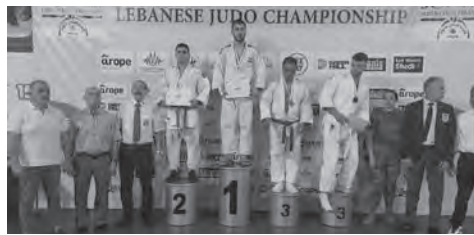
.. وغدي موسى