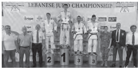
.. وديغو سيقلي