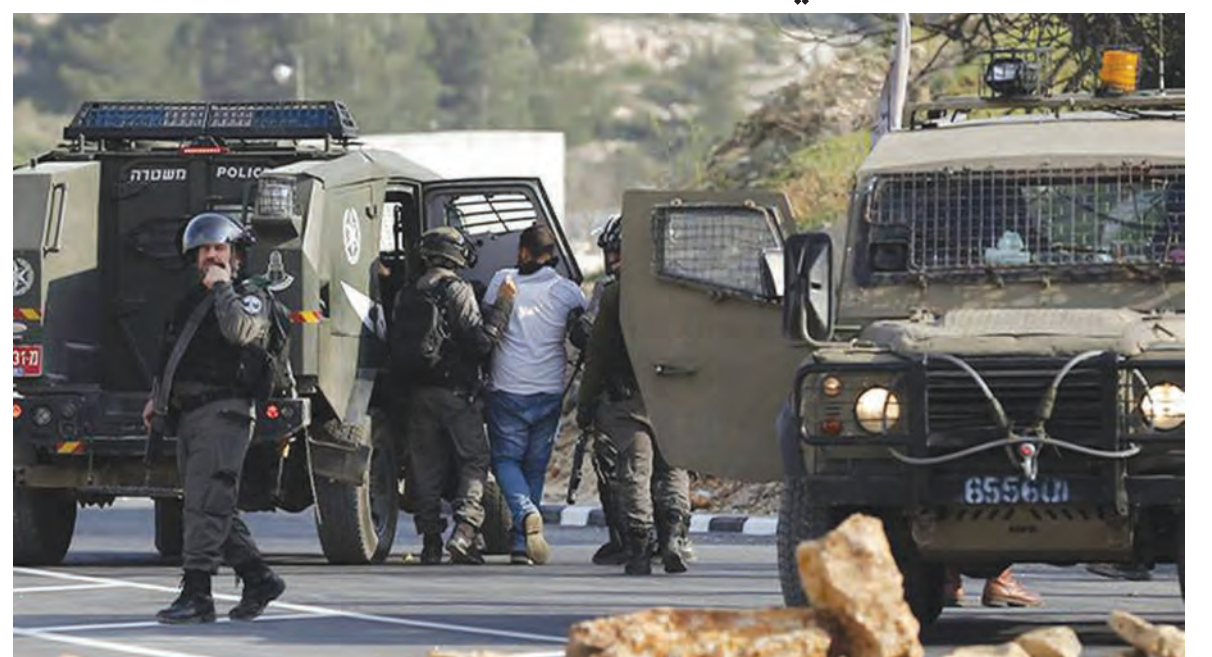
قوات الاحتلال تداهم وتعتقل فلسطينيين في الضفة