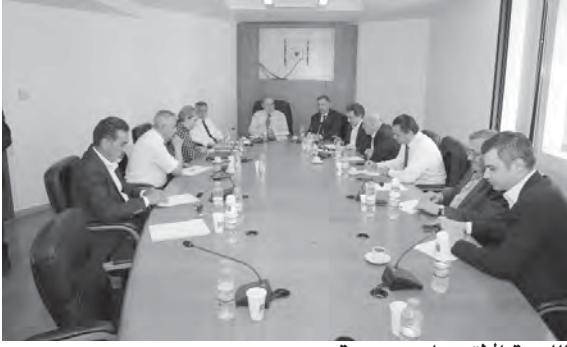
اللجنة الاقتصاد مجتمعة

كبير في الموازنة. لجنة الاقتصاد تطالب بتوحيد سعر الصرف، ونسأل ما هو تأثير هذا الموضوع على الفاتورة الصحية. اصبح هناك اشخاص يتحمسون للدخول في الصناعة المحلية ما يشجع على التصدير. كما تحدثنا عن توزيع الدخل على المواطنين وعن ضبط الاستيراد غير الشرعي، وتدعو الى اصلاح جمركي في الادارة بتبقيقات فاعلة..