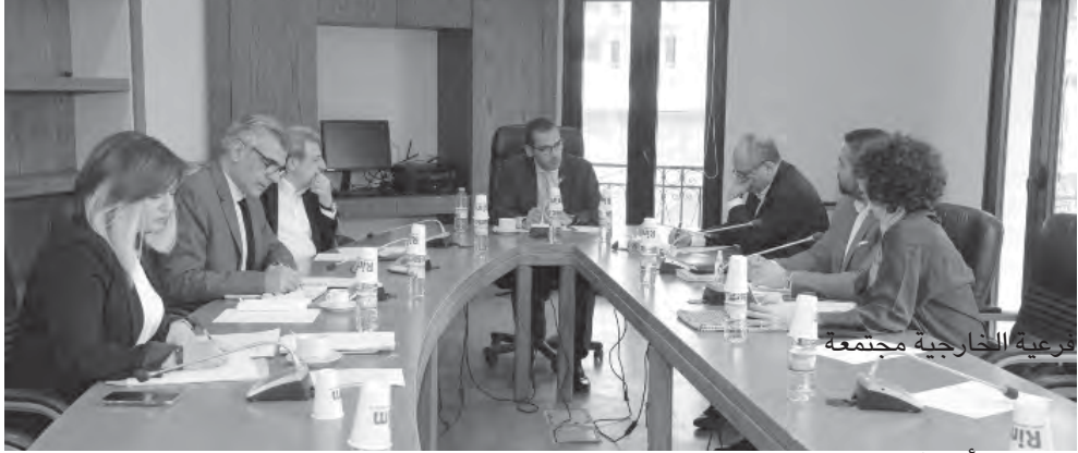
فرعية الخارجية مجتمعاً