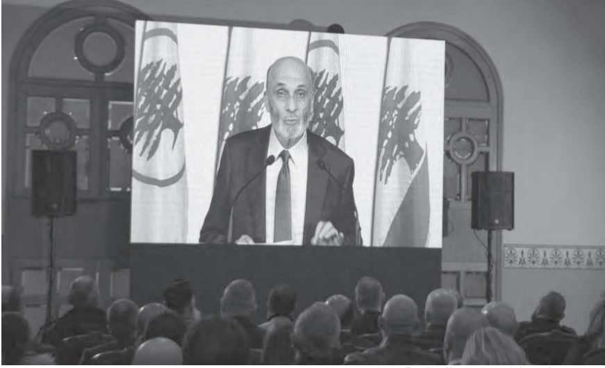
جعجع يلقي كلمته عبر الشاشة

مال التاجر»، مستشهدا بقول أهالي زحلة الى جيش الأسد (ع زحلة ما بتفوتو)، ليريد (هيك منقول لمحور الممانعة، عالقصر ما بتفوتو)».