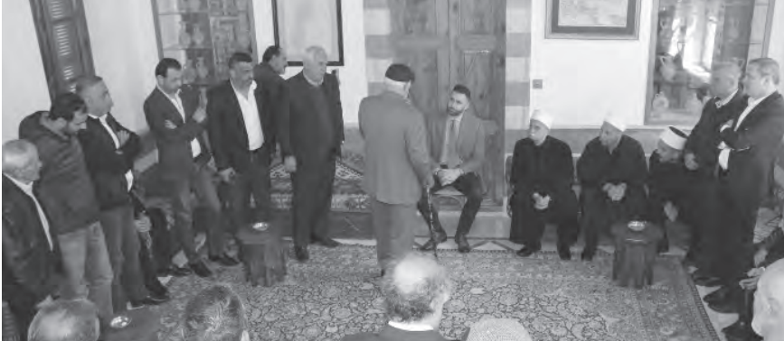
تيمور جنبلاط مستقبلاً زواره

البلدية، وما يلوح في أفقها من أجواء تعطيل أو تأجيل، داعياً في هذا المجال إلى «إزالة كل المعوقات التي تحول دون إنجازها وتقف أمام هذا الاستحقاق المهم على طريق بناء الدولة والحفاظ على المؤسسات».