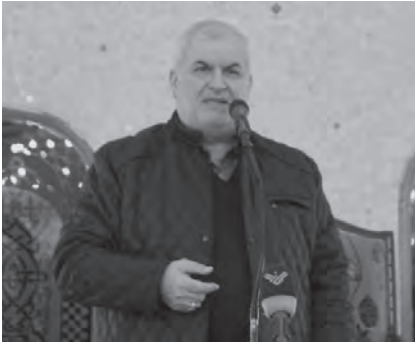
رعد يلقي كلمته

إقتصادية؟ يعني أن البنك الدولي يستطيع أن يتفاهم معه، كما صندوق النقد الدولي، لمصلحة التعليمات والتوجيهات والسياسات التي يرسمها الناقدون الإقتصاديون للعالم، لافتاً إلى أنه «تحت عنوان التواصل مع صندوق النقد الدولي قلنا بأن ٣ مليارات لن نتفعه البلد، فلا «نتعوبا قلبكم»، ويجيبون بكل ثقة المسألة ليست مسألة مليارات بل هي فتح أبواب الدول من أجل مساعدتكم، وعليه يجب أن تركنوا لسياسات تلك الدول من أجل أن توفر لكم المساعدات دائماً».