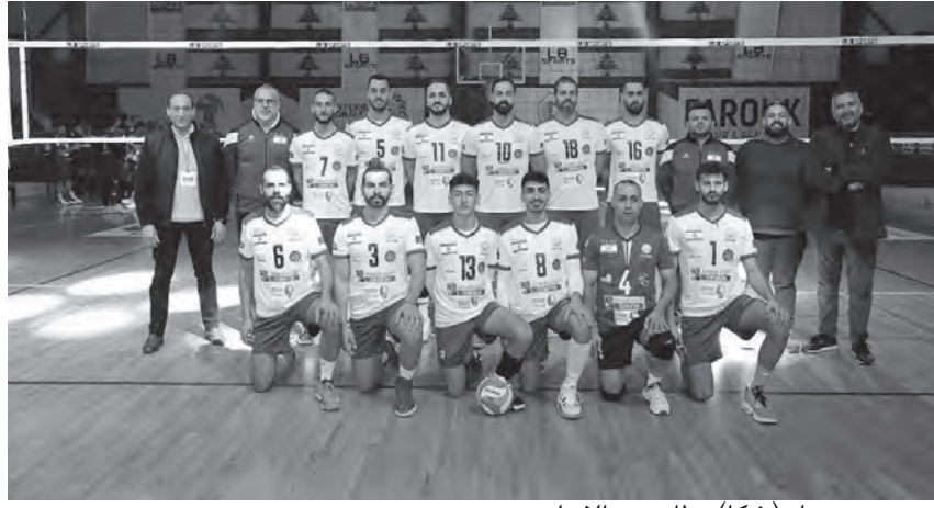
فريق سيدبول (شكا) بطل دور الذهب

بسرعة والا لتعطي الدور لغيرها في قيادة النادي الذي كان مربع الفرق المحلية والخارجية لسنوات وبات احد رموز اللعبة في لبنان.