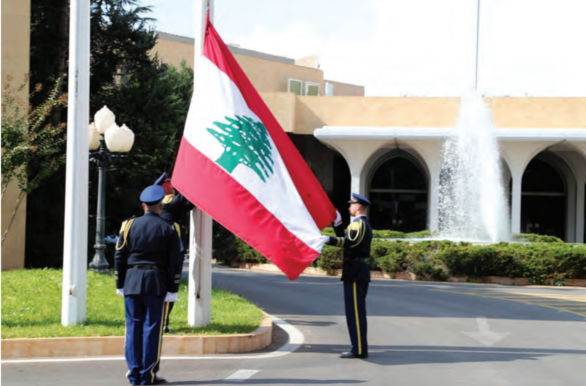
متى يرفع علم القصر مجدداً ؟