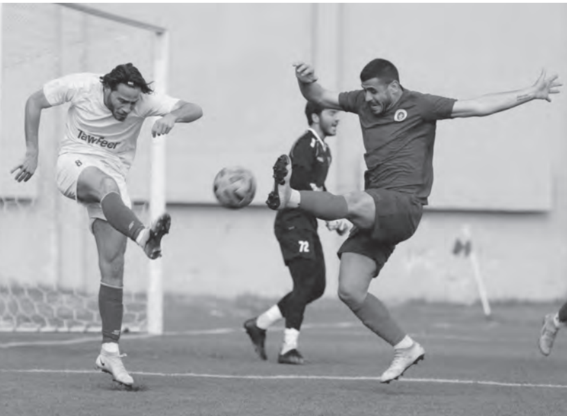
رقصة كروية في لقاء النجمة والصفاء

حقق فريق النجمة فوزاً صعباً على حساب الصفاء بنتيجة (٢-١)، في المباراة التي جرت أمس السبت على ملعب أمين عبد النور في بحدون ضمن منافسات ربع نهائي كأس لبنان.