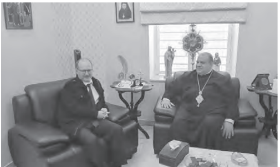
ابراهيم مستقلا السفير النمساوي

مشروع تطوير المتحف البيزنطي في مطرانية سيّدة النجاة، هذا المشروع الذي تبنّته سفارة جمهورية النمسا في لبنان بشخص السفير أمري منذ حوالي السنة، إذ تم تكليف جمعية بلادي بوضع تصور لمشروع متكامل بهدف تطوير المتحف وجعله في متناول كل المهتمين. وعرضت بجالي للسفير المراحل المتقدمة التي وصل إليها المشروع وإمكانية تطبيقه في وقت سريّع، «مما يساهم في إتاحة الفرصة أمام أكبر عدد من الزائرين للإطلاع على تاريخ زحلة وتاريخ كنيسة الروم الملكيين الكاثوليك وتاريخ أبرشية الفرزل وزحلة والبقاع من خلال الصور القديمة والوثائق التاريخية».