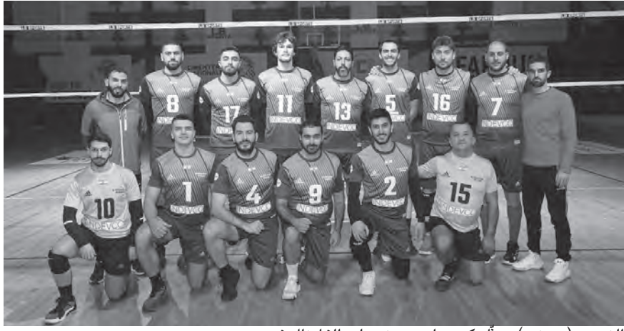
النجوم (جونييه) يمثل كسروان وعينه على الفاينال فور

المركز الثالث في الترتيب بعد انتهاء دور الذهب لنادي