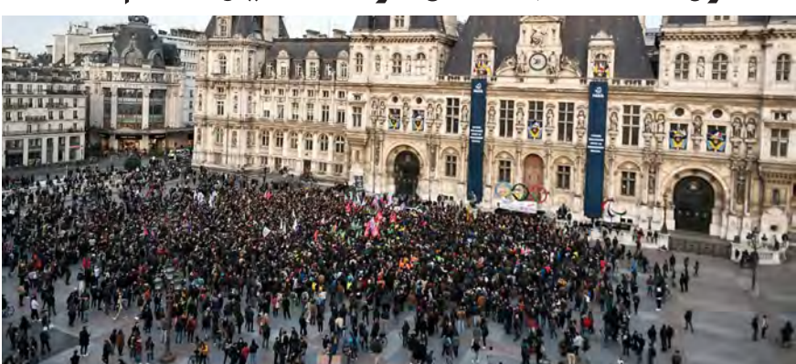
احتجاجات امام بلدية باريس

يبدو ان الرئيس الفرنسي ايمانويل ماكرون مصر على السير حتى النهاية في تطبيقه لقانون رفع سن التقاعد بعد اقراره في الجمعية العامة، كمقدمة لسلسلة قوانين يعزز السير بها، بعدما ضمن ثقة المجلس لحكومته، مراهنا على الوقت في مواجهة