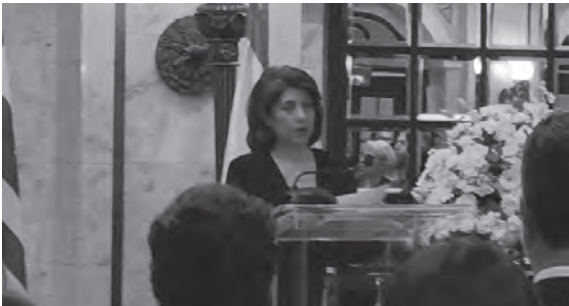
سفيرة اليونان تلقي كلمتها

أكدت السفيرة اليونانية في لبنان كاترين فنوتولاكي، «أننا نؤيد بقوة استقلال لبنان وسلامته الإقليمية وسيادته، الذي يرتبط مع اليونان منذ القدم بعلاقات ممتازة. وفي السياق ذاته، نساهم في مهمة «اليونيفيل»، من خلال المشاركة مع فرقاطة للمكون البحري منذ إنشائها في عام ٢٠٠٦.»