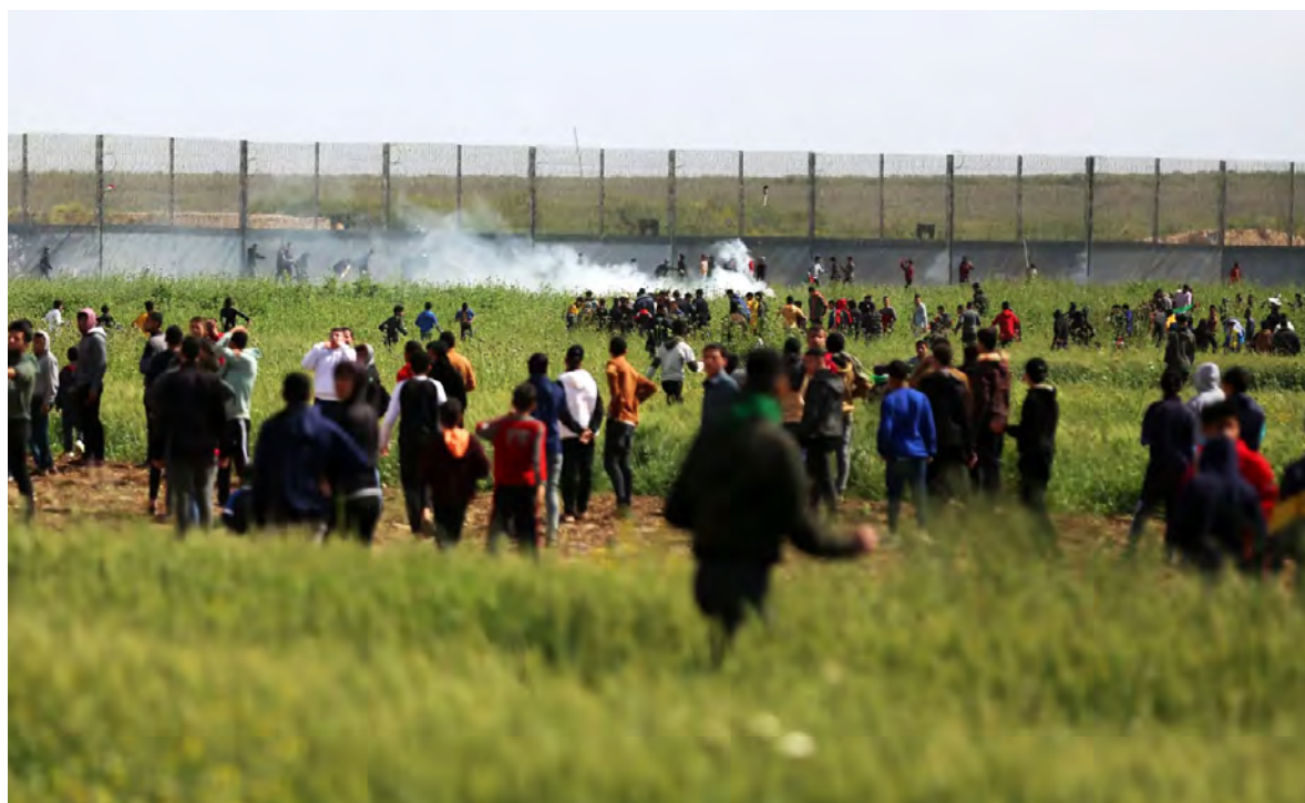
ثورة الشارع في يوم الارض

هدات ثورة الشارع داخل «إسرائيل»، مع نجاح المساعي والمفاوضات في تاجيل بت قانون التعديلات القضائية، في ظل تقدم المفاوضات الجارية، لراب الصبح الذي اصاب الائتلاف الحكومي، حيث حكي عن اتفاق لعودة وزير الدفاع الى منصبه، في وقت اكد فيه غالات، ان «تل ابيب» تشهد فترة أمنية معقدة. تزامناً استهدفت قوات الاحتلال الاسرائيلي في اعتداءاتها الفلسطينية في غزة خلال احيائهم «يوم الارض».