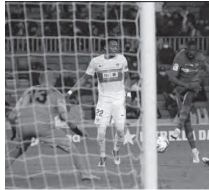
من إحدى مواجهات إلتشي وبرشلونة الكلاسيكو.

يستأنف برشلونة حملة الصراع على لقب الدوري الإسباني بمواجهة خارج أرضه أمام إلتشي، مساء غد السبت في المرحلة ٢٧. ويتصدر النادي الكاتالوني جدول ترتيب الدوري الإسباني برصيد ٦٨ نقطة بفارق ١٢ نقطة عن مدريد، قبل ١٢ جولة من نهاية الموسم.