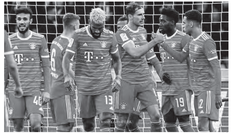
لاعبو بايرن ميونيخ