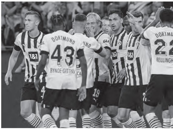
لاعبو بوروسيا دورتموند