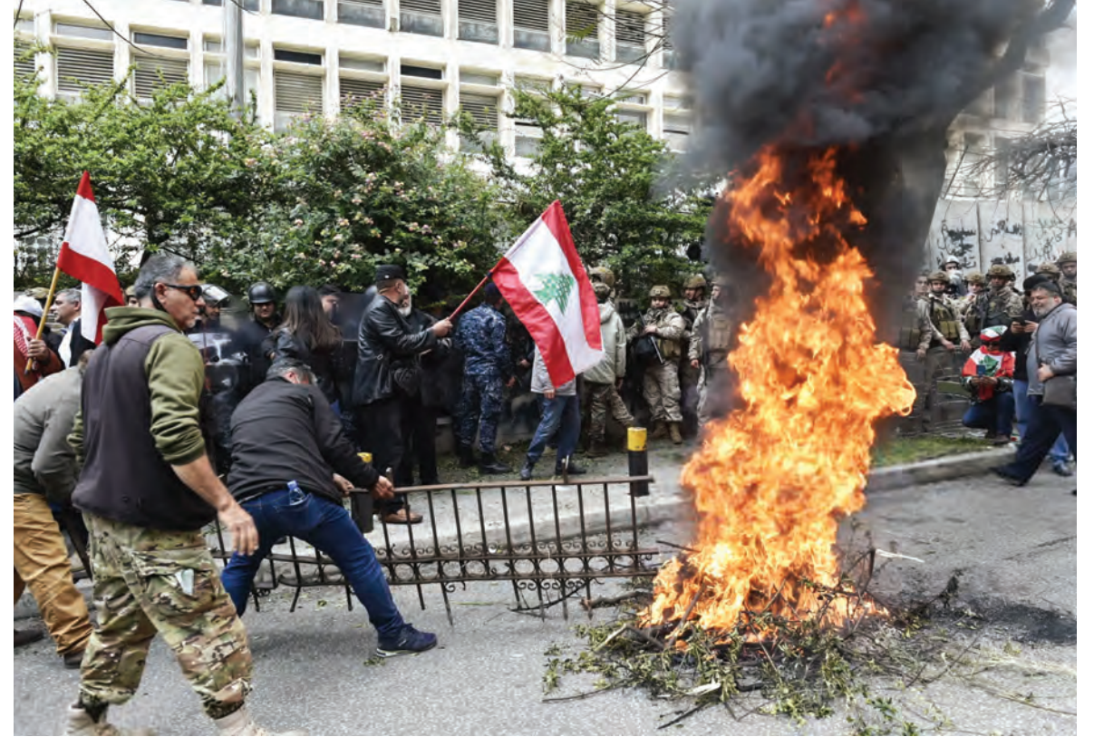
المتقاعدون العسكريون خلال تحركهم امس