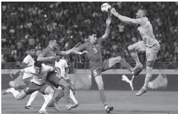
من مباراة المغرب والبرازيل

واصل المنتخب المغربي لكرة القدم عروضه الرائعة التي أبهر بها الجميع في مونديال قطر أواخر العام الماضي بحلولة رابعاً، وذلك عندما حقق فوزاً تاريخياً على ضيفه البرازيلي ٢ على ١ على ملعب ابن بطوطة في طنجة وأمام ٦٥ ألف متفرج في مباراة دولية ودية.