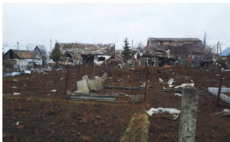
آثار الانفجار في مدينة كيريفسك الروسية

دعت أوكرانيا امس إلى اجتماع طارئ لمجلس الأمن الدولي لمواجهة «الابتزاز النووي» الروسي، بعد أن أعلن الرئيس فلاديمير بوتين أن موسكو ستشتر أسلحة نووية «تكتيكية» في بيلاروسيا.