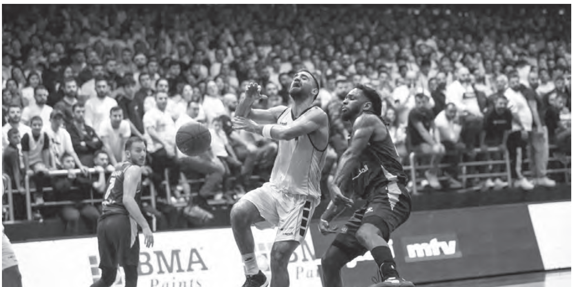
رقصة سلوية في مباراة الحكمة والرياضي