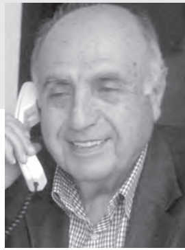
اعداد : لوران ناكوزي