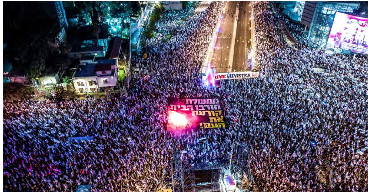
تصاعد حدة التظاهرات في كيان العدو

أقال رئيس الوزراء الإسرائيلي بنيامين نتانياهو أمس، وزير الدفاع يوآف غالانت من منصبه على خلفية معارضته للتعديلات القضائية ودعوته لتعليقها. ونقل موقع «أكسيوس» الأميركي عن مسؤولين إسرائيليين «أن نتانياهو أبلغ غالانت أنه فقد الثقة به لأنه يعمل ضد الائتلاف الحاكم»، متهماً «إياه بتقويض جهود التوصل إلى حل بشأن مسألة التعديلات وعدم التنسيق قبل الإدلاء بتصريحاته».