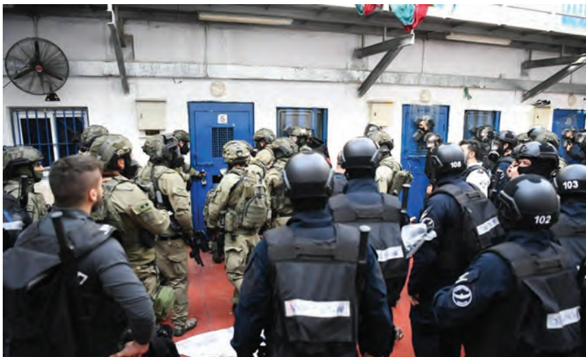
وحدات القمع تقتحم سجن نفحة

اقتحمت جماعات من المستوطنين المتطرفين، أمس، باحات المسجد الأقصى بحراسة مشددة من قوات الاحتلال الإسرائيلي، في حين اندلعت مواجهات مسلحة بمخيم نور شمس شرقي طولكرم بين مقاومين فلسطينيين وقوات الاحتلال. وفي التفاصيل، اقتحمت مجموعات كبيرة من المستوطنين، صباحاً، باحات المسجد الأقصى، بحماية مشددة من قوات الاحتلال، عقب إخلاء المعتكفين منه بالقوة الليلة، حيث قامت قوات الاحتلال فجراً بإفراغ ساحات المسجد الأقصى من المصلين، لتأمين اقتحامات المستوطنين، وأخرجت الشبان من ساحات المسجد تزامناً مع الاقتحامات.