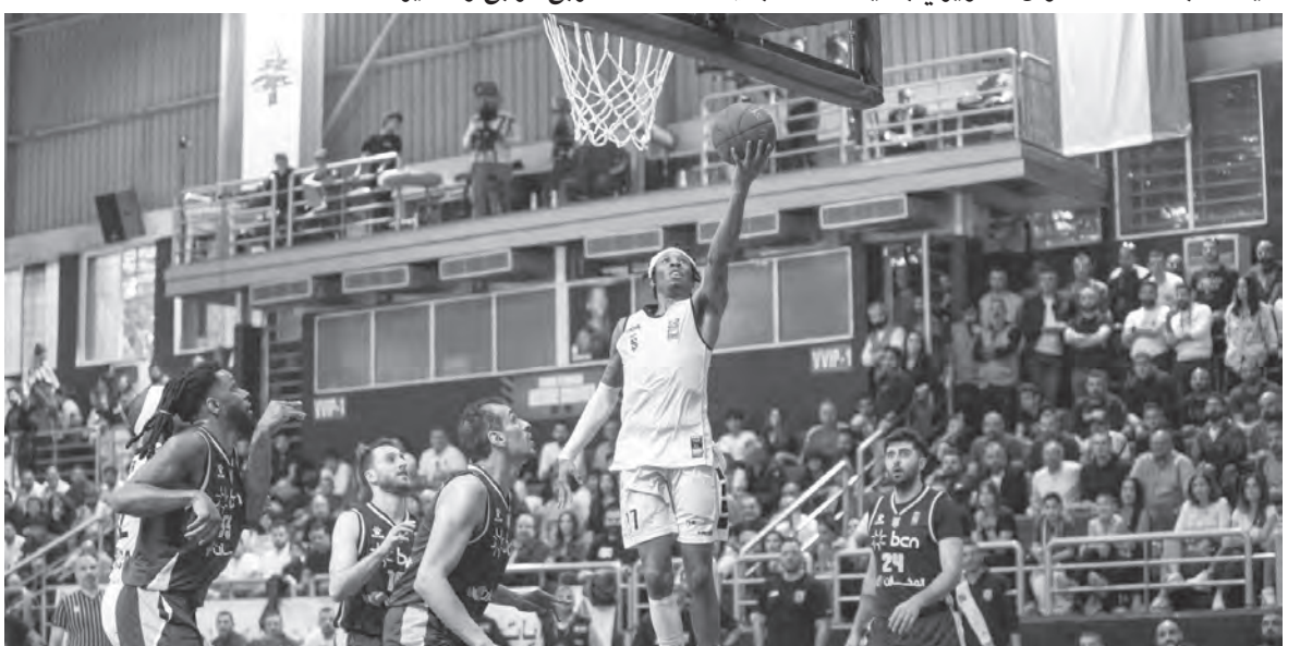
محاولة تسجيل حكماوية

وعرفت المباراة حضوراً جماهيرياً غفيراً من ناحية الحكمة، حيث ضجت قاعة أنطون الشويري بصيحات المشجعين.