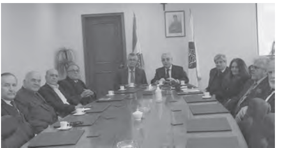
سفير البرازيل في مقر الرابطة

زار سفير البرازيل في لبنان تارسييسيو كوستا «الرابطة المارونية» في مقرها، والتقى رئيسها السفير خليل كرم، في حضور عدد من أعضاء المجلس التنفيذي للرابطة. وكان هناك تبادل بناء لوجهات النظر بين السفير كوستا وعضءاء المجلس التنفيذي حول مختلف العوامل التي هي في اساس العلاقة الطويلة والمتينة بين البرازيل ولبنان، وكيفية تطويرها وتمنيتها.