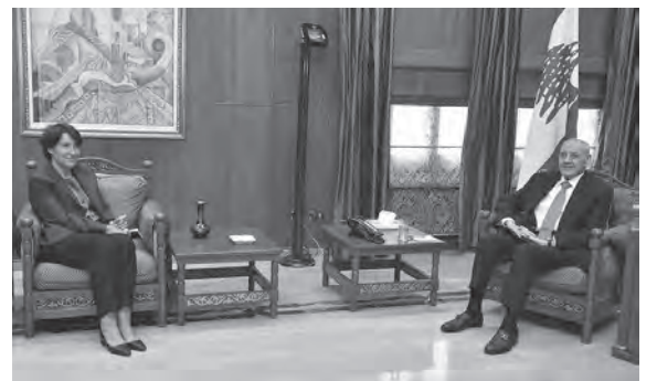
غريو عند بري

استقبل رئيس مجلس النواب نبيه بري في مقر الرئاسة الثانية في عين التينة السفير البابوي في لبنان المونسنيور باولو بورجيا، حيث جرى عرض للأوضاع العامة في لبنان. كما استقبل السفير الفرنسية أن غريو، وبحث معها في آخر المستجدات السياسية والأوضاع العامة والعلاقات الثنائية بين البلدين.