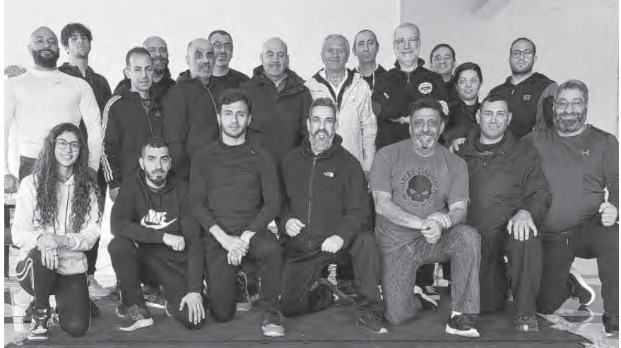
كبار الحضور مع المنخرطين في الدورة

رئيس لجنة التوي شو والتاي ناي شووان، شارحا نظريا وعمليا طرقاستعمال التقنيات وتطبيقها في المباريات كما عدد النقاط التحكيمية في مختلف الحالات. وسوف تستكمل المرحلة الثانية بحسب البرنامج السنوي للاتحاد.