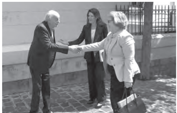
ليف مستقبلاً جنبلاط

كذلك زارت ليف رئيس حكومة تصريف الاعمال نجيب ميقاتي عصر امس، في دارته في حضور السفيرة الأميركية دوروثي شيبا. وخلال اللقاء، تم البحث في الأوضاع الراهنة في لبنان والعلاقات الثنائية ونتائج جولة ليف على عدد من دول المنطقة. واستبقى ميقاتي الوفد الأميركي إلى مائدة الإفطار.