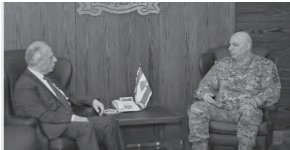
وزير الدفاع مستقبلاً عون

التقى وزير الدفاع الوطني في حكومة تصريف الاعمال موريس سليم في مكتبه في البرزة امس، قائد الجيش العماد جوزاف عون، وأطلع منه على أوضاع المؤسسة العسكرية والوضع الأمني العام في البلاد.