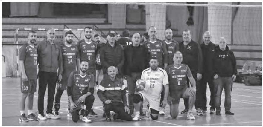
النخل وحنا مع فريق نادي السفارة الأميركية