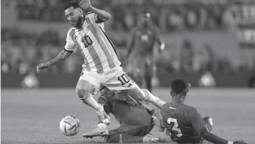
ميسي يخترق دفاع بنما

والعديد من اللاعبين الأرجنتينيين مع أطفالهم إلى الملعب، وبدوا على حافة البكاء، حيث غنى المشجعون بانسجام تام أغنية «موتشاشوس»، نشيد المنتخب الأرجنتيني المتوج في مونديال قطر قبل ثلاثة أشهر باللقب العالمي للمرة الثالثة في تاريخه بعد ١٩٧٨ و١٩٨٦.