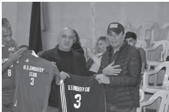
صورة تجمع النخل وحنا

الفخري والبدلة الرياضية اللتين حملتا الرقم ٣ الى حنا.