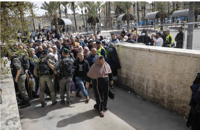
رغم الإجراءات المشددة المصلون دخلوا الأقصى