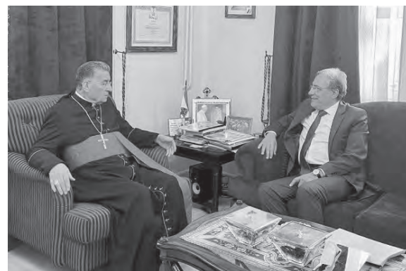
الراعي مستقبلا وزير العدل هنري الخوري

ذخائرهم مختلطة مع ذخائر الطوباويين الشهداء الفرنسيين الذين استشهدوا معهم في كنيسة ديرهم، وهذه علامة لوحدة الدم بين الشرق والغرب؛ وأخيرا أنهم من دمشق. وعهد بهجة لكنيستنا وأبرشيّاتنا في لبنان وسوريا والنطاق البطريركي وبلدان الانتشار..