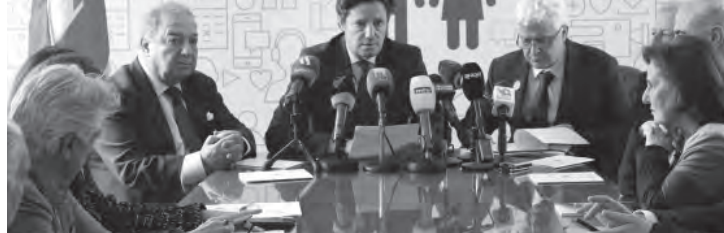
خلال توقيع الشراكة

نظمت وزارة الإعلام في لبنان بالتعاون مع اليونسيف ومنظمة «كفى» لقاء مع المؤسسات الإعلامية حول كيفية حماية الأطفال والمراهقين في وسائل الإعلام، بهدف حماية مصالحهم الفضلى وتعزيز الممارسات الجيدة، ومناصرة قضايا الطفل على مختلف المستويات. وألقى وزير الإعلام في حكومة تصريف الاعمال زياد المكاري كلمة قال فيها: «وسائل الاعلام هي الجهة القادرة على نشر التوعية حول ضرورة حماية الأطفال بطريقة تقيم الأذى والإساءة. وهي شريك اساسي في حماية الطفل والدفاع عن حقوقه من خلال الإضاءة على معاناته وهمومه وتعرضه للعنف والإساءة والحرمان، من دون انتهاك خصوصياته أو المس بمشاعره. من هنا أتت فكرة هذا اللقاء بالتعاون مع اليونسيف ووزارة الشؤون الاجتماعية والمجلس الاعلى للطفولة ومؤسسة «كفى»، لتأكيد التعاون في ما بيننا من خلال بذل جهود مشتركة للإضاءة على