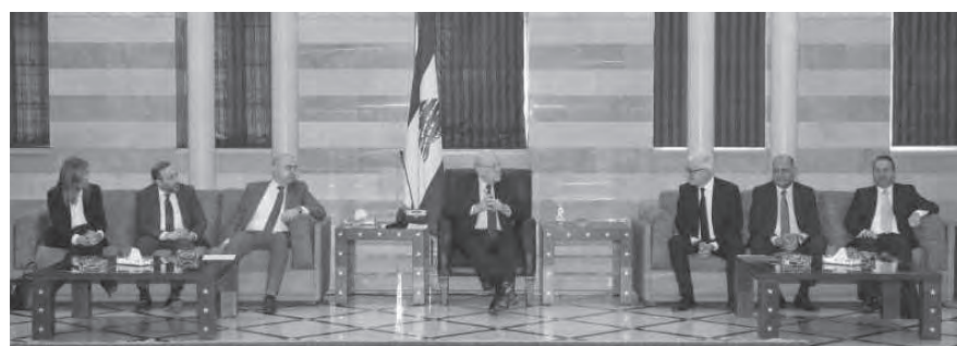
ميقاتي مستقبلا وفد «اللبنانية»

الضوء مجددا على موضوع اتعاب pcr «للجامعة» والتي تبلغ حوالي ٥٢ مليون دولار، والتأخير في بت هذا الملف كأننا نقول ان العدالة المتأخرة هي ظلم مجحف.»