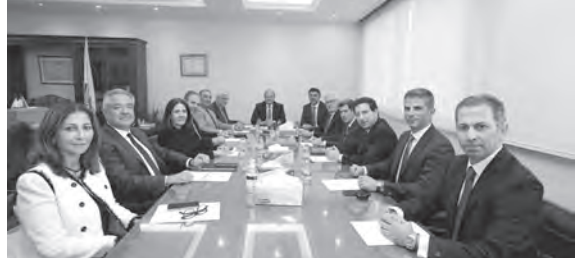
كسبار مستقبلا زواره

في ملف انفجار المرفأ وفي ملف أموال المودعين، وتقدّمت بمراجعة أمام مجلس شوري الدولة ضد مصرف لبنان، وفي مطلق الأحوال فإن جميع المواطنين والمؤسسات والنقابات تحت سقف القانون. والقضاء موجود لإعطاء كل ذي حق حقه. فإذا كان المجلس على خطأ يفسخ قراره وإذا كان على حق يصدّق قراره. وختم قائلا: وردتنا مئات الاتصالات حول ما يحصل من تجاوزات ومن فوضى ومن تضليل ودعاية. كما تأكد المجلس من أن هناك منظمات وجمعيات وجهات داخلية وخارجية تستند بالبعض من أجل بث الكلام الذي لا تستطيع هي بثه. كما وإصدار منشورات من قبلهم بعد تمويلها من قبل هذه الجهات. هذا بالإضافة إلى أن عشرات المواطنين يحضرون إلى النقابة ويدعون بأنهم أكلوا هذا المحامي أو ذاك بسبب إطلاقاته الإعلامية، ليتبيّن لهم لاحقا أنه لا يتمتع بالكفاءة اللازمة ويودون استعادة أتعابهم منه. وبالتالي يستحصلون على الأموال الطائلة ويصبح بإمكانهم تمويل بعض، ونقل بعض «السايات» المأجورة التي أصبحت بالألاف، وهدفها الابتزاز لمهاجمة نقابة عريقة ولدت قبل لبنان الكبير، أو مجلس نقابة منتخب من قبل الجمعية العمومية من دون أي أساس قانوني أو علمي أو منطقي.