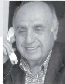
اعداد : لوران ناكوزي

تبدأ حفلة السباق الساعة الثانية عشرة والنصف بشوطين فرنسي اول