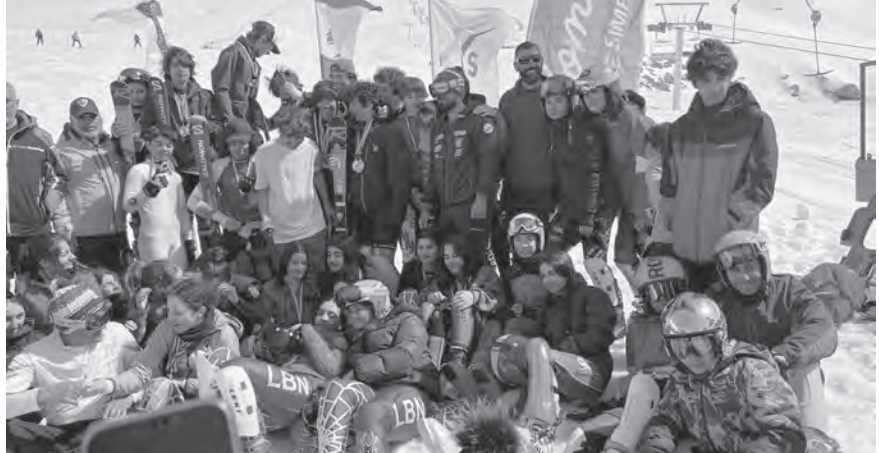
صورة تذكارية للفائزين والفائزات

نظم الاتحاد اللبناني للتزلج والبياتلون المرحلة الثانية من بطولة لبنان في التزلج الأبني لفئة الأوالد في الأرز على منحدرات جبران خليل جبران. وقد أقيمت السباقات بمشاركة لاعبين لبنانيين يمثلون الأندية الاتحادية.