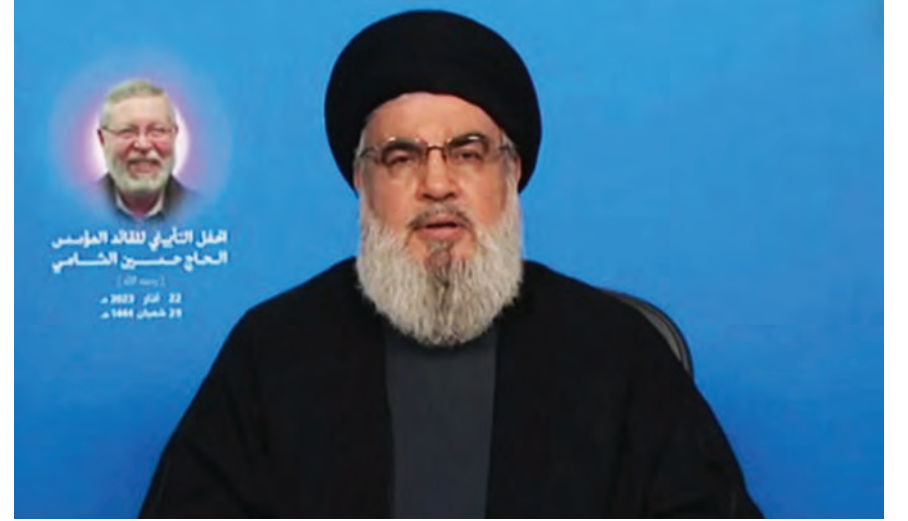
نصرالله يلقي خطابه امس