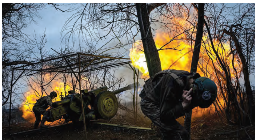
المعركة في محيط باخموت

وفقا لوزارة الدفاع الروسية، فان قواتها قد احكمت الطوق على حوالي ٧٠٪ من مدينة باخموت، الذي زار جبهتها الرئيس الأوكراني متفقدا عسكريه، في وقت وجهت فيه موسكو تحذيرا لواشنطن من ان صبرها سينفذ، في ردها على الاحداث التي شهدتها اجواء البحر الاسود.