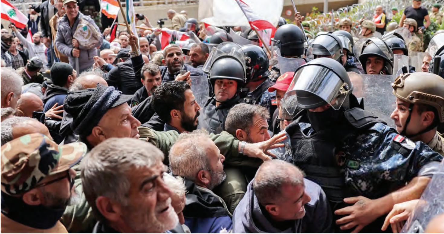
مواجهات بين المتقاعدين العسكريين وقوى الأمن