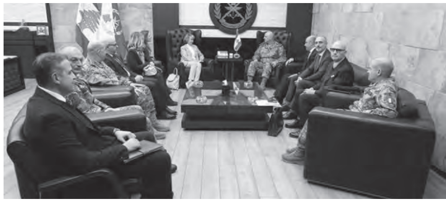
قائد الجيش مستقبلاً وفد مجلس الشيوخ الايطالي

التحديات التي يعاني منها لبنان، خصوصاً في موضوع النازحين، الأمر الذي يشكل عبئاً لا يمكن احتماله». وأبدت كاراكسي تفهمها وتعاطفها مع لبنان في هذا الملف.»