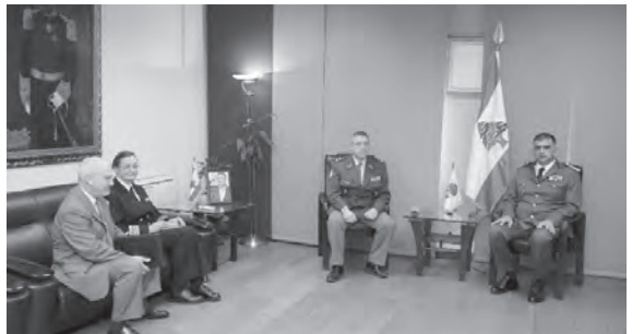
عثمان مستقبلا وفد هيئة الأمم المتحدة

استقبل وزير الخارجية والمغتربين في حكومة تصريف الاعمال عبدالله بو حبيب، وفد هيئة الأمم المتحدة لمراقبة الهدنة UNTSO، برئاسة رئيس الهيئة اللواء باتريك غوشا، وجرى عرض لعمل الهيئة ودورها في تعزيز الأمن والاستقرار في جنوب لبنان. والتقى اللواء باتريك غوشا مع وفد، المدير العام لقوى الأمن الداخلي اللواء عماد عثمان ظهر امس في مكتبه في تكتة المقر العام، في زيارة تم خلالها البحث في الأوضاع العامة في البلاد.