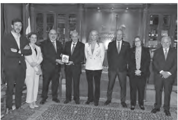
بري والوفد الاسباني (حسن ابراهيم)

زارت لجنة العلاقات الخارجية في البرلمان الإسباني برئاسة النائب باو ماري كلاوس وأعضاء اللجنة في حضور السفير الإسباني في لبنان خيسوس سانتوس أغوادو، رئيس مجلس النواب نبيه بري في عين التينة، وتناول اللقاء الأوضاع العامة في لبنان والمنطقة والتعاون التشريعي بين برلماني البلدين. كما بحث وفد البرلمان الاسباني وزير الخارجية والمغتربين في حكومة تصريف الاعمال عبدالله بو حبيب، في المساعدات التي تقدمها اسبانيا لبنان ومشاركتها في قوات الطوارئ الدولية العاملة في جنوب لبنان (يونيفيل) والعلاقات الثنائية بين البلدين وملف النزوح السوري.