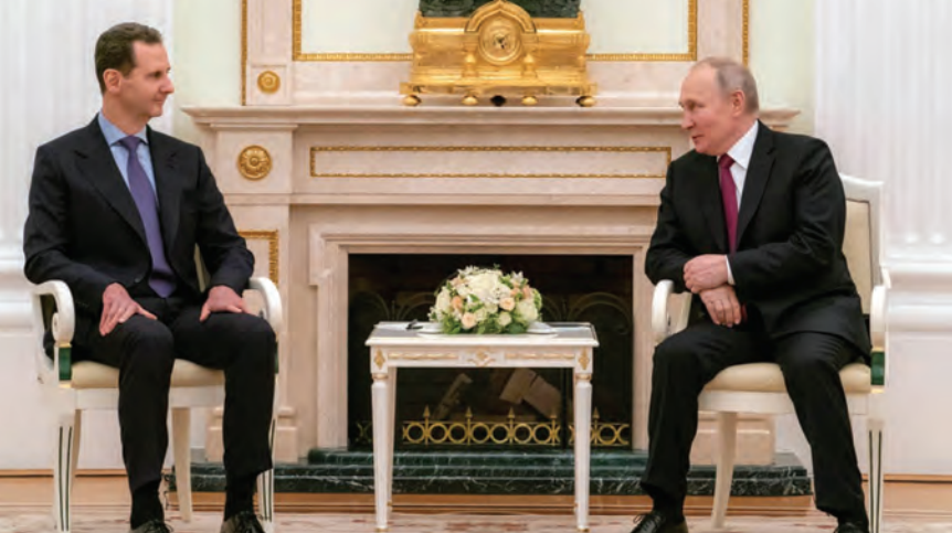
بوتين والأسد خلال لقاتهما امس

بحث الرئيس بشار الأسد مع نظيره الروسي فلاديمير بوتين خلال جلسة محادثات موسعة طيفاً واسعاً من الملفات السياسية والاقتصادية، وناقش الزعيمان العلاقات الثنائية والتعاون المشترك بمختلف أشكاله، والتطورات المستجدة على الساحتين الإقليمية والدولية. وبحسب بيان رئاسة الجمهورية العربية السورية تناولت المحادثات العلاقات الاستراتيجية بين البلدين والمبتنية على المبادئ والمصالح والقيم المشتركة التي تجمعهما، والعمل لتعزيز هذه العلاقات بما يصب في مصلحة الشعبين في مرحلة تشهد تحولات غير مسبوقة على مستوى العالم. وتابع البيان: نال الشأن الاقتصادي مساحة واسعة من مباحثات الرئيسين الأسد وبوتين، حيث جرى النقاش في توسيع التعاون الاقتصادي والتجاري بين البلدين، والبحث العميق في الملفات الأساسية التي جرت مناقشتها في اجتماع