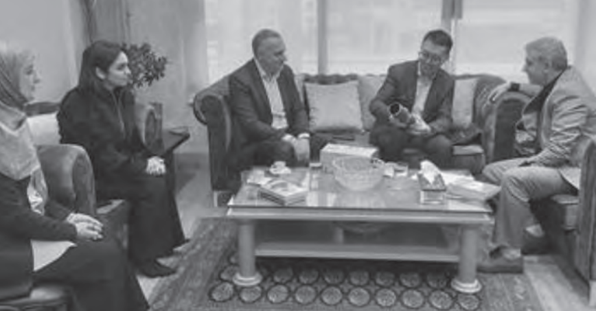
بيرم مع الوفد

عليها قر بيا ، والاستعداد للمساهمة في تجهيز قاعة تدريب متخصصة وحديثة في وزارة العمل. علماً أن المذكرة ستضم طرفاً ثالثاً هو جامعة AUST لتقديم القاعات في مختلف فروعها للتدريب المهني المجمل والمجاني للشباب اللبناني.