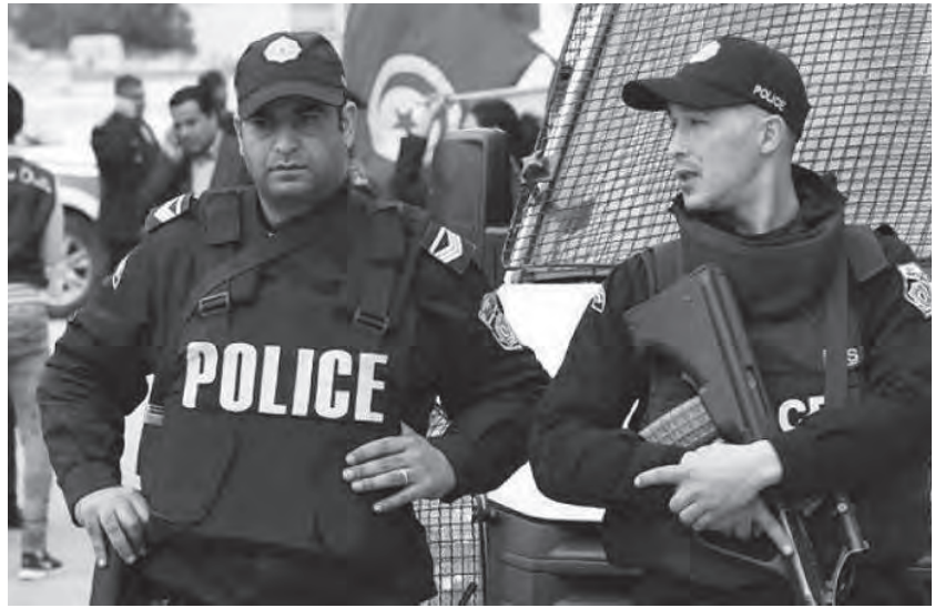
وحسب بيان الرئاسة التونسية، جاء ذلك خلال استقبال قيس سعيد رئيس البرلمان الجديد إبراهيم بودريالة، أمس الثلاثاء، لتهنئته

أقلت قوات الأمن التونسية القبض على إرهابي في منطقة طبرية شمال البلاد. ونقل موقع (موزاييك إف إم) التونسي عن المتحدث باسم الحرس الوطني قوله في بيان له: «ضبطت دورية تابعة لفرقة الأبحاث والتفتيش بمنطقة طبرية مساء أمس شخصاً صادرة بحقه ثلاث مذكرات بحث، لانتمائه إلى تنظيم إرهابي». وكانت قوات الأمن التونسية أقلت القبض في الثالث من الشهر الحالي على إرهابي في ولاية قبلي جنوب البلاد. على سعيد آخر، قال الرئيس التونسي قيس سعيد «إن بلاده تخوض معركة تحرير وطني»، لافتاً «إلى أن الواجب المقدس في أي موقع هو الاستجابة لخطاب الشعب المشروعة في جميع المجالات».