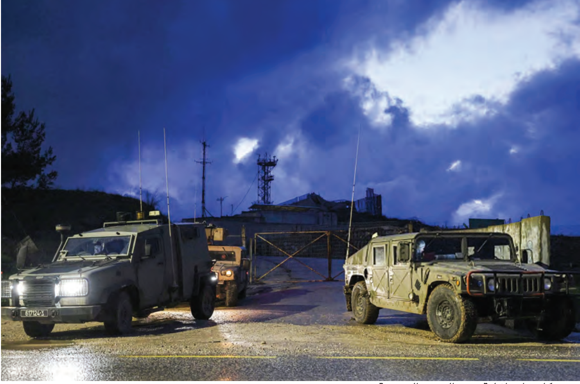
...تحركات «إسرائيلية» عند الحدود الجنوبية