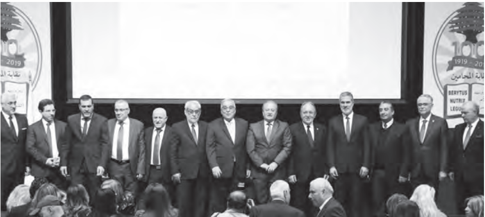
المشاركين في المؤتمر

انعقد امس مؤتمر «المغرب اللبناني - واقع وتحديات»، في «اليوم العالمي للمغرب اللبناني»، برعاية وزير الخارجية والمغتربين في حكومة تصريف الأعمال عبد الله بو حبيب، في نقابة المحامين في بيروت - بيت المحامي - قاعة المؤتمرات الكبرى، وبدعوة من نقيب المحامين في بيروت ناصر كسبار ولجنة حماية حقوق المغرب اللبناني، في حضور وزير السياحة في حكومة تصريف الأعمال وليد نصار، النواب: مقرر لجنة الشؤون الخارجية والمغربيين في مجلس النواب هاغوب بقرادونيان، قبالن قبالن وناصر جابر، نقيب المحامين كسبار وعضاء مجلس النقابة، ممثل مكتب العلاقات الخارجية والمغربيين في حركة «أمل» المحامي علاء اللقيس، ممثلي عدد من السفارات وديبلوماسيين، وحشد من المغتربين والموظفين الكبار.