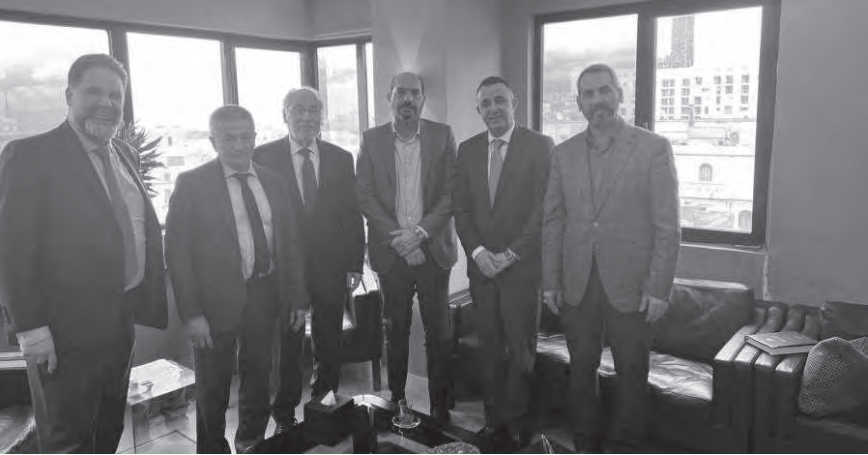
الخليل مستقبلاً وزير التربية والوفد المرافق

وقّع وزير المال في حكومة تصريف الأعمال يوسف الخليل طلب فتح حساب لمصلحة وزارة التربية والتعليم العالي لتحويل قيمة السلفة التي أقرها مجلس الوزراء بقيمة /١٠٥٠/ مليار ليرة لبنانية في إطار خطة إنقاذ العام الدراسي. سبق ذلك لقاء عُقد في مكتب الوزير الخليل في وزارة المال ضمّ وزير التربية والتعليم العالي في حكومة تصريف الأعمال عباس الحلبي ومدير عام التربية عماد الأشقر ورئيس لجنة