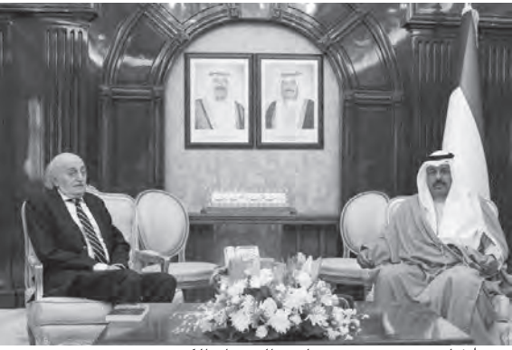
جنبلاط يزور رئيس مجلس الوزراء الكويتي

كبير»، شدّد على وجوب أن «نستمر فيه ونذكر أن ما من موقف بلدي بلدي الآخر»، مجدداً دعوته إلى الحوار».