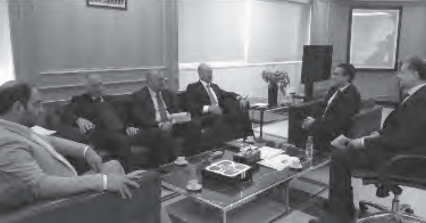
حمية خلال المناسبة

تحول الى الخزينة العامة، وكذلك كان الامر بالنسبة لمرافق طرابلس حيث كان لتفعيل وتطبيق القوانين وجهد العاملين ركائز ثلاث أمّنت له وفراً في ايراداته، ولنعمل من خلاله على تطويره ومحيطه وبيئته وفقاً للأصول القانونية.