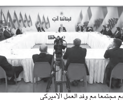
جعجع مجتمعاً مع وفد العمل الأميركي

وقال: «الاتفاق على هذا الملف هو خطوة مهمة في مسيرة لبنان، ونحن نأمل أن يكون هذا الاتفاق قد يفتح آفاقاً جديدة للتنمية والنمو في لبنان».