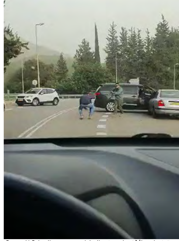
«توقيف احد الأشخاص في الجليل...» حسب الرواية المزعومة