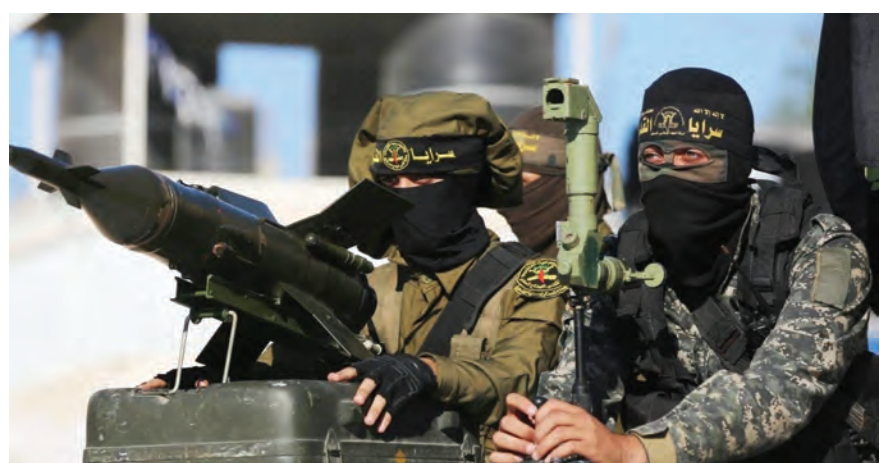
مناورات سرايا القدس

ظهرت خلال الفترة الأخيرة، بصورة جلية الانقسامات داخل كيان الاحتلال، حيث شكّلت الأزمنة الحالية في «إسرائيل» محطة لم يعد الاحتلال التعامل مع مثيلاتها سابقاً، إذ لم يسبق أن شهد حركة اعتراف واسعة ضد حكومة تقودها إحدى الشخصيات السياسية الإسرائيلية الأساسية مثل نتنياهو، وتراشقاً اعلامياً بين قياداتها بهذا الحجم ومن هذا العيار. كما لم تقتصر التظاهرات التي عمت الاحتلال على فئات أو جماعات محددة، بل اتسعت رقعتها الجغرافية بصورة كبيرة، وصولاً إلى تنظيم احتجاجات في ما يقارب ١٠٠ موقع وشارع وساحة في فلسطين المحتلة. فقد ذكرت وسائل إعلام «إسرائيلية»، أنّ رئيس حكومة الاحتلال الإسرائيلي بنيامين نتنياهو أدخل الاحتلال إلى عملية تفكيك سريعة، وأكدت أنه «غير مؤهل لإدارة إسرائيل».