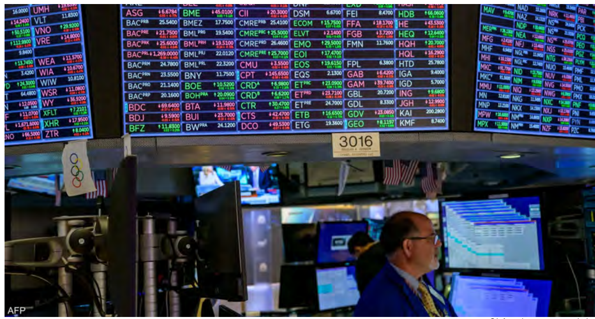
ماذا يحدث في اميركا؟

تراجع مؤشرات الأسهم الأميركية، ووقف التداول في العديد من البنوك، مع تهاوي سعر سهم مصرف «فيرست ريبابليك» الأميركي بأكثر من ٦٥٪. فقد تراجع سهم مصرف «فيرست ريبابليك» الأميركي امس، بأكثر من ٦٥٪ مع بدء التداول في سوق اسهم «وول ستريت». كذلك، تراجعت اسهم بنوك أخرى، مع تهاوي سعر سهم البنك نفسه ريبابليك. كذلك، تراجعت مؤشرات الأسهم الأميركية، بعد أن أدى انهيار بنك «سيليكون فالي» إلى تأجيج المخاوف