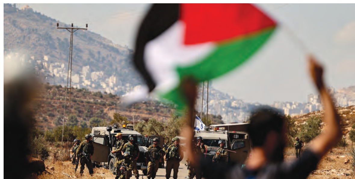
مواجهات في الضفة

بيد ان جولة وزير الخارجية الاميركية الشرق اوسطية، قد حركت المياه الراكدة فلسطينياً، فحط رئيس الوزراء الاسرائيلي في باريس حيث التقى الرئيس ايمانويل ماكرون، في وقت زار فيه ملك الاردن البيت الابيض لبحث الملف الفلسطيني، على وقع استمرار تصعيد الاحتلال لوتيرة اعتدائه العسكرية، في موازاة تقديرات استخباراتية اميركية حول انتفاضة ثانية، فيما كان وفد مخابراتي مصري يصل الى «اسرائيل» في مهمة عاجلة.