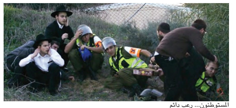
المستوطنون... رعب دائم

ص ناقش برنامج العمل الاقتصادي للسوداني ص ٩ اتصال بين بايدن ورئيس الحكومة العراقية