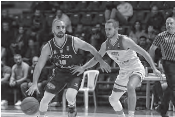
من مباراة هوبس والرياضي بيروت