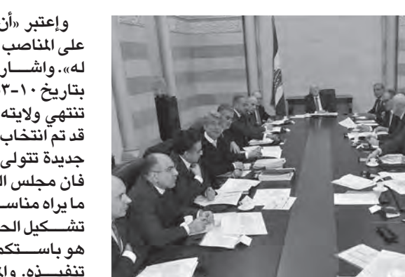
ميقاتي يترأس الاجتماع

ورداً على سؤال قال: «إن حديث البعض عن عدم ميقاتية الجلسات هو حديث مغلوط، حيث شارك في الجلسة سبعة وزراء مسيحيين من اصل اثني عشر وزيراً مسيحياً. اما القول إننا نريد مصادرة صلاحيات رئيس الجمهورية فهو غير صحيح، فما نقوم به يرض عليه الدستور، في انتظار انتخاب رئيس جديد. الحل لموضوع الرئاسة يبدأ باتفاق المسيحيين في ما بينهم وبالتالي هذا الموضوع منط بمجلس النواب. إنتخاب الرئيس هو المدخل الى الحل من اجل إعادة الدور لكل المؤسسات الدستورية، لكون هذا الانتخاب يعطي فترة سماح لاستنهاض الوطن»، مضيفاً «وقبل الدعوة الى عقد جلسات للحكومة، التقيت خبراً عدد ستوريين أجمعوا على وجوب عقد الجلسات عند الضرورة وتوقيع رئيس الحكومة والوزراء المختصين».