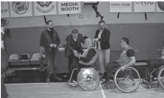
توزيع الميداليات التذكارية

برعاية وحضور النائب ناصر جابر، أقام نادي نصر النبطية مباراة ودية لكرة السلة للكراسي المتحركة جمعتهم مع جمعية المنية لرياضة المعوقين في قاعة رياض الصلح الرياضية في النبطية. المباراة شهدت منافسة حادة بين الفريقين في الـربعين الأول والثاني، إلا أن فريق نادي النصر حسم النتيجة في الـربعين الأخيرين لتنتهي المباراة لمصلحته بنتيجة (٤٠-٢٨). وفي نهاية اللقاء، سلم راعي الحفل النائب جابر ونائب رئيس اتحاد كرة السلة سامي ناصر الفريقين الدروع التكريمية والميداليات التذكارية.