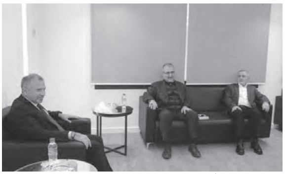
باسيل مستقبلاً وفداً من حزب الله

القضائي، والنوب القضائي الذي يجب أن يكون أبيض تعرض للكثير من النقاط السود، ومنها ملف المرفأ»، مضيفاً «إن تفاهم مار مخايل قائم، ولم نر أي امتعاض من النائب باسيل في هذا الخصوص، ونحن في بلد فيه نقاش سياسي دائم، ونحن لسنا حزباً واحداً بل حزبان ولدينا طريقتي تفكير، ولكننا نعمل على المساحات المشتركة».