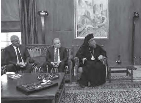
بري مستقبلا الوفد العكاري

وأن يهديه الله لروحه القدوس لخير البلاد والعباد وأن يسهل طريقه لإنتخاب رئيس للجمهورية الذي تحتاجه البلاد لكل أنواع الإحتياجات ولإستقامة الأمور وسهولة تحرك البلد»، مضيفاً «نعم الرئيس بري هو دولة بكل معنى الكلمة لأهتماماته وكما ما أتينا إليه نجد عنده الصدر الرحب والعقل والذهن المتفتح لكل الأمور فنعود إلى بلدانا في عكار ونحن أمنين سالمين. قواه الله وأعطاه الصحة والعافية وأعوانه لخير البلاد والعباد».