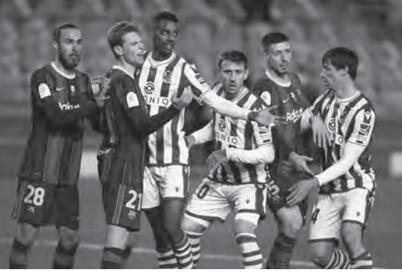
من إحدى مواجهات برشلونة وريال سوسيداد

وتجددت المواجهة في نسخة ١٩٩٠ وفاز برشلونة ٣-٤ بمجموع مباراتي ربع النهائي، ثم فاز البارسا ٣-١ في مجموع المباراتي نصف نهائي ٢٠١٤. وأخيراً التقيا في ربع النهائي سنة ٢٠١٧ وفاز العملاق الكاتالوني ٤-٣ بمجموع المباراتين.