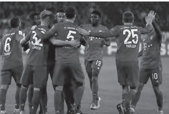
لاعبو بايرن ميونيخ بمواجهة كولن اليوم

وسيعتقد هالر الآن عن هدفه الأول مع فريقه الذي عاد إلى سكة الانتصارات بعد هزيمتين توالياً قبل التوقف ويحتل المركز السادس برصيد ٢٨ نقطة. وفي أبرز المباريات الأخرى، يلتقي لايبزيغ الخامس مع مضيفه شالكه، علماً أنه لم يخسر في مبارياته الـ١٤ الأخيرة في جميع المسابقات، بينها ٩ في الدوري.