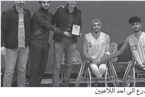
.. ودرع إلى احد اللاعبين