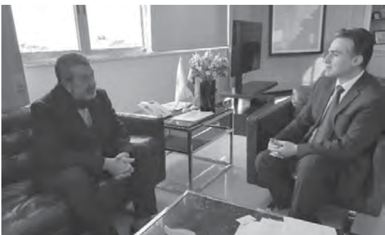
حمية مستقبلاً الحجيري

التقى وزير الاشغال العامة والنقل في حكومة تصريف الاعمال الدكتور علي حمية في مكتبه امس، النائب لمحم الحجيري، وكانت مناسبة لعرض التطورات الراهنة في البلاد، لا سيما الملفات التي تقع ضمن صلاحيات وزارة الاشغال العامة والنقل ومنها موضوع صيانة وتأهيل الطرق في بعلبك الهرمل والطرق المؤدية الى بلدة عرسال.