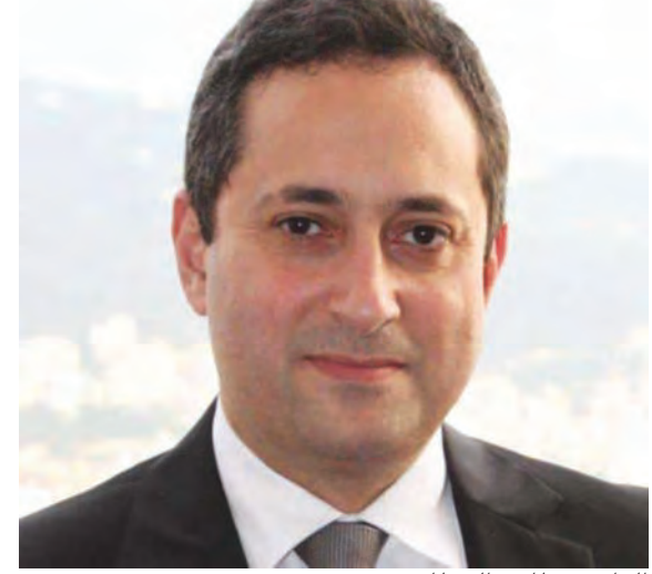
القاضي طارق البيطار

معلقة استند إليها، تقوم على أن «المجلس العدلي هو محكمة خاصة أنشأها القانون للنظر في نوع خاص من الجرائم الهامة والخضرة التي حددها المادة ٣٥٦ من قانون اصول المحاكمات الجزائية، وفيما تتجه النيابة العامة التمييزية الى التعامل مع القرار الصادر عن البيطار «وكأنه منعدم الوجود»، ما يعني أنها لن تتخذ قرار إخلاء السبيل ولا قرار الإدعاء التي اصدرها، صدر عن وزير العدل في حكومة تصريف الاعمال هنري الخوري بيان «ملتبس» قال فيه «تداول وسائل الاعلام مقتطفات من قرار