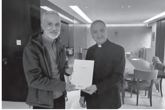
تبادل الاتفاقية بين جلع وكوبلي