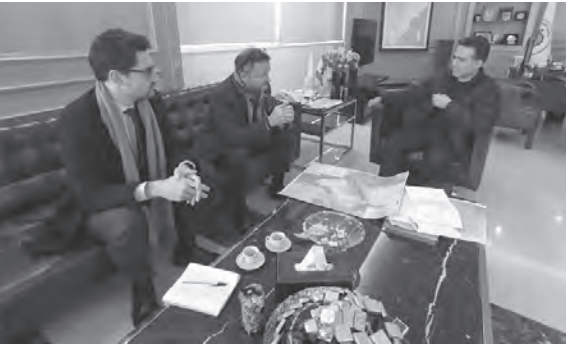
الوفد عند حمية

استقبل وزير الأشغال العامة والنقل في حكومة تصريف الأعمال الدكتور علي حميه في مكتبه في الوزارة، رئيس القسم الاقتصادي في السفارة الفرنسية فرانسوا سوبرير، وأجرى جولة أفق تناولت المشاريع التي تم بحثها سابقاً وتعنى بها الوزارة، والمتعلقة بالمرافق العامة، منها، إعادة إعمار مرفأ بيروت ومشروع إحياء خط سكك الحديد، إلى الخطط التي تقوم بها الوزارة لتعزيز تفعيل العمل في مرافقها العامة. وأكد حميه أن «نهضة لبنان تكمن في تفعيل العمل في مرافقه العامة»، مشيراً إلى أنه «من مرفقين فقط وهما مرفأ بيروت ومطار رفيق الحريري الدولي، قد تم رفد الخزينة العامة للدولة بمئات ملايين الدولارات»، متوقفاً أن «تكون إيرادات المرافق التابعة للوزارة عموماً أعلى بكثير في موازنة عام ٢٠٢٣». وأشار إلى أنه «تم الاتفاق على قبول العرض الذي قدمته الدولة الفرنسية الذي يعنى بتمويل تكليف خبراء واستشاريين