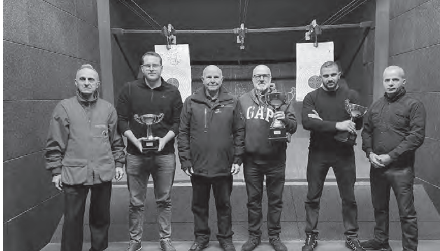
جلع متوسطا الفائزين

بتحكيم المسابقة وعدد من الهواة والمشجعين.