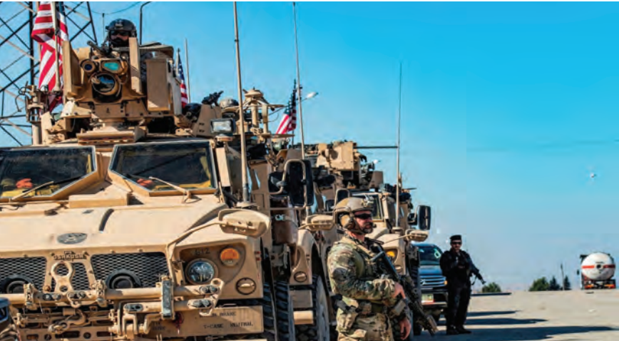
قوات التحالف في سوريا

طرف، فيما كانت منطقة درعا تشهد عملية نوعية لقوات الامن السورية انتهت الى مقتل العملية، في مقابل عدم توجيه الاتهام لاي