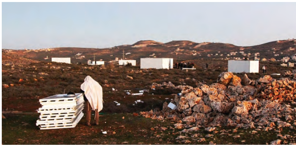
بؤر استيطان عشوائية شرق نابلس

على نار المواجهة بين السلطين القضائية والسياسية يستعد رئيس الوزراء الاسرائيلي بنيامين نتانياهو لتوجيه ضربة لاتلاقه الحاكم، في ظل مواقف واشنطن المتمايزة، والتي تظهرت في تصريحات المسؤولين الاميركيين الموجودين في تل ابيب، وآخرهم جاك سوليفان، الذي وفقاً لوزير الدفاع الاسرائيلي السابق، بني غانتس، ناقش تميمق التعاون لتكثيف العمليات ضد ايران. فقد التقى بيني غانتس،