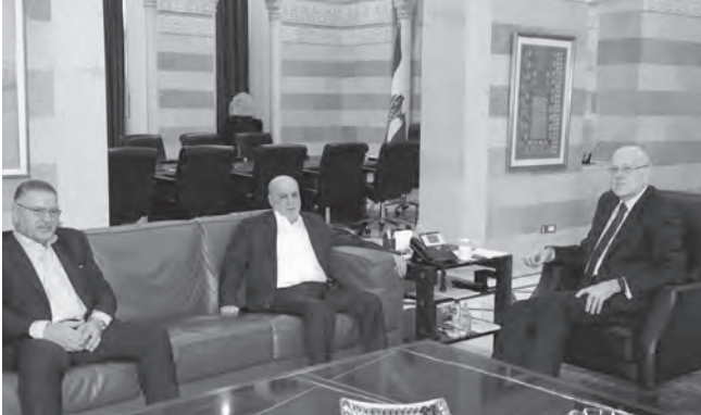
ميقاتي مستقبلاً شري وفاض (دالاتي ونهرا)

التعاون مع الجميع، ولكن على قاعدة اعادة كل ودائع المودعين وعدم التساهل في هذا الموضوع اطلاقاً. كما تطرقنا ايضاً الى قضايا إيمائية شديدة الاهمية». وتابع «كذلك بحثنا في موضوع الجامعة اللبنانية، حيث ان الاساتذة الذين تفرغوا وتقاعدوا لم يتم ادخالهم الى الملك، وهذا من الموضوعات التي وضعت على الطاولة، وقد ابغنا الرئيس ميقاتي ان هذا الموضوع في طريقه الى المعالجة بالطريقة المناسبة، وأنا اعتقد انه اصبح في نهايته. كما نظرنا ايضاً الى قضايا اخرى تتصل بشؤون الناس وحاجاتهم الحياتية في هذه المرحلة الصعبة». واستقبل الرئيس ميقاتي النائب أحمد الخير، فمحافظ بيروت القاضي مروان عبود.