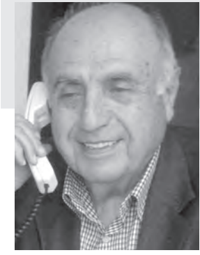
اعداد : لوران ناكوزي