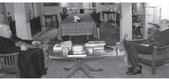
جنبلاط مستقبلاً المطران مطر

استقبل رئيس الحزب التقدمي الاشتراكي وليد جنبلاط في كلمته مساء امس الاول، المطران بولس مطر وعرض معه التطورات السياسية الراهنة.