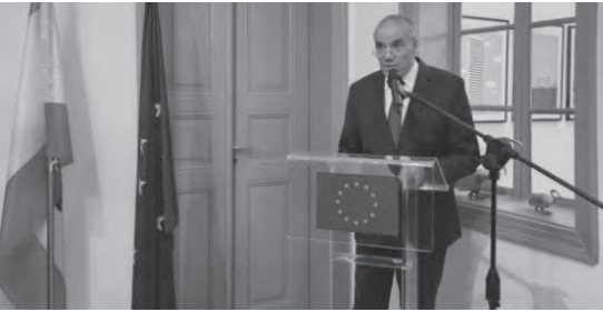
طراف يلقي كلمته