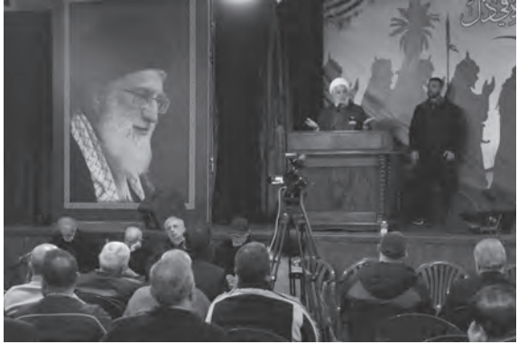
قاسم يلقي كلمته

من الشرائح الموجودة في لبنان، من المفروض أن نتعاون مع الشرائح الأخرى حتى يأتي هذا الرئيس وإن شاء الله يكون هذا الأمر قريباً». ● رأى نائب رئيس المجلس التشريعي في حزب الله الشيخ علي دعموش خلال خطبة الجمعة «أن لبنان بات على مسافة قريبة من انهيار الشامل إن لم يبادر المسؤولون لتحمل مسؤولياتهم، وباتت الدولة ومؤسساتها مشلولة ومعطلة والمواطنون هم من يدفع الثمن، وبدل أن يسارع السياسيون للتفاهم لإنقاذ ما يمكن إنقاذه، تراهم يثلهون بالخلافات والكيديات والمناكفات التي تعمق المشكلات وتزيد من الانقسامات في البلد».