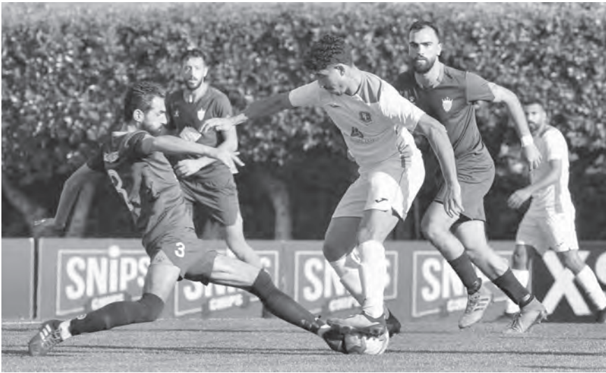
من مباراة الراسينغ وتجمع شباب بعلبك