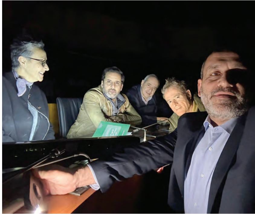
اعتصام النواب في البرلمان