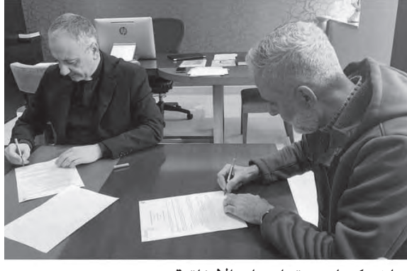
جلع وكوبلي يوقعان على الاتفاقية