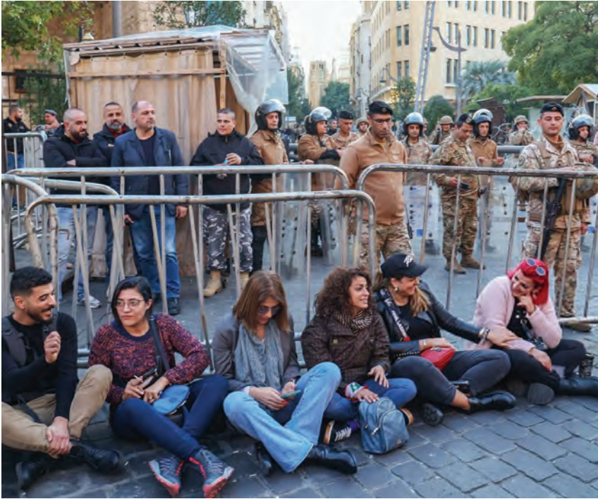
تحرّكات في الشارع دعماً لاعتصام النواب (التفاصيل ص ٢)