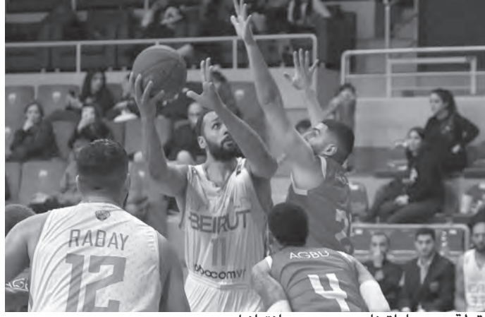
لقطة من مباراة نادي بيروت وأنترايك

على نفسه واسقط منتخبات قوية خلال التصفيات الآسيوية وعلى رأسها منتخب نيوزيلندا (النافذة الخامسة) ومنتخب الفلبينيين (النافذة الرابعة) مع الماكنة الاعلامية للمنتخب خاصة من المؤسسة اللبنانية للارسال انترناشيونال. وكاد منتخب لبنان للرجال أن يحزن لقب كأس آسيا التي اقيمت في اندونيسيا الصيف الفائت فحسر المباراة النهائية امام اوستراياليا بفارق نقطتين ليحتل مركز الوصيف بجداره مع اختيار وائل عرقجي افضل لاعب في البطولة القارية. وخلال البطولة عينها قدم منتخب الأرز الابداء الكبير والرفيع واسقط المنتخبات القوية الواحد تلو الآخر في طريقه الى النهائي.