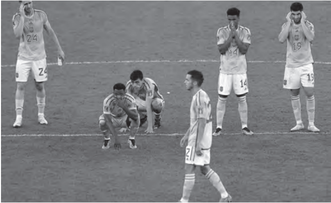
لاعبو اسبانيا وخيبة الخروج

ساراييا في القائم، ثم حافظ «حكيمي» الإسباني المولد على رباطة جأشيه وسجل الضربة الحاسمة، ليضرب المنتخب المغربي موعداً في دور الثمانية مع البرتغال التي اكتسحت سويسرا بنتيجة ٦-١. وأصبح المغرب أيضاً رابع بلد إفريقي فقط يبلغ دور الثمانية في كأس العالم، بعد ١٢ عاماً من تحقيق غانا هذا الإنجاز في جنوب أفريقيا. واستحوذت إسبانيا على الكرة بنسبة زادت على ٧٥٪ وأكملت ما يقرب من ٨٠٠ تمريرة لكن المنتخب المغربي تسبب له في متاعب حقيقية في الهجمات المرتدة، وتصدى الحارس أوناي سيمون لعدة فرص بطريفة جيدة. وبعد انتهاء المباراة التي استمرت ١٢٠ دقيقة دون أهداف وبتسديدات قليلة داخل إطار المرمى من الفريقين، استغل المغرب في ركلات الترجيح أفضلية خوضه المباراة وسط جماهير مغربية غفيرة في الدوحة.