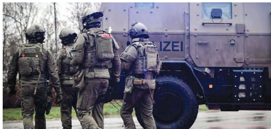
القوات الخاصة الألمانية

واستهدفت عمليات الداهم أعضاء في «حركة مواطني الرايخ» قال الادعاء العام إنهم كانوا يخططون لاقتحام البرلمان والاستيلاء على السلطة، وتنفيذ هجمات مسلحة على مؤسسات تشريعية ألمانية أخرى، وكلمة «الرايخ» في اللغة الألمانية تعني الإمبراطورية أو المملكة.