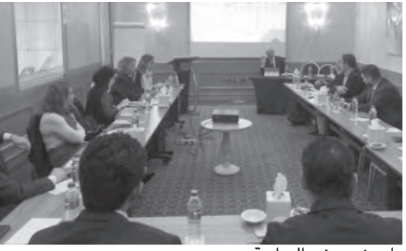
ياسين يعرض الدراسة

تأسس وزير البيئة في حكومة تصريف الاعمال الدكتور ناصر ياسين، قبل ظهر امس، اجتماعاً لعرض الدراسة حول مستحقات قطاع المقالع للزينة تطبيقاً للقوانين والأنظمة المرعية لا سيما القانون ٢٠٠٢/٤٤٤ والمرسوم ٢٠٠٢/٨٨٠٣ وتعديلاته والمرسوم ٢٠٢٠/٦٥٦٩.