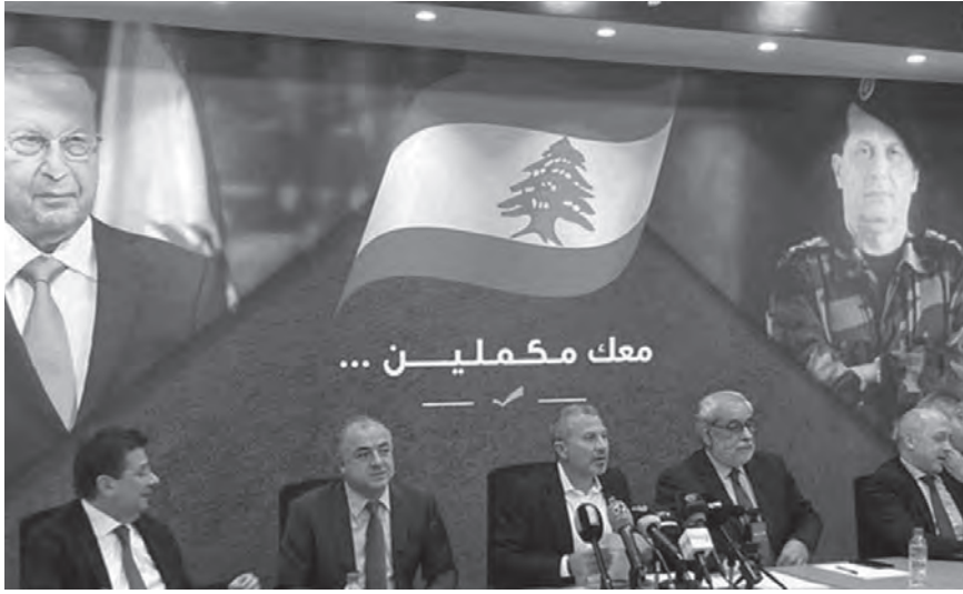
معك مخمليين ...

بغض النظر عما ستؤول إليه علاقة حليفي مار مخايل والمتوقع ان لا تتجه الى السقوط فالواضح ان الطرفين اليوم سيذهبان الى التمايز الإيجابي، فحزب الله سيرحس على الحفاظ على خصوصيته فلا يسير بالتعبئة لباسيل فيما سيكون لرئيس التيار مقاربتة السياسية «المعارضة» فلا يسير خلف خيارات حزب الله الرئاسية والسياسية بعد اليوم.