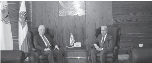
سليم مستقبلاً خير

عقد في البرزة اجتماع تنسيقي بين وزير الدفاع في حكومة تصريف الاعمال موريس سليم والامين العام للهيئة العليا للاغاثة اللواء الركن محمد خير، تم خلاله عرض لوجهات النظر حول سبل التعاون بين وزارة الدفاع الوطني والهيئة العليا للاغاثة، في كل الامور المتعلقة بعمل الوزارة والهيئة.