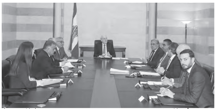
ميكات بيتراس الاجتماع (الداخلي ونهرا)