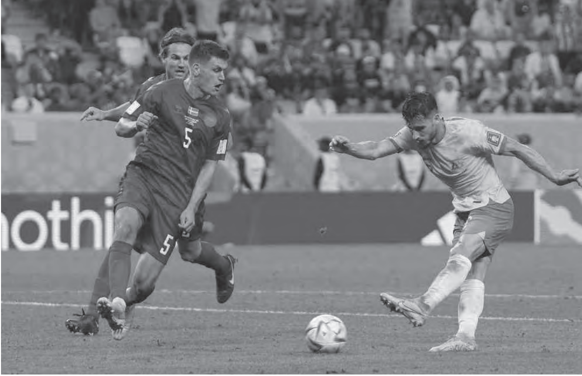
من مباراة استراليا والندمارك

يور ديفينس إن تيرفايد»، بما معناه «فولكروغ في قمة مستواه، دفاع مرتعب»، وذلك على نغم الأغنية الشهيرة من التسعينات للفنانة الإيطالية غالا «فريد فروم ديلاير». قاب قوسين أو أدنى من عامه الثلاثين، المهاجم الذي لعب مباريات في الدرجة الثانية أكثر من الدرجة الأولى مع فريقه فيردير بريمن العائد مجدداً إلى «بوندسليغا»، إذ سجل ٥ أهداف في المراحل الخمس الأولى ووصل الى الهدف العاشر قبل التوقف، في المركز الثاني على لائحة الهدافين خلف الهداف الفرنسي للايزيغ كريستوفر كونكو الغائب عن هذا المونديال بداعي الإصابة.