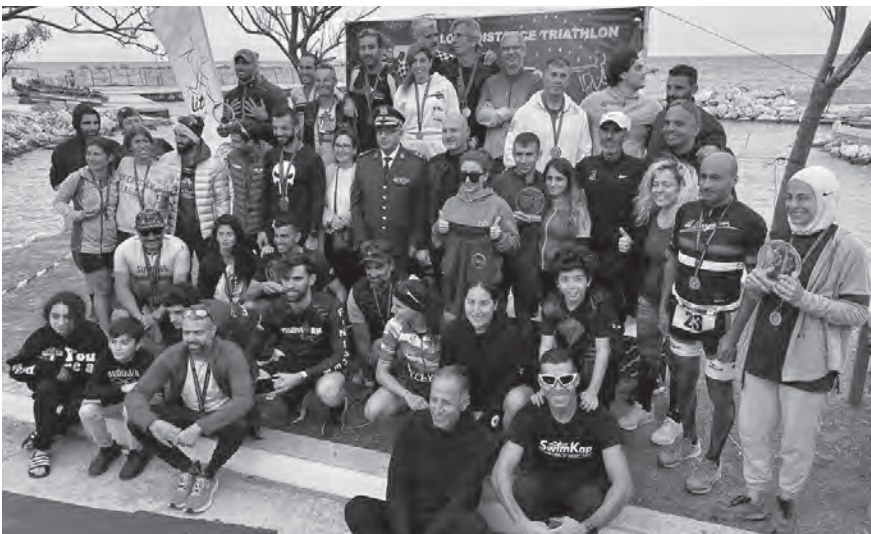
كبار الحضور مع الفائزين والفائزات

نظم نادي الإليبت، برعاية قائد الجيش اللبناني العماد جوزاف عون وتحت إشراف الاتحاد اللبناني للترياتلون، سباق الترياتلون للمسافات الطويلة المعتمدة في سباقات الرجل الحديدي: ١٩٠٠م سباحة، ٩٠ كلم دراجة هوائية، ٢١,١ كلم ركض وللسنة الثانية على التوالي في لبنان. انطلق المتسابقون في مسابقة السباحة داخل مرافق الناقورة التابع للجيش اللبناني وسط اجواء مناخية مستقرة وبحر هادئ وتابعوا مسابقتي الدراجة الهوائية والركض على طول الأوتوستراد البحري لمدينة الناقورة.