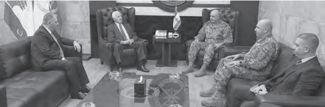
قائد الجيش مستقبلاً الأحمد