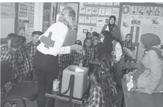
خلال حملة التلقيح

وستستمر الحملة لتشمل ٢٧ بلدة وقرية عكارية، الاكثر تأثراً.