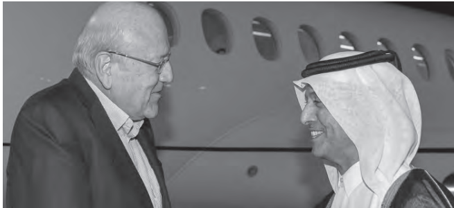
ميقاتي لدى وصوله

وصل رئيس الحكومة نجيب ميقاتي الى الدوحة مساء امس، تلبية لدعوة رسمية لحضور احتفال افتتاح بطولة كأس العالم FIFA قطر (٢٠٢٢). ويضم الوفد اللبناني وزير الشباب والرياضة جورج كلاس ووزير السياحة وليد نصار.