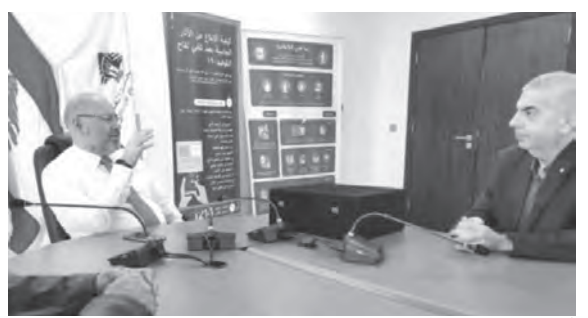
الأبيض مستقبلاً الكسار

التقى رئيس بلدية «بينين-العبدية»، كفاح الكسار، وزير الصحة في حكومة تصريف الأعمال الدكتور فراس الأبيض في مكتبه بالوزارة.