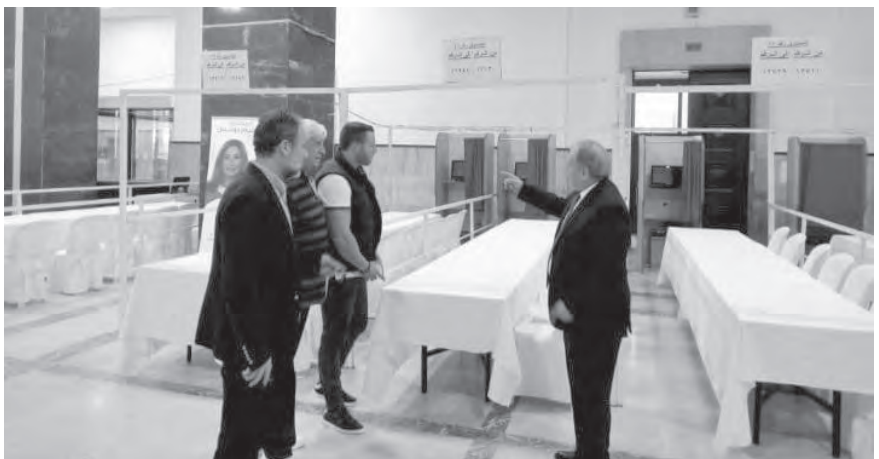
خلال الجولة التفتيدية

التواجد إلى جانب رئيس القلم ومساعدته هذا ودرس كسبار إمكان الاستعانة بمساعد ثان لرئيس القلم من بين المحامين، لمزيد من الشفافية والسرعة في الانتخاب. وكرر النقيب على المرشحين عدم لصق الصور على حيطان الضمان وصنود العلن لصعوبة إزالتها لاحقاً بعد استعمال مواد لاصقة. كما أشرف على وضع كراسي كتب عليها للمقترح فقط في أقلام المحامين الأقدم عهداً، والذين بلغوا سنا متقدمة.