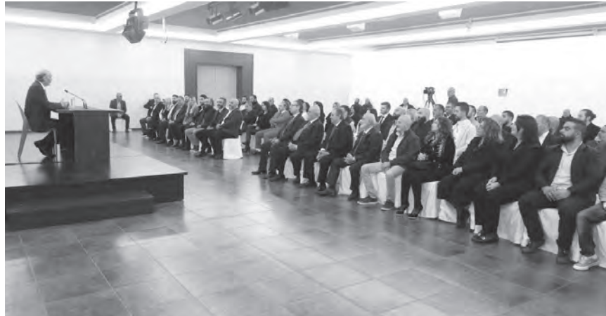
ججججج يلقي كلمته

أكد رئيس حزب القوات اللبنانية سمير ججججج، «أن وقوع الفراغ الرئاسي أساساً وسبب استمراره اليوم مرده إلى سببين: الأول أن هناك من يدرس خطواته في مسألة انتخابات رئاسة الجمهورية من منطلقها لا علاقة لها بلبنان، ولا يعبر بذلك أي أهمية لمصلحة الشعب اللبناني أو المصلحة الوطنية العليا وإنما جل ما يهيمه هو مصالحه الخاصة ومصالح المشروع الإقليمي الذي يرتبط به ارتباطاً عضوياً، ويتسرّج خلف شعار التوافق من أجل تبرير فعلته هذه. أما السبب الثاني فهو حالة الانتظار لتطورات يعتمدها البعض الآخر ولا نعرف ماهيتها».