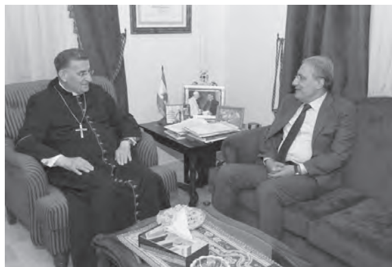
خوري يزور الراعي

الحقيقية، ولكن التطورات هي ملك القاضي المشرف على الملف فلا أحد يملك المعطيات وأنا لا أسمح لنفسي أن أسأل أو أطلع على الملف، وقد توقف العمل في الملف لأن لكل شخص استراتيجيته وطريقته بطريقته القانونية بغض النظر عن أحقية ما يقوم به، فهذا أمر نتركه للمحكمة.