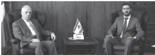
سليم مستقبلاً رستم

زار النائب احمد رستم وزير الدفاع في حكومة تصريف الأعمال مورييس سليم، وبحث معه في شؤون سياسية. وعرض رستم مع وزير الدفاع لمعانة العسكريين بعامة والعكارين بخاصة، من نواح عدة أهمها التكاليف الباهظة للمواصلات، مشدداً على «ضرورة تحسين ظروف العسكريين والمعاقدين»، وقال: «أوضح معاليه أنه استحدث منذ مطلع العام بدل نقل للعسكريين هو مليون ومئتا ألف ليرة شهرياً». وشدد رستم «على ثقة الناس بالمؤسسة العسكرية والقضاء»، اذ ان «المؤسسة العسكرية والسلك القضائي ركنان أساسيان من أركان الدولة وثباتها».