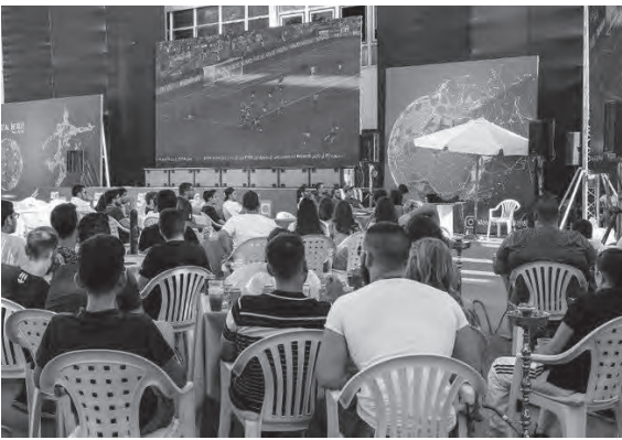
أعلاه بشكل واضح على مداخلها، حفاظاً على الشفافية بين المؤسسات السياحية وروادها.

ختاماً، في ظل التقلب المخيف والسريع الذي يشهده سوق العملات الرقمية، لا يمكن التنبؤ بمستقبل هذه العملات، ولكن ما يمكن استنتاجه هو أنه في حال وضعت الأطر التنظيمية المناسبة في أسرع وقت وسيصبح قطاع العملات الرقمية أكثر استقراراً ويستعيد ثقة مستثمريه وربما يستقطب مستثمرين جديداً حيث يشعرون بالأمان في بيئة تقنية منظمة، ويحفظون حقوقهم.