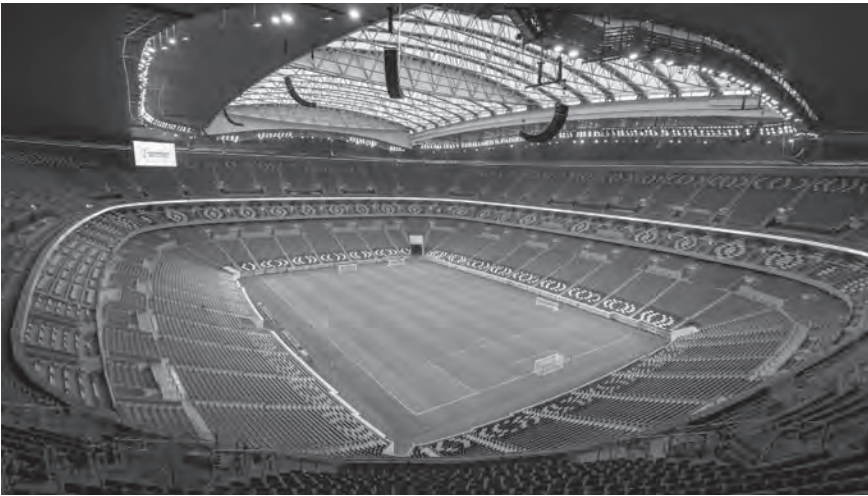
الملعب الذي سيستضيف المباراة الافتتاحية اليوم

الخميس ١ كانون الأول: كندا - المغرب ٥ مساء ملعب الثمامة. كرواتيا - بلجيكا ٥ مساء ملعب أحمد بن علي. اليابان - إسبانيا ٥ مساء ملعب خليفة الدولي. كوستاريكا - لثانيا ٩ مساء ملعب البيت. الجمعة ٢ كانون الأول: غانا - الأوروغواي ٥ مساء ملعب الجنوب. كوريا الجنوبية - البرتغال ٥ مساء ملعب المدينة التعليمية. الكامبيرون - البرازيل ٩ مساء ملعب لوسيل. صربيا - سويسرا ٩ مساء ملعب ٩٧٤.