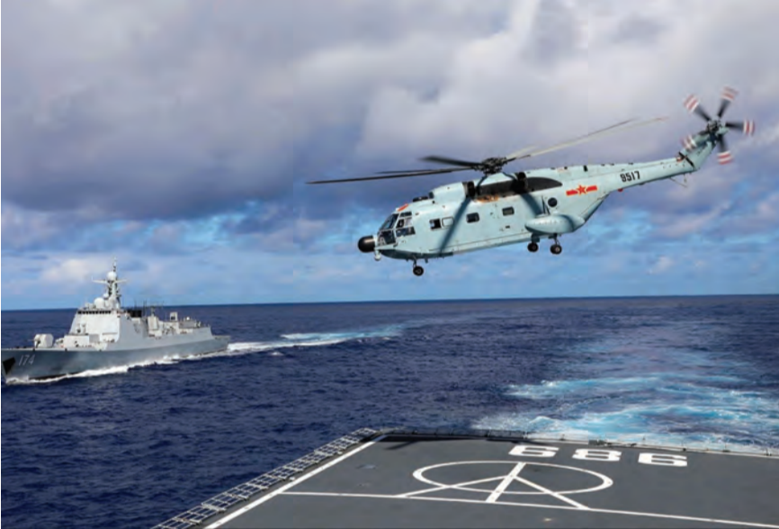
انتهاء المناورات الصينية

أعلنت الصين، أمس الأربعاء، انتهاء تدريباتها العسكرية قرب تايوان، التي انطلقت الأسبوع الماضي احتجاجاً على زيارة رئيسة مجلس النواب الأميركي نانسي بيلوسي تايبيه. ومددت الصين أكبر مناورتها على الإطلاق حول الجزيرة إلى ما بعد الأيام الـ ٤ التي كانت مقررة في الأصل.