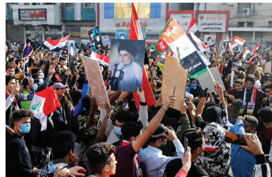
تظاهرات لانصار الصدر

دعا رئيس الوزراء العراقي مصطفى الكاظمي الكتل السياسية الى حل الانسداد السياسي في البلاد، وللجوء الى الحوار لحل الخلافات. وقال الكاظمي، خلال احتفالية وضع الحجر الأساس لمشروع إعادة تأهيل مطار الموصل الدولي، أمس الأربعاء، إن «المطلوب اليوم من الكتل السياسية أن تتحمل مسؤولياتها بحل موضوع الانسداد السياسي، من أجل مصلحة العراق ومستقبله».