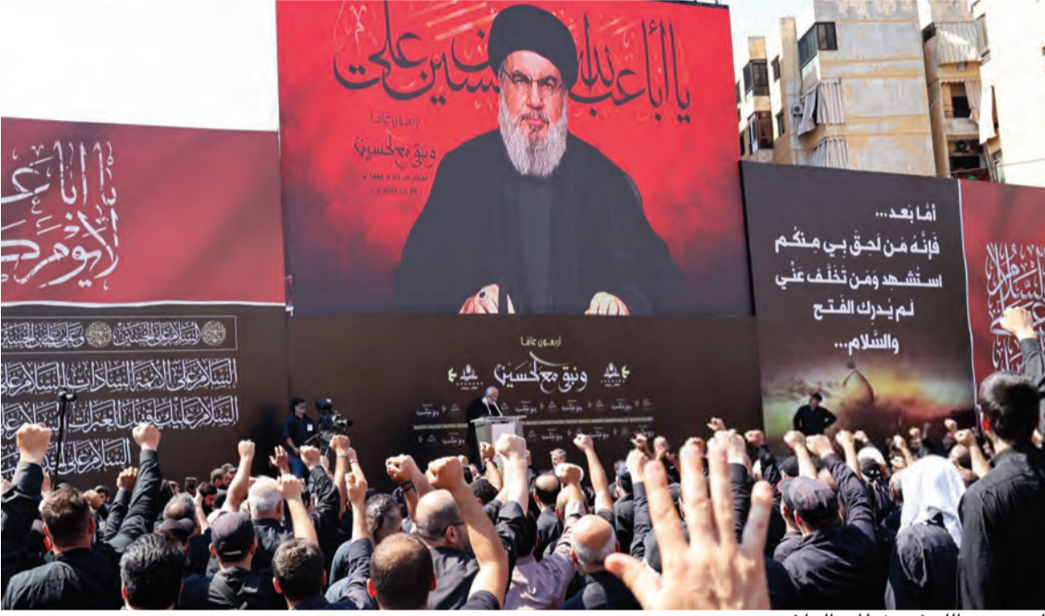
السيد نصرالله في خطاب العاشر

المرحلة بأقل قدر من الخسائر، بل على العكس، فإن لبنان لم يشهد في تاريخه مثل هذا السوء حتى في أوج مراحل الحرب الأهلية، نتيجة ابتلاء اللبنانيين بأبشع طبقة سياسية أوصلتهم الى الحضيض وشرعت بلدهم على كل الانقسامات الطائفية والمذهبية «وزلته» اقتصاديا وماليا وأوصلته الى مرحلة الانهيار الحتمي والزوال، وباتت الخلافات السخيفة بين المسؤولين «خبز الناس» بديلا عن خبز الأفران، والانكى انه يتم تغليب الخلافات بمصالح الناس ومعيشتهم، وهل مصالح اللبنانيين بطوابير الذل امام الأفران والمحطات ودموع الإباء والإمهات على ابواب المستشفيات جراء العجز عن تأمين فاتورة الاستشفاء مضافا الى ذلك غياب وزارة الصحة وموت الضمان وشلل تعاونية الموظفين بعد نهب اموالها؟