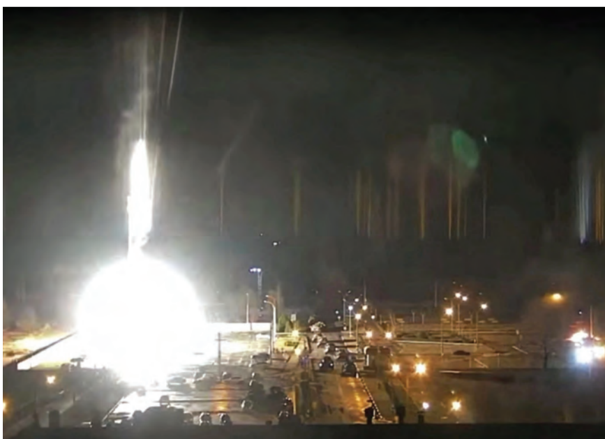
لحظة الاعتداء على محطة زباروجيا النووية

وقالت شركة «إينرغواتوم» الأوكرانية أمس الأول إن القوات الروسية تستعد لربط محطة زباروجيا النووية (جنوب شرق أوكرانيا) بشبه جزيرة القرم التي ضمتها موسكو عام ٢٠١٤، محذرة من أن إعادة توجيه إنتاج