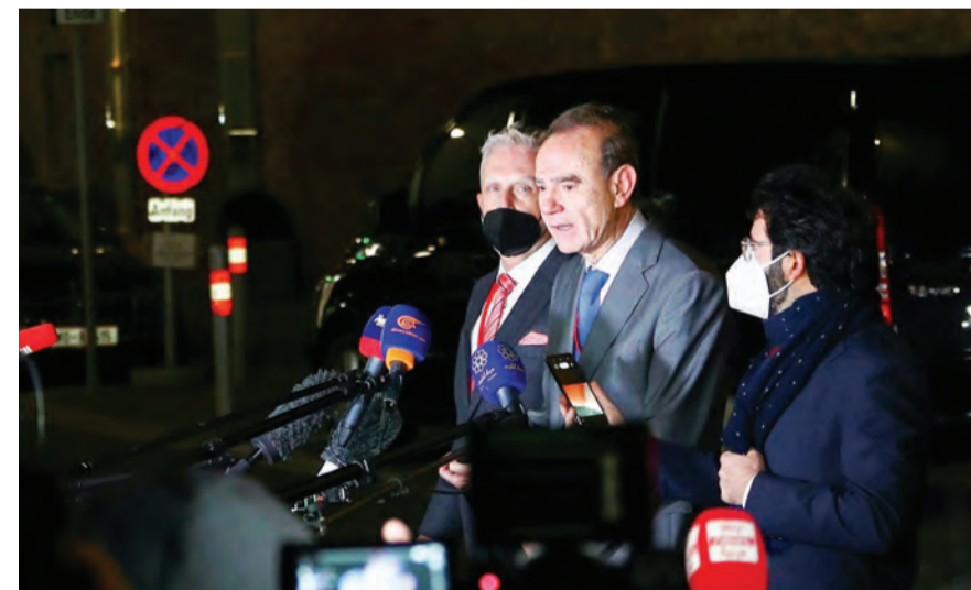
المنسق الأوروبي للمفاوضات في طريق العودة الى فيينا

أعلنت وزارة الخارجية الإيرانية أمس الأربعاء أن وفدا برئاسة كبير المفاوضين علي باقري سيتوجه إلى فيينا خلال الساعات المقبلة، من أجل استكمال المحادثات بشأن إحياء الاتفاق النووي الملغاة منذ أشهر.