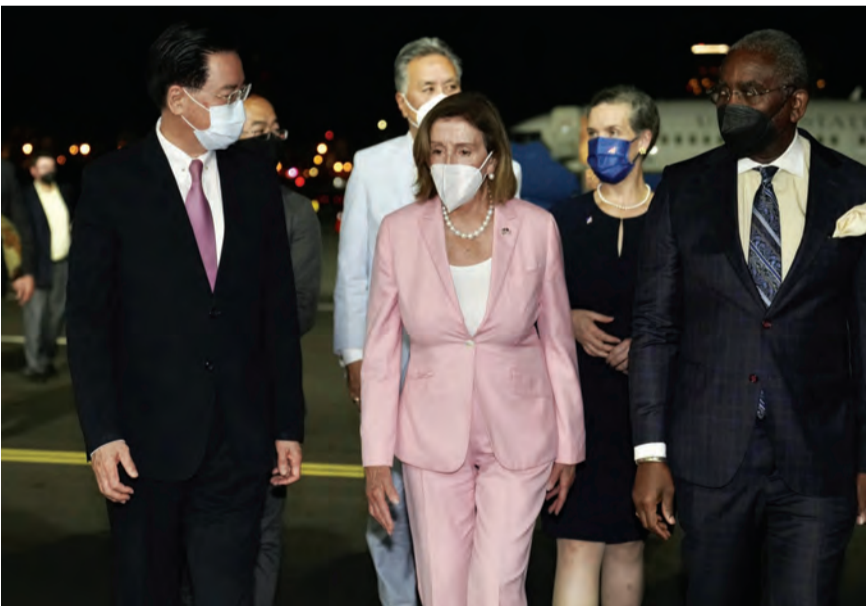
بيلوسي في تايوان

بعد انتهاء زيارة بيلوسي لتايوان.. الصين توجّه رسالة لواشنطن