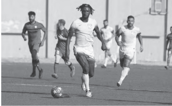
من مباراة الشباب الغازية والسلام زغرتا