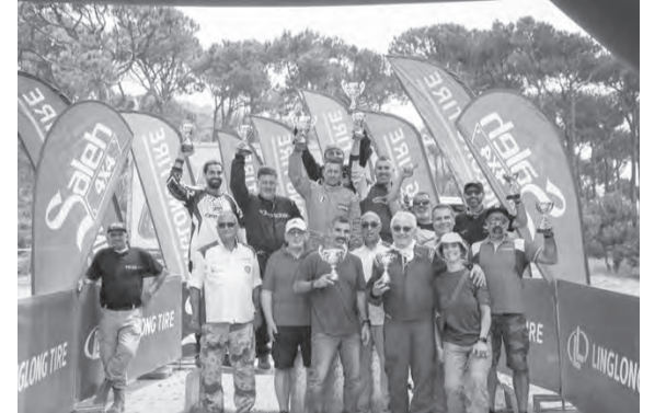
كبار الحضور مع الفائزين في مختلف الفئات