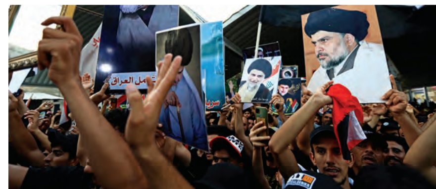
انصار الصدر في محيط البرلمان

الصدر يرفض الدعوات للحوار: جاهز للشهادة والإطار التسيقي يتهم الحكومة بالتقصير