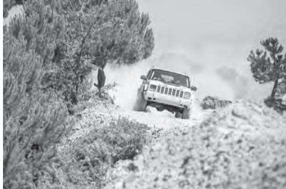
جورج زيادة بطل مركبات الدفع الرباعي