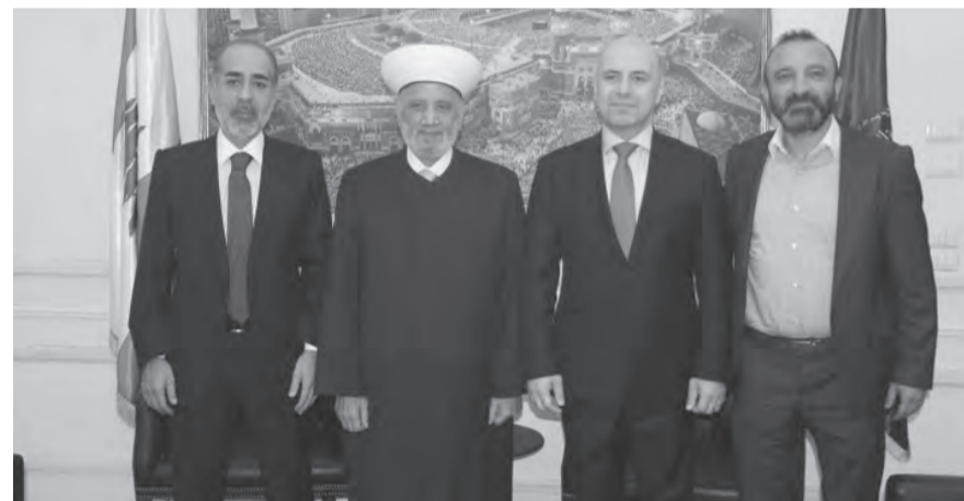
دريان مع الوفد

استقبل مفتي الجمهورية الشيخ عبد الطيف دريان في دار الفتوى، قبل ظهر امس، وفداً قديماً من حزب «القوات اللبنانية»، وتكلم «الجمهورية القوية» ضم نائب رئيس مجلس الوزراء السابق النائب غسان حاصباني والنائب جهاد بقرادوني ومنسق منطقة بيروت في «القوات» الدكتور سعيد حديفة.