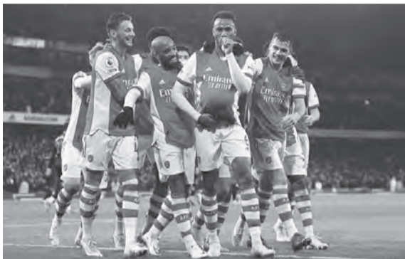
أرسنال الأكثر إنفاقاً في الدوري الإنكليزي الممتاز

● توتنهام بمقارنة صفقات توتنهام هوتسبير مع تشيلسي، سنجد أن الأخير أبرم صفقتين والأول أبرم ٦ صفقات، لكن ما أنفقه السبيرز كان مقارباً للغاية مما أنفقه البلوز، حيث ضم توتنهام إيفان بريستش من إنتر ميلان وفريرز فورستر من ساوثمبتون بشكل مجاني واستعار كليمنت لينغليه من برشلونة. أما ما أنفقه على الصفقات فكان ٨٧,٥ مليون إسترليني، أكبر به ٥ مليون من صفقات تشيلسي، وذلك بضم ريتشارلسون من إيفرتون ٥- مليون إسترليني، وإيف بيسوما من برايتون به ٢٥ مليوناً، وجيد سبنس من ميدلسبره مقابل ١٢,٥ مليون. ● تشيلسي رغم أن تشيلسي لم يبرم إلا صفقتين فقط في صيف ٢٠٢٢، لكنه أنفق ٨٢ مليون جنيه إسترليني، ٥٠ مليون منها على ضم رجب سترلينغ من مانشستر سيتي، والـ ٣٢ مليون الأخرى على التعاقد مع كالدو كوليبالي من نابولي الإيطالي. ● مانشستر يونايتد تعاقدت إدارة نادي مانشستر يونايتد مع ٣ لاعبين كلفوا النادي بمبلغ ٦٩,٥ مليون جنيه إسترليني، مقسمة لـ ٥٦,٥ مليون لصفقة ليساندرو مارتينيز من أياكس أمستردام الهولندي، و ١٢ مليوناً لصفقة تايرل مالاسيا من فينورد روتردام، مع ضم كريستيان إريكسن بشكل مجاني في صفقة انتقال حر.