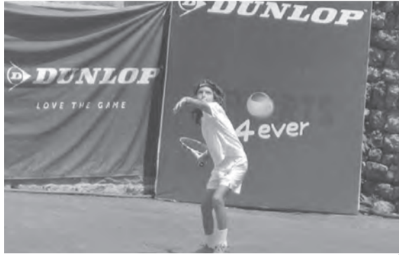
أحد اللاعبين خلال إحدى المباريات