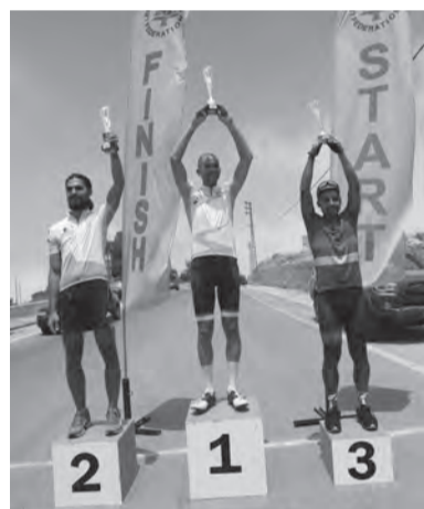
تتويج أبطال فئة النخبة