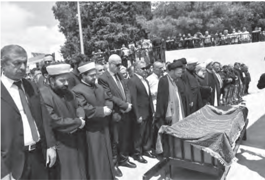
الصلاة على الجثمان