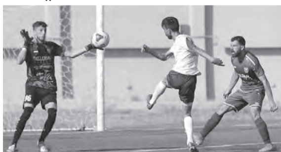
من مباراة العهد وشباب الساحل