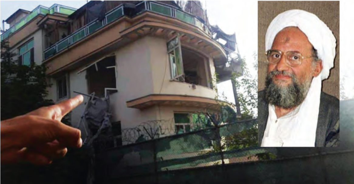
المنازل الذي قتل فيه الظواهري

لمقتل الظواهري، وأظهرت الصور تصاعد الدخان من المنزل الذي كان يختبئ فيه زعيم تنظيم القاعدة. واستهدفت الغارة منزلاً في الحي الدبلوماسي قرب السفارة الأميركية في العاصمة الأفغانية كابل. وقال البيت الأبيض إن الرئيس بايدن أصدر قرار استهداف الظواهري في ٢٥ من الشهر الماضي. وأكد البيت الأبيض أن بعض كبار قادة شبكة (وزير الداخلية الأفغاني سراج الدين) حقاني كانوا على علم بمكان الظواهري، مشيراً إلى احتمال