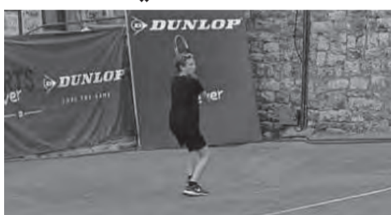
احد اللاعبين خلال احد اللقاءات