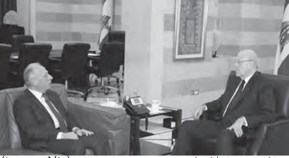
ميقاتي مستقبلا سليم

ترأس رئيس حكومة تصريف الاعمال الرئيس المكلف نجيب ميقاتي، اجتماع «اللجنة الوزارية المكلفة معالجة تداعيات الأزمة المالية»، قبل ظهر امس في السرايا الحكومية، وقد تقرر خلال الاجتماع الطلب من المؤسسات العامة التي تسمح موازنتها بدفع زيادة الإنتاج وفقا للألية والشروط التي نص عليها المرسوم رقم ٩٧٥٤ تاريخ ٢٨-٧-٢٠٢٢ اتخاذ الاجراءات الآلية الى ذلك بحسب الأصول.