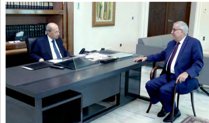
عون مستقبلاً بو حبيب (دا الاتي ونهرا)

استقبل رئيس الجمهورية العماد ميشال عون في قصر بعيدا أمس، وزير الخارجية والمغتربين الدكتور عبدالله بو حبيب، وجرى معه جولة أفق في التطورات المحلية والإقليمية والدولية، كما تم تقييم المحادثات التي اجراها الوسيط الأميركي في المفاوضات غير المباشرة لترسيم الحدود البحرية الجنوبية اموس هوكشتاين، والمعطيات التي توافرت حول الاتصالات التي يقوم بها الوسيط الأميركي لتحريك ملف المفاوضات غير المباشرة والتي يفترض ان تستكمل بترسيم الحدود.