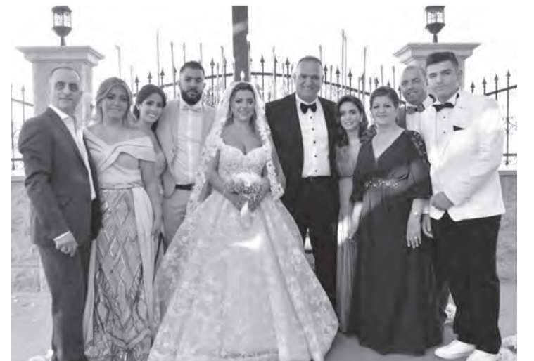
مع عائلة العروس