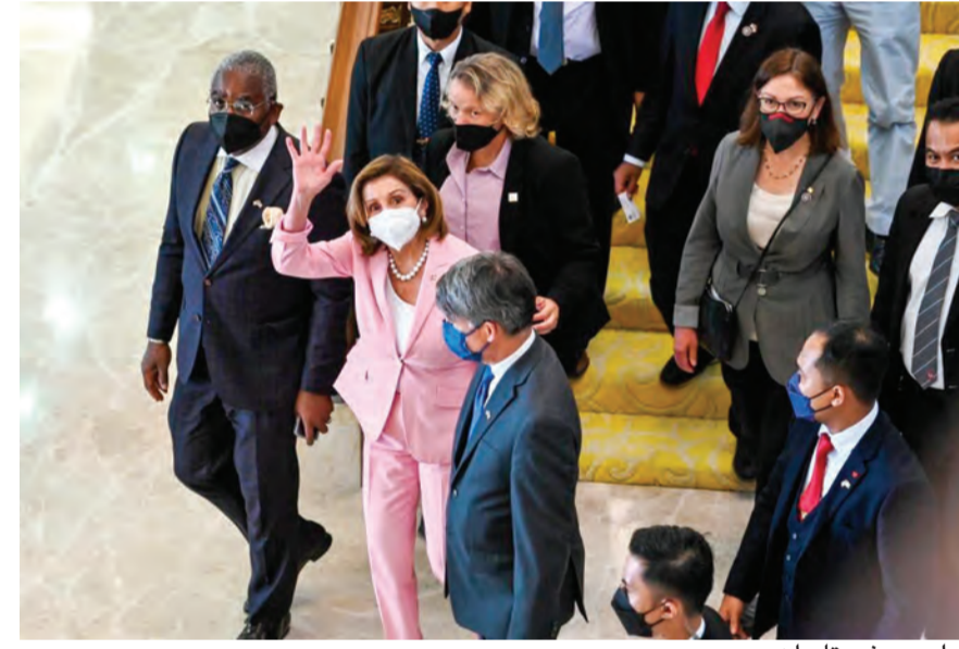
بيلوسي في تايوان

وصلت رئيسة مجلس النواب الأميركي نانسي بيلوسي مساء أمس الثلاثاء إلى تايوان، في حين أعلنت وزارة الدفاع الصينية أنها ستبدأ عمليات عسكرية محددة، رداً على هذه الزيارة. وأظهرت صور مباشرة بيلوسي (٨٢ عاماً) المسافرة على متن طائرة عسكرية أميركية وهي تصل إلى مطار سونغشان في تايبيه، وكان في استقبالها وزير الخارجية التايواني جوزيف وو. وأصدرت بيلوسي وأعضاء وفد الكونغرس بيانا جاء فيه «زيارتنا إلى تايوان تكرر التزام واشنطن الثابت بدعم الديمقراطية فيها».