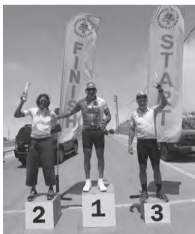
تتويج أبطال فئة النخبة