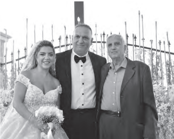
العروسين مع الرئيس الأسبق للحزب القومي الأمين فارس سعد

رئيس الحزب السابق للحزب السوري القومي الاجتماعي الأمين فارس سعد. واتصل مهنئاً الرئيس اميل لحود، الوزير السابق وليد جنبلاط، الامير طلال ارسلان، الوزير السابق وثام وهاب، وعدد من الشخصيات السياسية، الحزبية والاجتماعية.