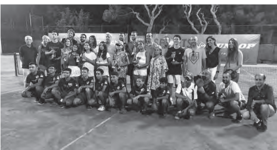
لقطة جامعة للاعبين واللاعبات بعد التتويج محاطين بالشخصيات الرسمية والأهالي