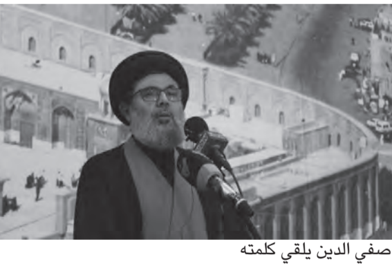
صفي الدين يلقي كلمته

سنوات وكل الناس تشهد على ذلك... أضاف «دعونا الى التلاقي من أجل النقاش ومن أجل التفتيش عن حلول واقعية والوصول الى حلول تفيد الناس، ولكن لا جواب، دائما كان هناك التعويل على الخارج وعلى الوعود الخارجية وعلى الأموال التي تأتي من هنا وهناك لهم تتعبون أنفسكم هؤلاء لن يعطوا لبنان شيئا، ولن يخدموا شعب لبنان بشيء»، لافتا الى أنه «عام كامل انتهى، والوعود الأميركية بالغاز المصري وبالكهرباء الأردنية ما زالت وعوداً، هؤلاء لا يستحون». ورأى أن «اللطيف أن كل يوم نسمع شروطاً جديدة، فيما عليهم أن يفهموا أن أميركا تريد شيئا وأن أميركا لا يمكن أن تفرج عن أمر أو تفتح باباً إلا وتريد أن تأخذ ثمنه لإسرائيل قبل أي شيء، ولكن الذي نعرفه هو أننا طالما نحن موجودون في هذا البلد، نملك هذه الإرادة ونملك هذه المعرفة، ونملك هذه التجربة، فإن إسرائيل لن تحصل على أي شيء من لبنان بعد اليوم، بعد كل الهزائم التي منيت بها، وبعد كل تلك القدرة التي امتلكتها ونمتلكها وسنمتلك ما هو أعظم في القادم من الأيام».