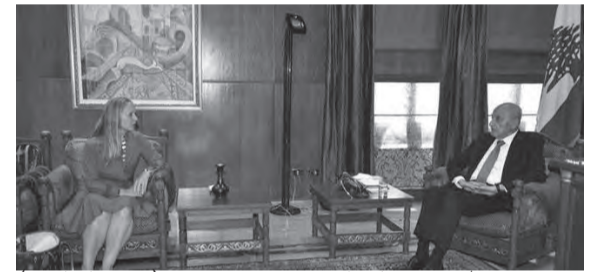
بري مستقبلا سفيرتا كندا

استقبل رئيس مجلس النواب نبيه بري في مقر الرئاسة الثانية في عين التينة، رئيس المجلس سفيرتا كندا شانتال شاستيني في زيارة وداعية بمناسبة انتهاء مهامها الدبلوماسية كسفيرة لبلادها لدى لبنان. وكانت الزيارة مناسبة جرى خلالها عرض للأوضاع العامة والعلاقات الثنائية بين البلدين.