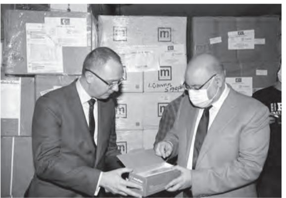
الأبيض والسفير التركي

تذهب إلى مراكز الرعاية الأولية والتي تدعم المرضى الذين يقصدون هذه المراكز وخصوصاً المرضى الذين ليس في استطاعتهم ان يحصلوا على علاجاتهم من الصيدليات بحيث أصبحت غالية الثمن. وهذه الهبة من الادوية التركية ستوزع مجاناً في مراكز الرعاية الأولية التابعة لوزارة الصحة».