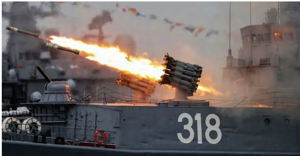
معارك بحرية روسية - اوكرانية

الاحتفالية بيوم البحرية تم إلغاؤها في شبه جزيرة القرم (التي ضمته روسيا عام ٢٠١٤) - بما في ذلك في سيفاستوبول- لدواع أمنية، مشيراً إلى أن جهاز أمن الدولة يحقق في الحادث». وفي موسكو، دعا فلاديمير جباروف النائب الأول