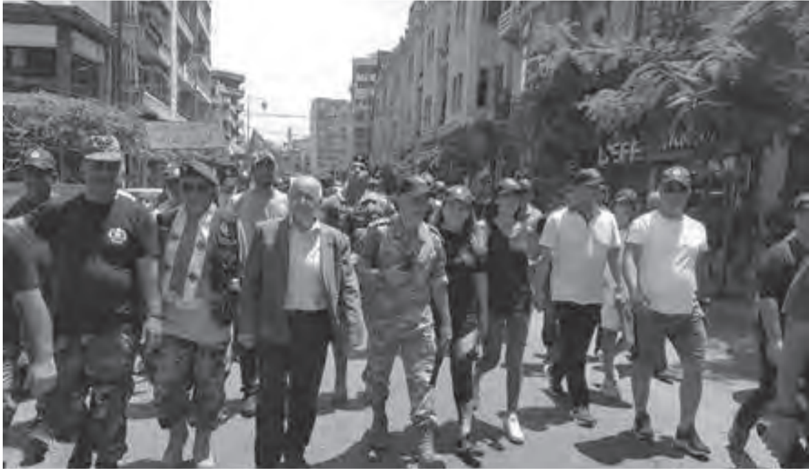
طرابلس مسيرة في

دعماً للجيش بمناسبة عيده، من تنظيم شادي سرفجلاني، وبمشاركة بلدية طرابلس، كشافة الغد وجمعية March ونادي Scorpion for martial Art ونادي Blue Eagle و٢ لجنة المحاربين القدامى في طرابلس وضواحيها والصليب الأحمر والدفاع المدني وجمعيات اهلية. تقدم الحضور قائد لواء المشاة الثاني عشر العميد الركن فادي بو حيدر، رئيس فرع الشمال في مخابرات الجيش العقيد الركن نزيه بقاعي، رئيس بلدية طرابلس الدكتور رياض يمي وفاعليات.