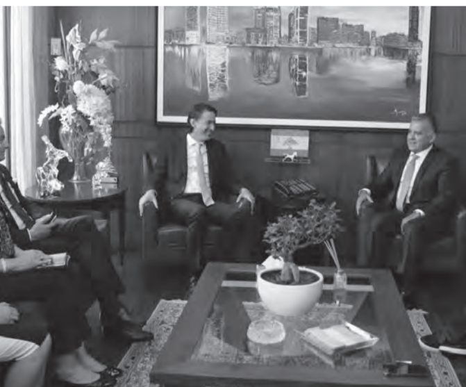
ابراهيم مستقبلاً هوكشتاين والوفد المرافق

وزار الوفد الاميكي قائد الجيش العماد جوزاف عون في مكتبه في البرزة، وتناول البحث موضوع ترسيم الحدود البحرية، وأطلع هوكشتاين العماد عون على آخر تطورات الملف. من جهة أخرى، جدد قائد الجيش تأكيده «التزام المؤسسة العسكرية بأي قرار تتخذه السلطة السياسية في هذا الشأن»، أملاً لأن «تصل المفاوضات الى النتائج المرجوة لما في ذلك من مصلحة للبنان».