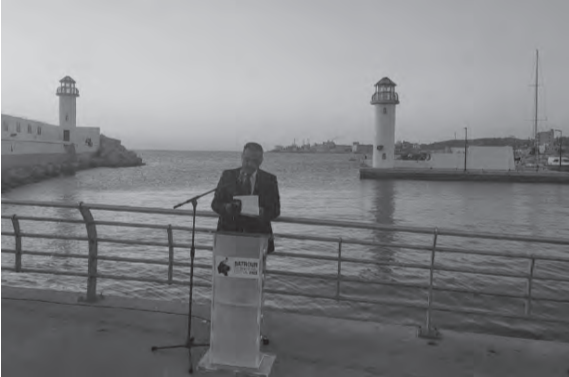
المرئضى يلقي كلمته

يوسفوا صدورهم وأفكارهم، لفهم هذا الآخر واحترامه واحتضانه ومحبته، وأن يجعلوا حرية التعبير، بالكلمة أو بالصورة أو بغيرهما، وسيلة لبناء التضامن الوطني، وأن يتفقوا بقدراتهم الذاتية ويستفيدوا في الوقت نفسه من المعطيات المعرفية الحديثة... هكذا، بهذه الثقافة الوطنية والحضارية الجامعة يتقدّون الوطن».