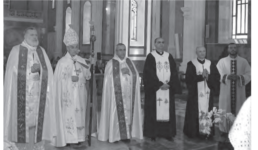
الراعي يترأس القداس

ترأس البطريرك الماروني الكاردينال مار بشارة بطرس الراعي قداس الأحد في الصرح البطريركي الصيفي في الديمان، وألقى عظة الأحد قال فيها: «يحتفل الجيش اللبناني بعيد تأسيسه السابع والسبعين فإنا نصلي من أمله: لكي يحميه الله من المخاطر، وينميّه، ويشدد رابطة وحدته، ويحفظ بسلام أعضائه. وإننا نعرب عن تهانينا وتمنياتنا للمهاد قائده وربائته وضباطه وجنوده».