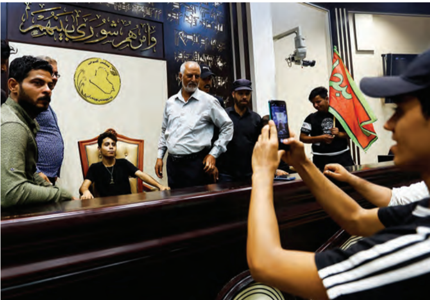
«أنصار الصدر» يلتقطون الصور على كرسي رئيس البرلمان