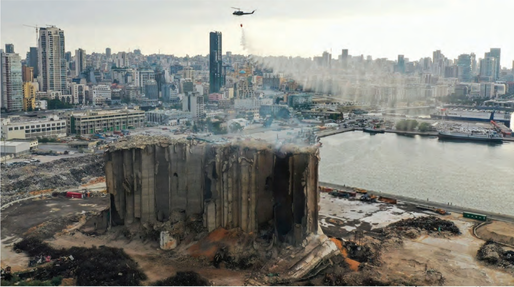
انهيار جزئي لاهراءات القمح في مرفأ بيروت

وصل الوسيط الأميركي بشأن ترسيم الحدود البحرية الجنوبية عاموس هوكشتاين إلى بيروت أمس البارحة في زيارة تستمر يومين للقاء المسؤولين اللبنانيين حول ملف ترسيم الحدود البحرية الجنوبية مع العدو الإسرائيلي. وكانت السفارة الأميركية في إستقباله في المطار وتوجه من بعدها مباشرة إلى مقر الأمن العام للقاء اللواء عباس إبراهيم، ومن ثم توجه إلى وزارة الطاقة حيث إلتقى الوزير وليد فياض.