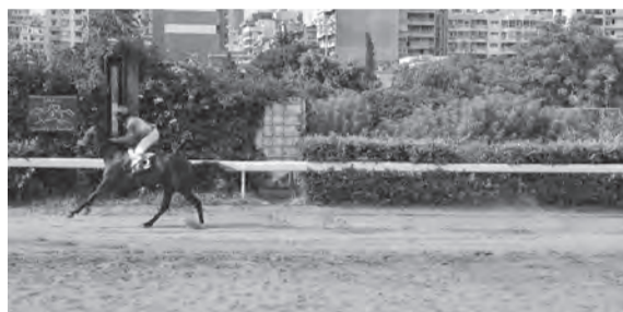
هكذا فازت ووصلت الفرس «ميس» بعشرة اطوال والبقية لاحقينا