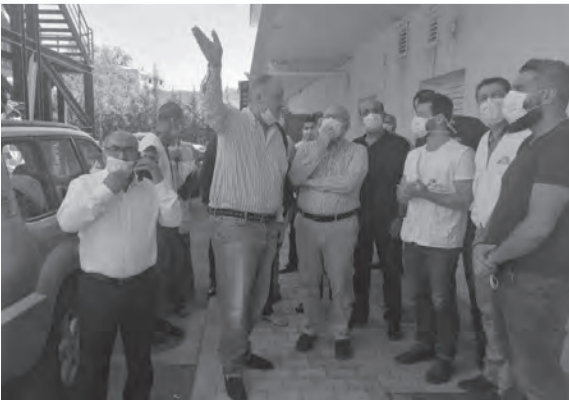
خلال الجولة التقفدية

دارت على مدى اليومين الأخيرين خلال الجلسة التشريعية العامة، قد عكس مناخاً جديداً تحت قبة البرلمان، يأخذ في الاعتبار نتائج الانتخابات النيابية الأخيرة وواقع التحول الذي طرأ على طبيعة تكوينه، وقد تجلّى هذا الواقع، من خلال النقاش الحيوي، والمشاركة الفاعلة، على الرغم من بعض محاولات قطع الطريق على نواب التغيير في لحظات معينة خلال الجلسة التشريعية العامة، علماً أنّ كلّ الاعتراضات التي عبّر عنها النواب محقّة وأتت في مكانها الصحيح. وبالتالي، فإن ما حصل من مواجهات وسجالات، قد وضعه النائب التغييري نفسه، في سياق التخفيف من تأثير القوى التغييرية على الرأي العام اللبناني، ويعتبر النائب في كتل «التغيير»، أنّ المرحلة حافلة بالتحديات، وتستلزم من كل القوى السياسية ومن الكتل النيابية، التعاون نظراً لأهمية وضرة التشريع، وخصوصاً بالنسبة للقوانين الأساسية المتعلقة بالشروط التي وضعها صندوق النقد، من أجل دعم لبنان في مرحلة التعافي، وأبرزها القوانين الأربعة والتي أقرّ منها إلى اليوم قانون السرية المصرفية، وقيت قوانين الكابيتال كونترول وإعادة