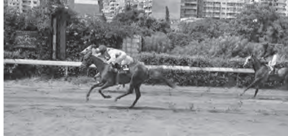
هكذا استطاعت الفرس اسمهان بقيادة الخيال نديم التفوق بقوة بعد صراع عنيف مع مطارديها