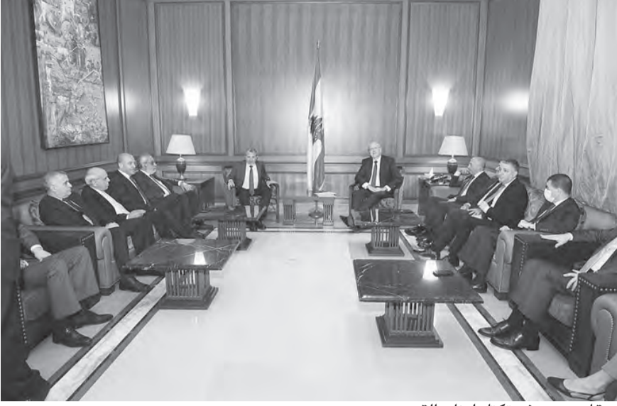
مِيقَاتِي مَعَ وَفْدِ كَتَلِ لِبْنَانِ الْقَوِي

وفقاً للاسواء النيابية، فان رئيس الحكومة المكلف يضع نصب عينيه الاسراع في تقديم التشكيلة الحكومية لرئيس الجمهورية، ليس من باب رمسي الكرة في مرمى بعيدا، وانما لقناعته بأن الفترة القصيرة التي تفصلنا عن الاستحقاق الرئاسي قبل نهاية تشرين الأول المقبل، تفرض تشكيل الحكومة الجديدة في غضون ايام وليس اسابيع.