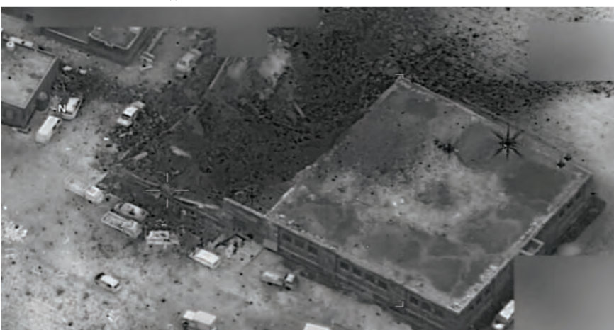
صورة جوية تظهر مكان تنفيذ الغارة

أن «مقتل هذا القائد سيعطّل قدرة القاعدة على تنفيذ هجمات ضد الأبرياء حول العالم». وحسب البيان الأميركي الذي نقلته وكالة رويترز فإن «مراجعة أولية لم تشر إلى وقوع إصابات في صفوف المدنيين». كما نقلت رويترز عن الدفاع المدني السوري، أن رجلاً قُتل قبل منتصف الليل بقليل بعد استهداف دراجته النارية بصاروخين، مضيفاً أنه نقل الجثة إلى إدارة الطب الشرعي في مدينة إلب.