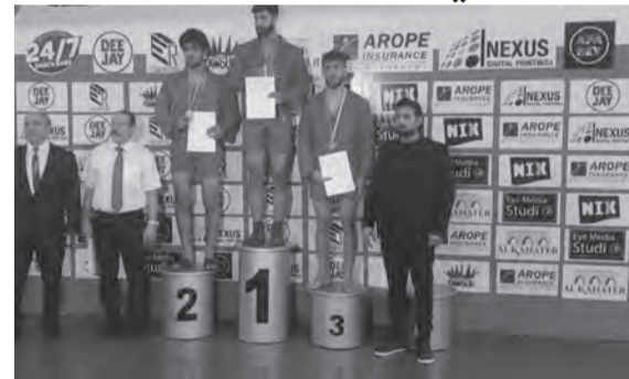
أبطال على منصة التتويج