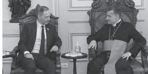
الراعي مع كولارد

استقبل البطريرك الماروني الكاردينال مار بشارة بطرس الراعي ظهر امس في الصرح البطريريكي في بكركي، سفير بريطانيا ايان كولارد في زيارة وداعية لمناسبة انتهاء مهامه الدبلوماسية في لبنان، وكانت مناسبة لعرض الاوضاع الراهنة.