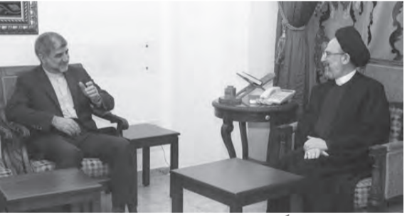
فضل الله مجتمعاً مع فيروزنيا

الامكانات المتاحة، مشيراً إلى تأثير المناخ العام في المنطقة والعالم على الملف اللبناني، كما أكد على سعي الجمهورية الإسلامية في إيران لتعزيز العلاقات مع الدول العربية والإسلامية مشيراً إلى أهمية تمتين العلاقات بين هذه الدول ومؤكداً بأن إيران ترى في ذلك أولوية سياسية على قاعدة التطلع إلى وحدة الأمة بكل مكوناتها.