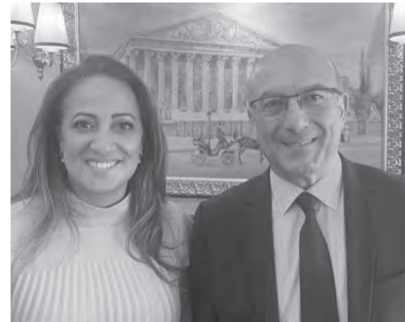
بخاش مع لأكرافي

وأوضح في بيان، أنه «تم خلال هذا اللقاء تسليط الضوء على الوضع الصحي وكل التحديات التي يواجهها الجسم الطبي في لبنان مع هجرة أكثر من ٣٠٠٠ طبيب وطبيبة والتحديات المختلفة التي يتعرض لها.