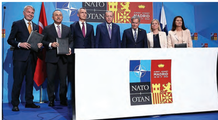
خلال توقيع المذكرة

قال الرئيس الفنلندي، سولي نينيسكو، أمس الثلاثاء، إن تركيا وافقت على دعم طلب العضوية المشترك الذي قدمته بلاده والسويد لحلف شمال الأطلسي.