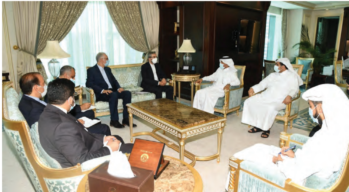
الوفد الإيراني خلال إحدى اجتماعاته في الدوحة

أعربت الخارجية القطرية أمس الثلاثاء عن استعداد الدوحة لتوفير الأجواء التي تساعد على إنجاح المحادثات الأميركية الإيرانية غير المباشرة بشأن الملف النووي الإيراني الذي تبرز فيه عدة نقاط خلافية.