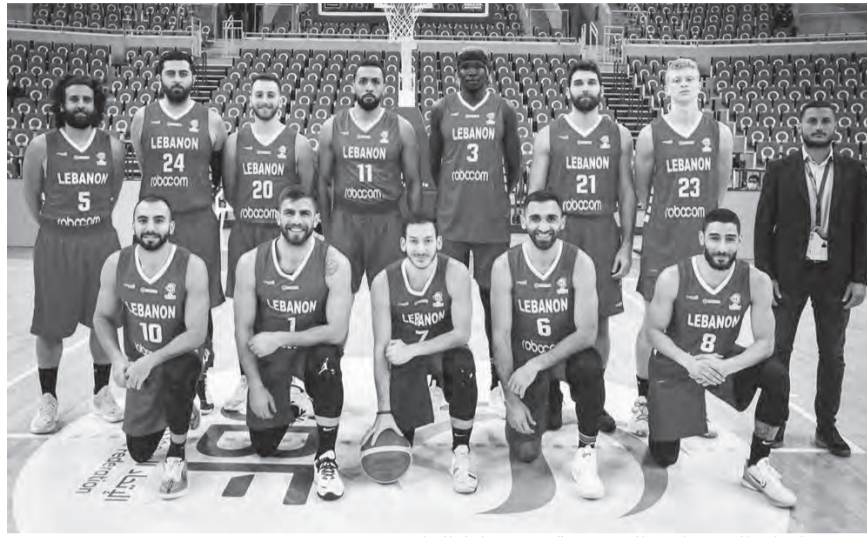
منتخب لبنان الذي واجه السعودية في شباط الفائت