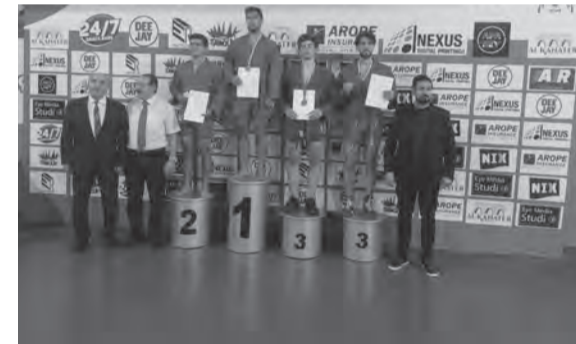
تتويج إحدى الفئات

وفي نهاية المباريات الفائزون والفائزات الميداليات والشهادات من رئيس الاتحاد العربي للسامبو والامين العام وكبار الحضور.