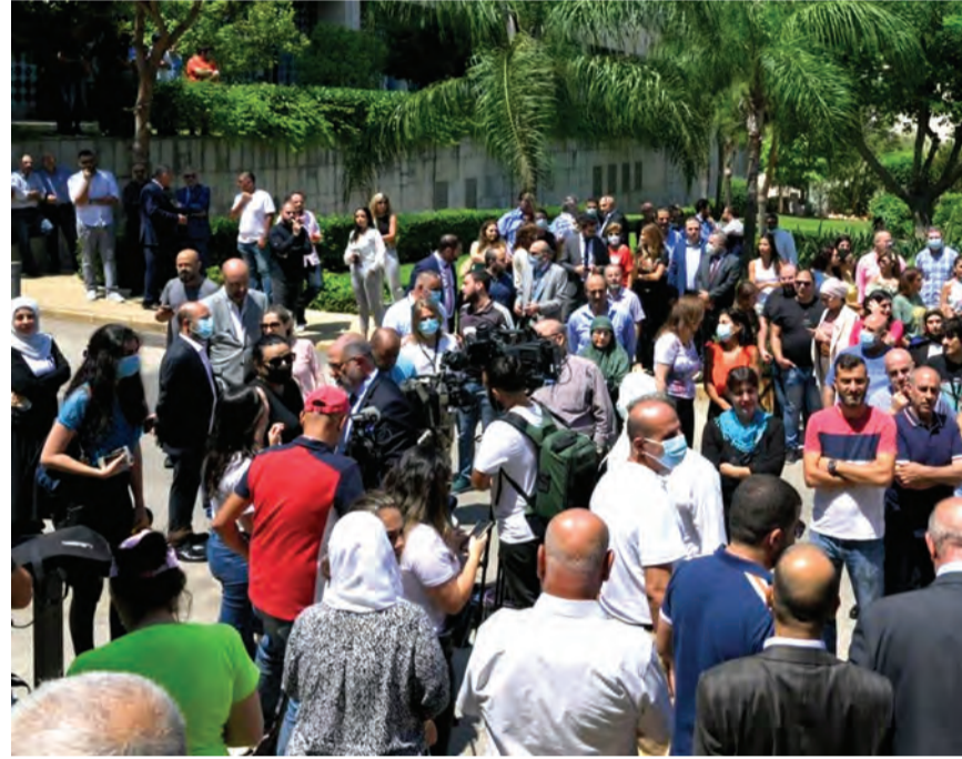
اعتصام لموظفي مصرف لبنان