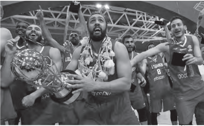
لبنان بطلا للعرب