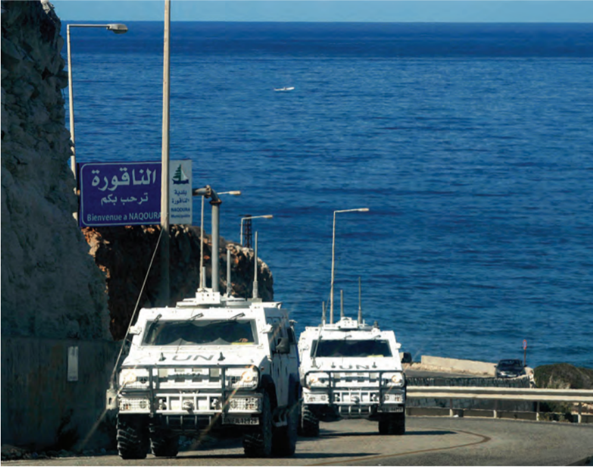
ترقب لبناني لما سيحمله هوكشتاين في ملف الترسيم