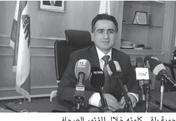
حمية يلقي كلمته خلال المؤتمر الصحفي

عقد وزير الاشغال العامة والنقل في حكومة تصريف الاعمال الدكتور علي حميه مؤتمرا صحافيا ظهر اليوم، تناول فيه «التعميم المتعلق بإزالة كل لوحات الاعلانات الموضوعه على الأملاك العامة التابعة لوزارة الأشغال العامة والنقل وإعادة تنظيم عملية الترخيص»، طالباً من الجهات المعنية «المؤازرة في تطبيقه».