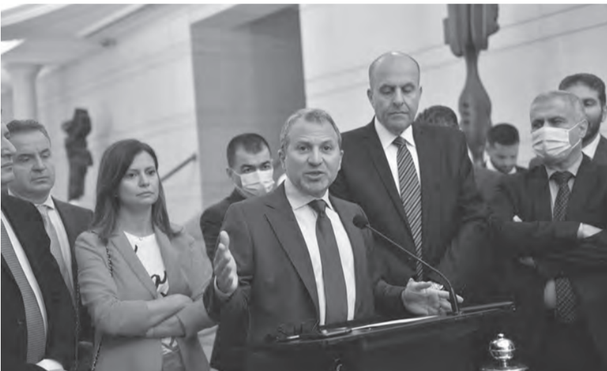
باسيل يلقي كلمته بعد الاستشارات ومعه وفد التكتل

لا يكفي عدد الأصوات التي حصل عليها ميقاتي لكي تنال حكومته الثقة، حتى ولو تمكن من إقناع الحزب «التقدمي الإشتراكي» بالتصويت لصالح الثقة بالمستقبل، فإن العدد قد لا يكفي، مع العلم ان مشاركة «الإشتراكي» بأي حكومة هو أمر محسوم، ولو من الباب الخلفي، لأن الحزب «التقدمي» كان واضحاً أمام الجميع بأنه الممثل الوحيد للدرز في الحكومة، نسبة لنتائج الانتخابات النيابية، لذلك لا بد لميقاتي من الحصول على رضى التيار الوطني الحر كاملاً، هذا مع