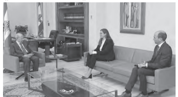
عون مجتمعاً مع سفيرة الدانمارك

باحة معبد باخوس، وان تصميم اللجنة على اقامتها رغم الظروف التي يمر بها لبنان، هو دليل على ان هذا الوطن قادر على تجاوز الصعاب وان ارادة ابنائه اقوى من الملمات».