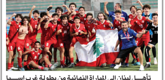
تأهل لبنان الى المباراة النهائية من بطولة غرب آسيا للناشئين في كرة القدم بعد فوزه على العراق ١-٠.