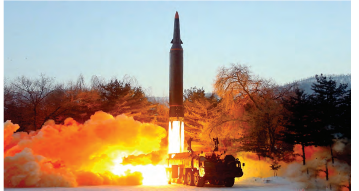
صاروخ إسكندر الروسي