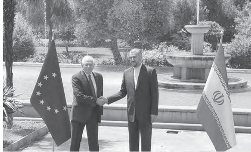
بوريل وعبد اللهيان في طهران

ويتزافق هذا التقدم الاقليمي مع توافق دولي -اوروبي - اميركي لانجاز الاتفاق النووي الدول