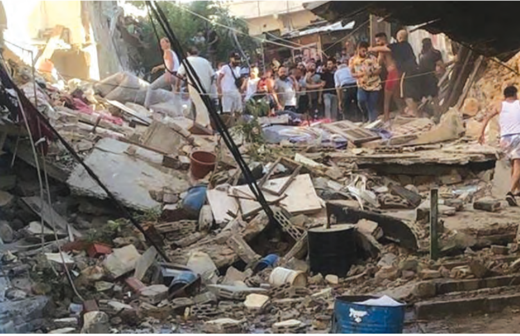
(التفاصيل صفحة ٥)