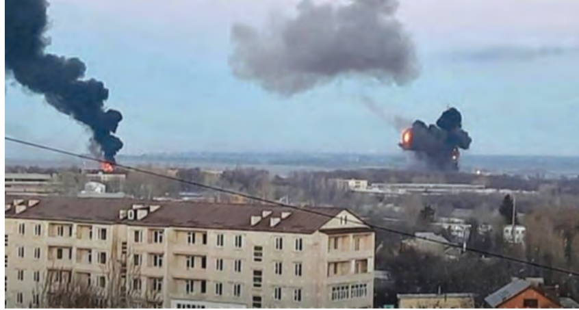
الغارات الروسية على كيف

ونتيجة لهذا الاستهداف، قتل رجل وعرثر على جثة امرأة في ٣١ من العمر وتحمل الجنسية الروسية بحسب ما أعلنه مستشار وزير الداخلية الأوكراني أنتون هيراشينكو، في حين تم نقل ابنتها ذات الـ أعوام إلى المستشفى، وأصيب ٦ آخرون.