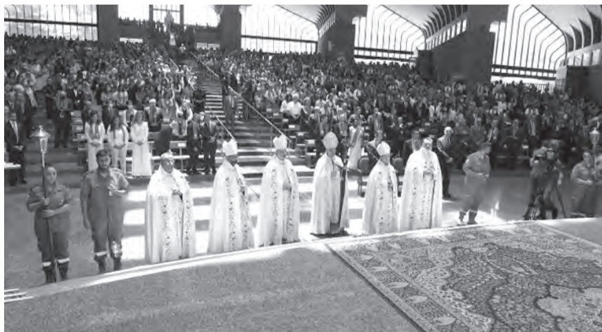
الراعي يترأس القداس

أضاف: «كم كنا نتمنى لو أن المسؤولين المدنيين والسياسيين عندنا يتمتعون بذرة من الإيمان وشجاعة التحدي الذي يقتضيه، لما كنا نعيش في حالة الانهيار الكامل سياسياً واقتصادياً ومالياً ومعيشياً واجتماعياً. كنا نتمنى لو شاركت في تسمية الرئيس المكلف، أياً يكن المسمى، فئات نيابية أوسع لتترجم، بفعل إيجابي ودستوري وميثاقى، الوكالة التي منحها إياها الشعب منذ أسابيع قليلة، ولا سيما أن الاستشارات الزامية، هكذا تشعر جميع المكونات اللبنانية أنها تتشارك في كل الاستحقاقات الدستورية والوطنية. في كل حال نتوجه بالتهنئة لرئيس نجيب ميفاتي لإعادة تكليفه. وندعو له بالتوفيق. إننا من جديد نطالب بالإسراع في تشكيل حكومة وطنية لحاجة البلاد إليها، ولكي يتركز الإهتمام فوراً على التحضير