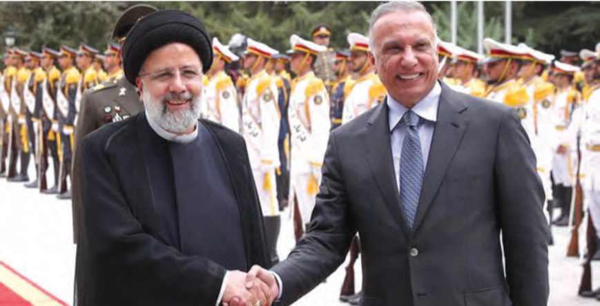
الكاظمي مستقبلاً رئيسي

في دعم وتعزيز الأمن والاستقرار الإقليميين». ويذكر أن العلاقات الدبلوماسية بين المملكة العربية السعودية وإيران مقطوعة منذ ست سنوات، بعد أن هاجم منظاهون إيرانيون مقر البعثات الدبلوماسية السعودية في إيران، على خلفية إعدام المملكة لرجل الدين الشيعي نمر النمر، لترد الرياض بقطع العلاقات مع طهران.