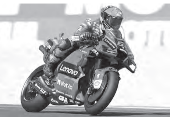
بانايا خلال السباق

ونهب المركز الثاني إلى الناشئ الباهر بيزيكي، بينما عاد فينالييس للصعود إلى منصة التتويج بعد غياب طويل لصالح أربيليا مستفيداً من تجاوز خايطي من ميلر في نهاية اللفة ما قبل الأخيرة. وبقيادة مفيرة للغاية، تعافى أليكس إسبارغارو بشكل مهدهش ليعبر خط النهاية في المركز الرابع بعد تجاوز مزدوج على براء بيندر وميلر في المنعطف ما قبل الأخير في اللفة الختامية. وحل خورخي مارتن سابعاً في النهاية، بينما ذهب المركز الثامن إلى جوان ميرو وميغيل أوليفيرا، بينما أكمل أليكس رينز ترتيب العشرة الأوائل.