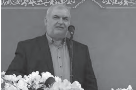
رعد يلقي كلمته

مع الفريق الرابع في ظل اوضاع معيشية حرجة لا تطال فئة خاصة من المجتمع اللبناني، بل تطال كافة المجتمع من دون استثناء..»