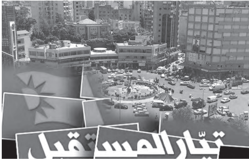
تتار الصد قبل