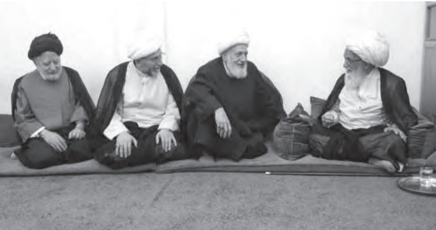
الخطيب يزور الحكيم

والتقدير وهذه المحبة تجاه لبنان ونسأل الله أن يطيل أعمارهم وأن يوفقم للمزيد في هذا السبيل».