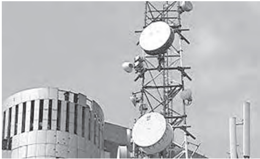
فحسب، بل يتم تعديل الشروط لتكون أكثر مراعاة للمواطنين.

بدأ من ١ تموز، سيتم احتساب تعرفه خدمات واشتراكات الاتصالات الخلوية وفق القسمة على ثلاثة تسدّد بالعملة اللبنانية بحسب سعر منصة صيرفة. وعليه فإن الاشتراك الشهري للخط الثابت سيصبح ٥.٥ د.أ. أو ما يوازي ١٢٥ ألف ل.ل. على أن يستمر صاحب الخط بالاستفادة من ٦٠ دقيقة تخاير. بالنسبة لسعر الفيغابايت، نشرت شركتا الاتصالات الخلوية تاتش وأفا أسعارهما على موقعهما الإلكتروني وعبر قنواتهما الاجتماعية عقب المؤتمر الصحافي الذي عقد بحضور وزير الاتصالات وأسعار في ٢٦ أيار الماضي.