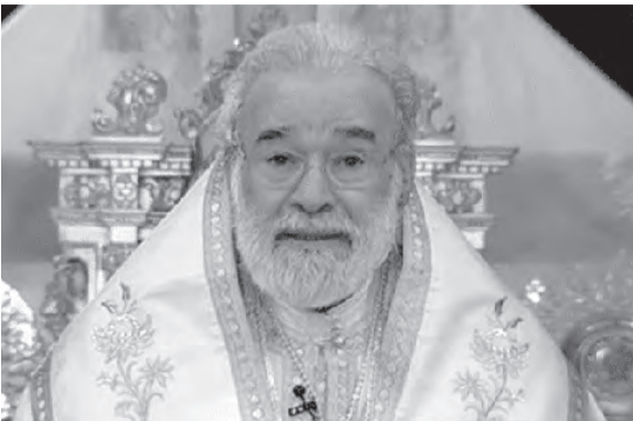
عوده يلقي عظته

الميل الذي لديه، وعلى كل شغف نحو نشاط جنسي خارج الأطر الأخلاقية لزواج الرجل من المرأة. قد يكون الصراع صعباً، ولكن بنعمة الله كل شيء ممكن. غالباً ما يكون الصليب الذي يجب أن نحمله هو الجهاد من أجل التغلب على العواطف الجامحة. من المهم أن يكون لدى الأشخاص الإيمان والالتزام الروحي لفعل مشيئة الله، وبذل كل ما في وسعهم لمحاربة كل شهوة ضارة مستعنيين بالصوم، والصلاة، والإرشاد الروحي، وأسرار الكنيسة المقدسة. المؤمنون مدعوون أن يتوافقوا بإرادتهم وسلوكهم مع وصايا المسيح. على الإنسان أن يتغلب على ميوله لكي يشترك في طريق الخلاص. نحن نشجب كل الحملات والنذوات والأنشطة التي تدعو المثليين جنسياً للاستسلام لشغفهم. إن آباء الكنيسة واضحون بشأن مخاطر تعريض المرء نفسه لأجواء تدفعه إلى الخطيئة. لأنه عندما تسود الشهوة لا العقل، يقع الإنسان في حلقة مفرغة خبيثة. محبتنا للتقريب تعني مقاربتة في الحق لا في الجمالة، ودعوته إلى التوبة والقيام بما هو مناسب لخاصه، والتأكيد على ما هو صالح ومقدس من أجل خيره ومصالحته مع مشيئة الله القدوس».