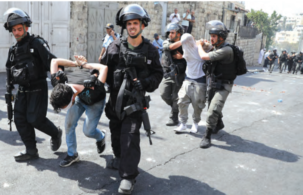
قوات الاحتلال تعتقل الشبان الفلسطينيين