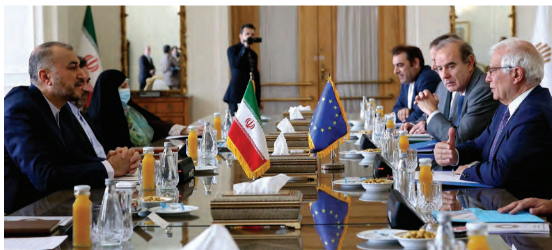
عبد اللهيان مجتمعاً مع بوريل والوفد المرافق