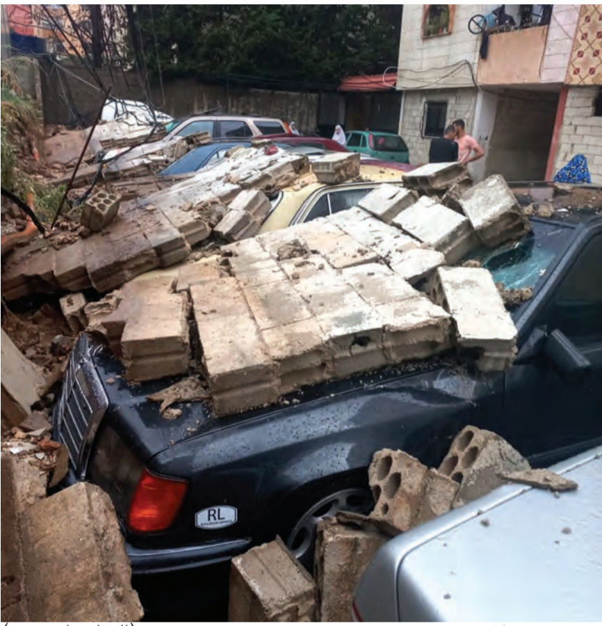
(التفاصيل ص ٥)