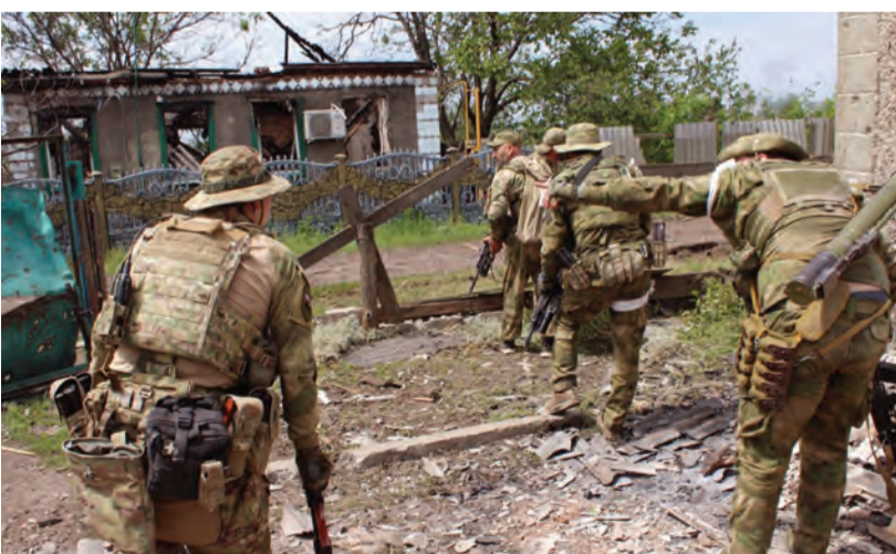
الجيش الروسي في احياء سيفيرودونيتسك

أعلنت الحكومة الأوكرانية أن الصواريخ الروسية هاجمت أهدافا في أنحاء البلاد أمس السبت، حيث أصابت منشآت عسكرية في الغرب والشمال، مع دخول أكبر صراع عسكري بري في أوروبا - منذ الحرب العالمية الثانية - شهره الخامس. في حين أعلنت موسكو سيطرتها الكاملة على مدينة سيفيرودونيتسك الاستراتيجية في إقليم دونباس.