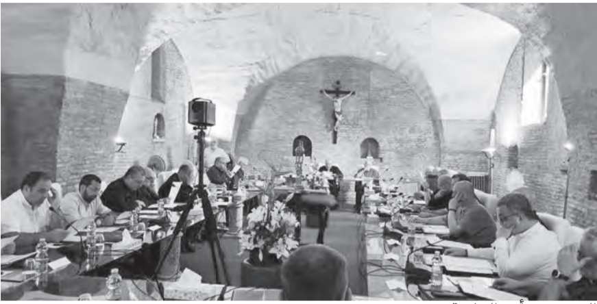
العجسي يترأس الجلسة

العجسي : على جدول أعمالنا إنتخاب أساقفة جدد