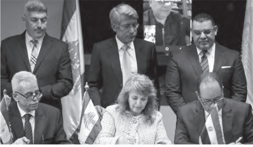
خلال توقيع الاتفاقية

تصل الى ٤ ساعات اضافية في لبنان وهو بأمر الحاجة اليها.