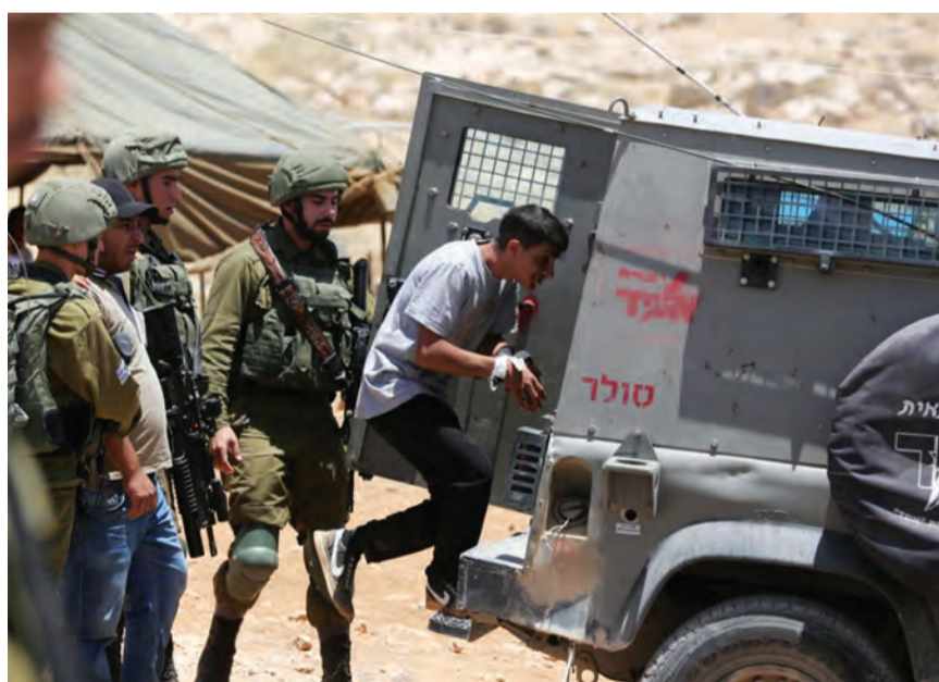
اعتقالات في الضفة