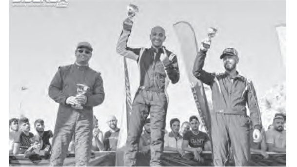
تتويج أبطال فئة المحترفين