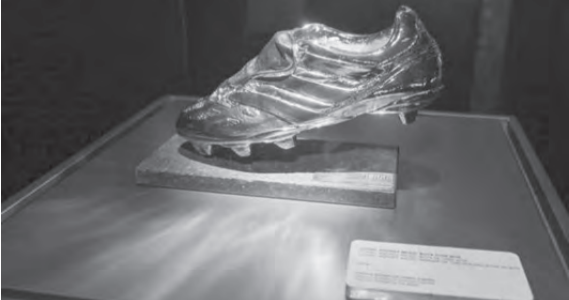
من سيحز جائرة الحذاء الذهبي؟

الوحيد من بين هدافي دوريات أوروبا الكبرى الذي يزيد عدد أهدافه على عدد المباريات التي خاضها. ويحصل ثانياً بنسبة ٠,٨٧ هدف للقضاء إيموبيلي هداف الدوري الإيطالي، بعدما شارك في ٣١ مباراة سجل فيها ٢٧ هدفاً، أما كريم بنزيما الذي سجل نفس عدد الأهداف فجاءت نسبته ٠,٨٤. بسبب مشاركته في مباراة أكثر. وحل رابعاً كيليان مبابي بنسبة ٠,٨ هدف للقضاء، بعدما سجل ٢٨ هدفاً في ٣٥ مباراة، ثم يأتي محمد صلاح بنسبة ٠,٦٧ هدف في المباراة الواحدة بتسجيله ٢٣ مرة في ٣٤ مباراة، بفارق ضئيل للمباراة أمام هيونغ سون مين الذي خاض مباراة أكثر من صلاح.