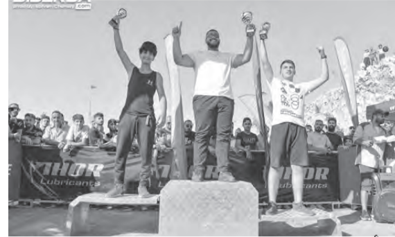
...وأبطال فئة الهواة