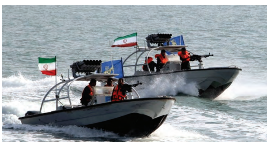
بحرية الحرس الثوري الايراني

وأكد عبّادي أن الثلاثة «كانوا يخططون لاغتيال عدد من المسؤولين وفقاً لتقديرات المخابرات»، دون أن يحدد جنسية المعتقلين. ويأتي الإعلان عن القبض على الشبكة وسط تصاعد التوتر بين إيران وإسرائيل، على وقع تعثر مفاوضات فيينا وإجراء التوقيع على اتفاق نووي جديد إلى أجل غير مسمى. وبرزت مظاهر هذا التصعيد من خلال تكرار قصف الطيران الحربي الإسرائيلي ما توصف بأنها أهداف عسكرية إيرانية في سوريا، إضافة إلى كشف الإعلام الإسرائيلي عن نشر منظومة رادارات إسرائيلية بالخليج. كما تأتي في سياق التهديدات التي ساقها