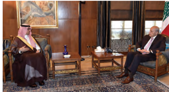
بري مستقبلاً بخاري