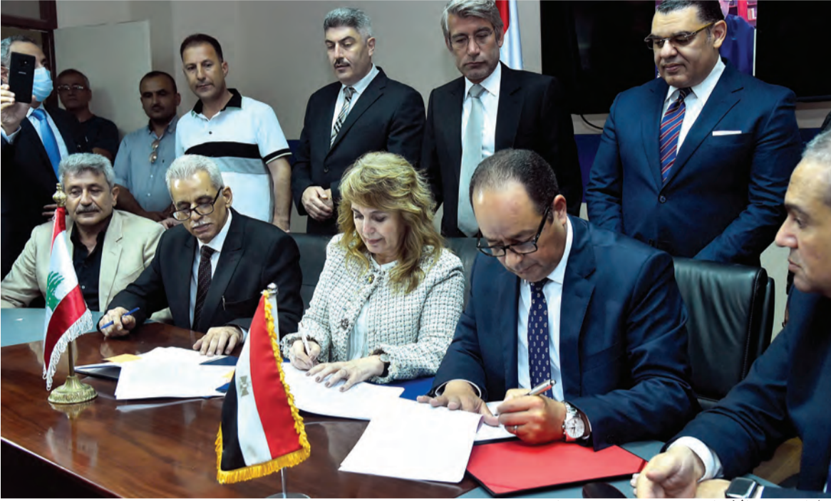
خلال توقيع الاتفاقيتين مع مصر وسوريا

مستعد لاعلان انسحابه من هذه المعركة مساء اليوم، علما ان رئيس المجلس النيابي كان قد أعطاه الضمانات اللازمة لجهة حصوله على نحو ٦٥ صوتا تلحظ عددا من الاصوات المسيحية التي تؤمن له «الميثاقية» المطلوبة.