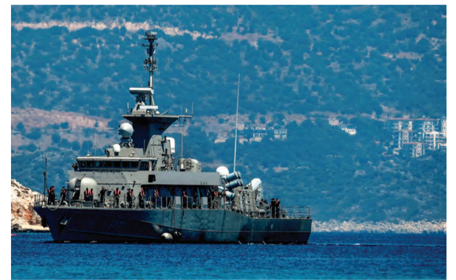
تعزيزات عسكرية في بحر ايجة

تصاعد حدة التوتر بين الجارتين الحليفين في حلف شمال الأطلسي «ناتو» (NATO)، تركيا واليونان، بعد اتهام أنقرة بتسليح ١٢ جزيرة في بحر ايجة بالقرب من الأراضي التركية، إلى جانب الخلاف المزمع حول ملف التنقيب عن الغاز الطبيعي في شرقي المتوسط. ووصل التوتر إلى حد تهديد الجنرال اليوناني المتقاعد، يانيس إيفغولوبولوس، بإمكانية