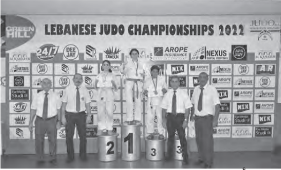
.. وفئة أخرى