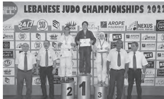
بطلات على منصة التتويج