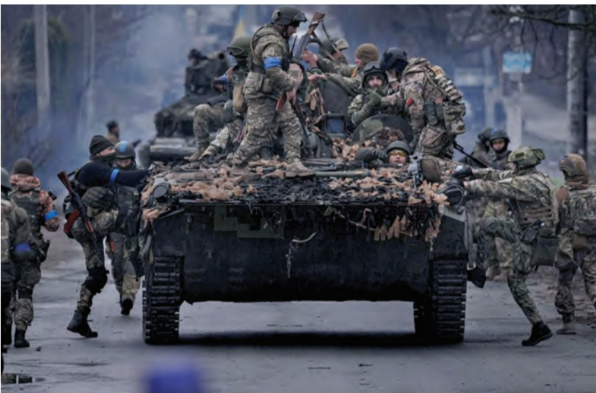
حشود عسكرية اوكرانية في ليسيتشانسك

أعلن الرئيس الروسي فلاديمير بوتين أن موسكو ستنتشر قريباً صواريخ «سارمات» العابرة للقارات والقادرة على حمل رؤوس نووية، فيما وصلت أولى قطع المدفعية الثقيلة (هاوتزر) من ألمانيا إلى أوكرانيا بعد نحو ٤ أشهر من بدء الحرب. وقال بوتين خلال كلمته أمس الثلاثاء في احتفال بالكرملين إن بلاده ستواصل تطوير وتعزيز قواتها المسلحة مع مراعاة التهديدات والمخاطر العسكرية المحتملة.