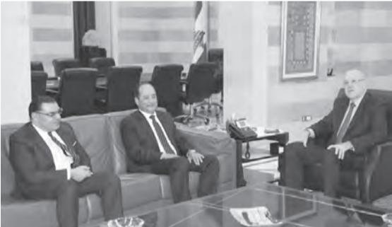
مقاتي مستقبلاً السفير المصري

زار سفير مصر في لبنان ياسر علوي ورئيس مجلس ادارة الشركة المصرية القابضة للغازات الطبيعية (Egas)، مجدي جلال، رئيس حكومة تصريف الاعمال نجيب ميقاتي عصر امس في السرايا الحكومية. وقال علوي بعد اللقاء: «التقينا الرئيس ميقاتي مناسبة توقيع العقد لتوريد الغاز الى لبنان. مصر لديها التزام استراتيجي اتخذ على أعلى مستوى، بدعم الدولة اللبنانية. في وقت انفجار مرفأ بيروت كنا معا، واليوم نحن الى جانب لبنان لمساعدته على الخروج من هذه الازمة. تذكرون بالطبع المسمى الاساسي الذي قام به الرئيس ميقاتي عندما التقى الرئيس عبد الفتاح السيسي مرتين، الاولى في شهر كانون الاول والثانية في شهر شباط، وتم الاتفاق على اطلاق هذا المسار. وانجزنا كل التفاصيل الفنية والتعاقدية والتجارية، والكلمة الاخيرة بالمعنى المجازي، لان السعر الذي تم الاتفاق عليه لتوريد الغاز هو اقل بنسبة ثلاثين في المئة من سعر السوق العالمي، وهذا يسر لدعم لبنان وجزء من الالتزام المصري الدائم بدعم لبنان الى ان نخرج سوريا من هذه الازمة الصعبة».