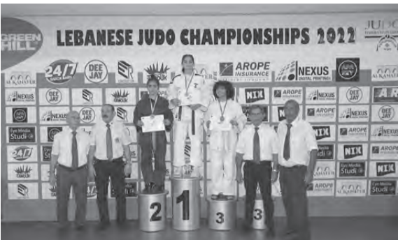
كبار الحضور مع بطلات إحدى الفئات