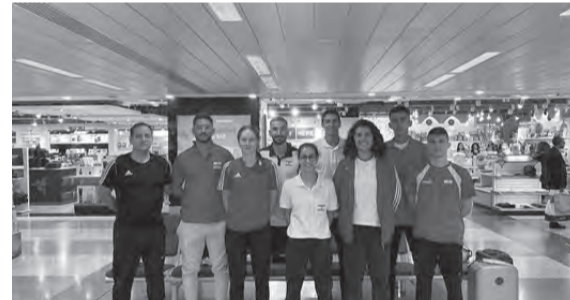
بعثة لبنان للتايكوندو قبيل المغادرة الى كوريا الجنوبية