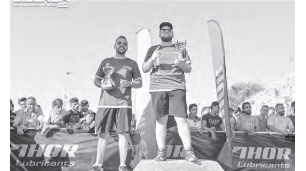
...وأبطال ال street modified