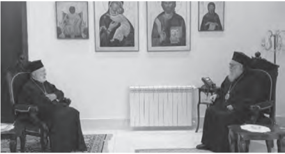
يوحنا العاشر يزور عوده

يوحنا العاشر زار عوده: لنكون الى جانب شعبنا