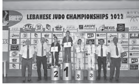
تتويج إحدى الفئات