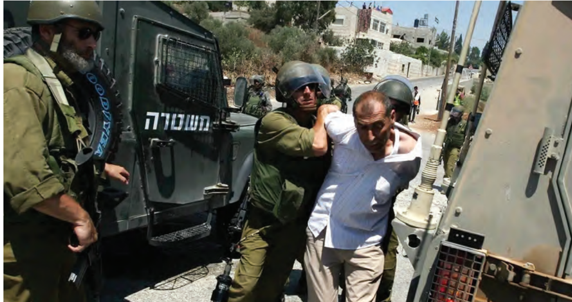
اعتقال أحد المصلين

اقتحم عشرات المستوطنين، امس، ساحات المسجد الأقصى، بحماية شرطة الاحتلال الإسرائيلي. وأفادت وكالة «وفا» الفلسطينية بأن عشرات المستوطنين اقتحموا المسجد الأقصى على شكل مجموعات من جهة باب اولى القبلتين، فلم يحترم الصهاينة شعائر الدين الإسلامي ودنسوا أماكن العبادة.