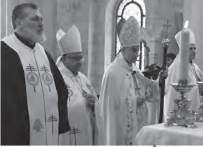
الراعي يترأس القداس