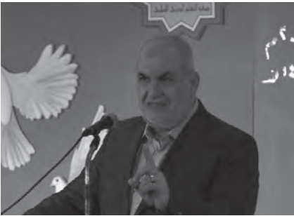
رعد يلقي كلمته

الفائزين الأوائل في مسابقتي السيدة الزهراء والإمام المهدي التي نظمتها جمعية التعليم الديني الاسلامي في النبطية، وقال: «للأسف بعض اللبنانيين ممن نريدهم شركاء لنا في هذا البلد، هؤلاء عندما حصلت الانتخابات بدأوا يدعون أنهم يمكنون الأكثرية النيابية، ونحن نقول أننا ما زلنا قوة نيابية وازنة نستطيع الحضور والتصرف بما يحفظ مصلحة شعبنا،