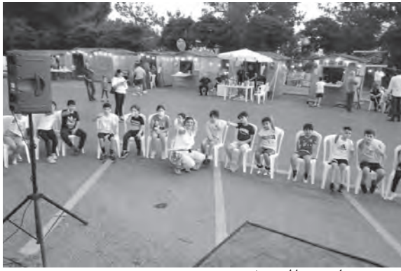
..ومهرجان من المونتيفردي

ثم تلا صلاة خاصة كرس فيها البلدة وأهلها إلى شفاعة القديسة ريتا..