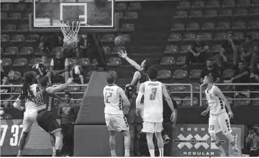
محاولة تسجيل لأحد لاعبي بيروت