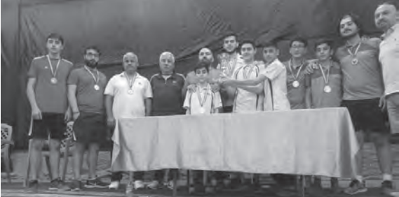
تتويج الفرق الفائزة