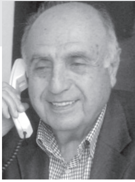
اعداد : لوران ناكوزي