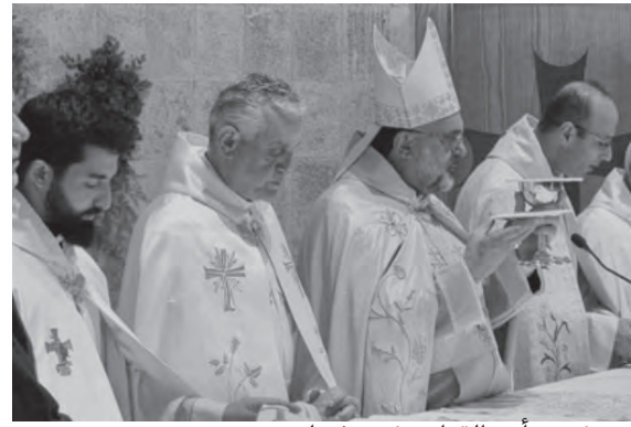
سوييف يترأس القداس في زغرّتا

شدّد راعي أبرشية بيروت للمرونة، المطران بولس عبد الساتر، خلال ترؤسه قداساً احتفالياً، في كنيسة القديسة ريتا في سنن الفيل، على أنّ «يا ليت سياسيينا المسيحيين يتوقفون اليوم قبل الغد، عن الكلام عن تفوقهم على الفريق الآخر، وعن مشاريعهم المستقبلية، وليعملوا مع الآخر من أجل إطعام الجائعين وإيجاد العمل للشبابنا، وبنيان وطننا ومن فيه»، مؤكداً «أننا شبعنا حكي». وتابع: «لم تختر قديستنا أن تتكلم عن المحبة بل أن تعيشها