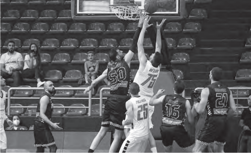
صراع على الريباوند في لقاء الحكمة وبيروت