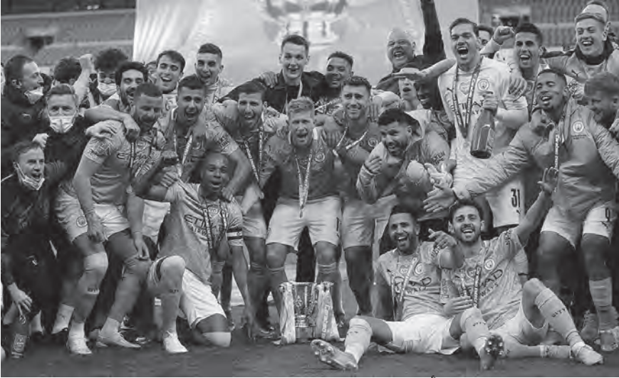
لاعبو مانشستر سيتي مع كأس الدوري الانكليزي

خسر فيه بيرنلي على أرضه أمام نيوكاسل بنفس النتيجة. وعلى صعيد المراكز الأوروبية، نجح توتنهام في تأمين تأهله إلى دوري أبطال أوروبا، بعد الفوز بخماسية نظيفة على حساب نورويتش سيتي. وسيشارك بالتالي كل من آرسنال ومانشستر يونايتد في الدوري الأوروبي الموسم المقبل، بإنهاء الموسم في المركزين الخامس والسادس على الترتيب، بينما سيتجه وست هام للمشاركة في دوري المؤتمر الأوروبي. ويأتي ذلك بعد تغلب آرسنال على إيفرتون بنتيجة (٥-٠) بينما لم يستفد وست هام من خسارة مانشستر يونايتد أمام كريستال بالاس (٠-١)، بخسارته هو الآخر أمام برايتون بنتيجة (١-٣).