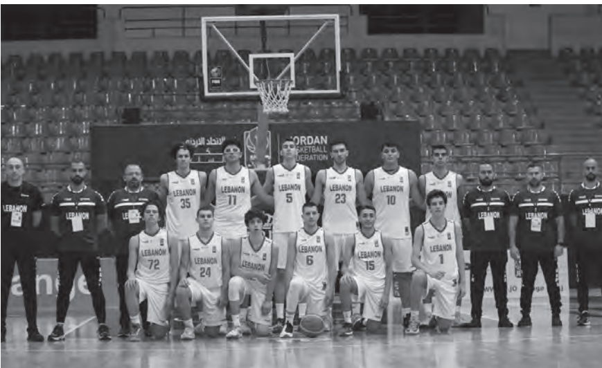
منتخب لبنان (تحت الـ ١٦ سنة) مع جهازه الإداري والفني في بطولة غرب آسيا