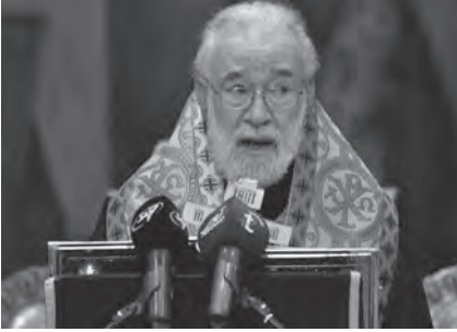
عوده يلقي عظته