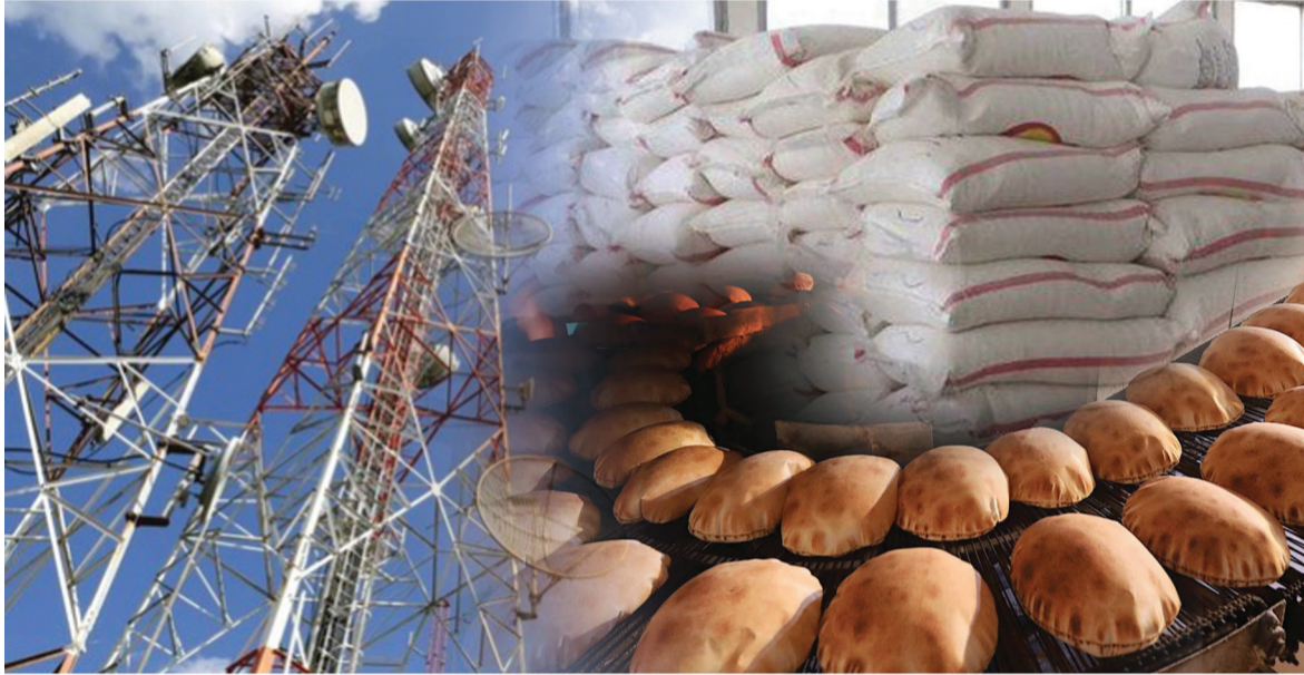
الازمات المعيشية تتفاقم

الإختبار الأول بوجهه حزب الله يبدأ بعدد الأصوات لانتخاب بري الدولار يُحلق عالياً ويؤجج صراع البقاء والفوضى الإجتماعية مبادرة فرنسية جديدة... هل ينجح ماكرون في احتواء الأزمة هذه المرة؟