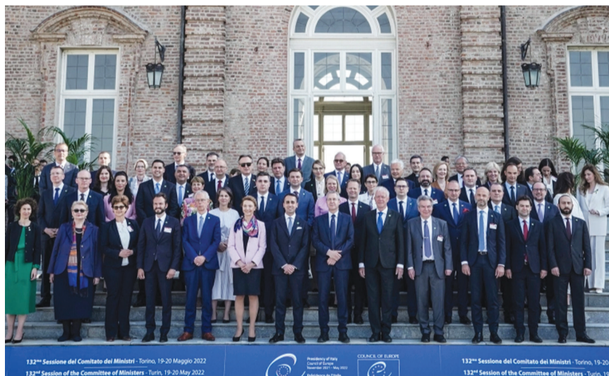
الوزراء الأوروبيون في تورينو

بحث وزراء دول الاتحاد الأوروبي في بروكسل تداعيات الحرب الروسية على أوكرانيا من ناحية الاقتصاد والأمن الغذائي، كما يُعقد اجتماع في تورينو لمناقشة سبل دعم كيف في هذه الحرب.