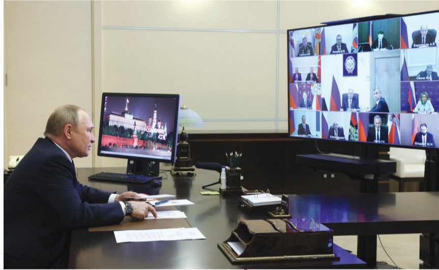
بوتين يلقي كلمته خلال اجتماع مجلس الأمن الروسي

أعلن الرئيس الروسي فلاديمير بوتين أن روسيا تتعرض لحرب سيرانية منذ بدء عمليتها العسكرية في أوكرانيا في ٢٤ شباط الماضي.