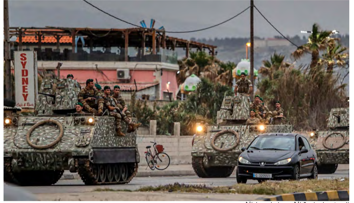
الجيش على اهبة الاستعداد لضبط الأمن