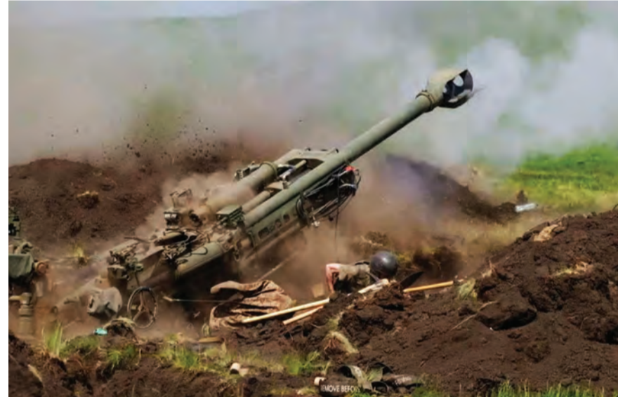
القصف على أوكرانيا

وأكدت هلسنكي أنها «تريد التعامل مع القضايا العملية المتمثلة في كونها دولة مجاورة لروسيا بطريقة صحيحة ومهنية».