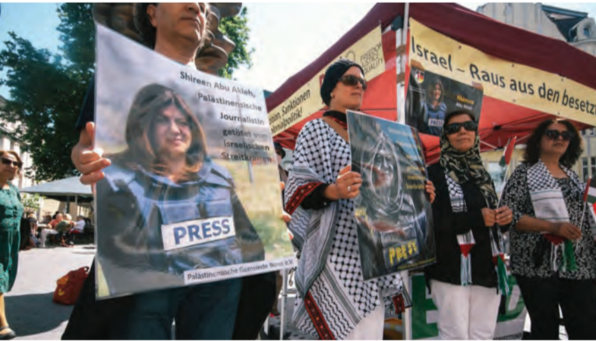
تظاهرات طالبا لتحقيق العدالة لشيرين في لندن

أعلن وزير العدل الفلسطيني محمد الشلالة أن ملف اغتيال الزميلة شيرين أبو عاقلة برصاص قوات الاحتلال الإسرائيلي سيحال إلى المحكمة الجنائية الدولية بمجرد استكمالها في أقرب فرصة ممكنة، في حين جدد الرئيس محمود عباس رفضه مشاركة الاحتلال في أي تحقيق بشأن الجريمة. وقال الشلالة، إن قانون الغاب سيسود إن لم تتم محاسبة «إسرائيل» باعتبارها دولة مارقة، مؤكدا أنه لا بد من مرجعية قانونية سواء من مجلس الأمن أو الجمعية العامة أو غيرهما.