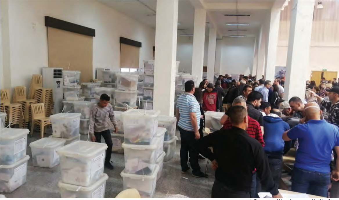
استكمال التحضيرات اللوجستية أمس

والقوات اللبنانية والارباك الحاصل في الشارع السنّي بعد انسحاب الرئيس الحريري وتياره من المعركة، يشكّلان عاملين مؤثرين وبارزين على النتائج، وعلى حجم الاكثريّة النيابية المقبلة. ويبرز عامل ثالث ايضا هو القوى التي تخوض هذه الانتخابات تحت عنوان التغيير، التي ترجح الاستطلاعات ان تتمكن من احداث خروقات في عدد من الدوائر املا في تكوين ما يمكن وصفه بالقوة الثالثة في البرلمان الجديد، مع العلم ان كل الاستطلاعات تشير الى انها لن تنجح في الحصول على اكثر من عشرة مقاعد خارج مقاعد حزب الكتائب والنواب