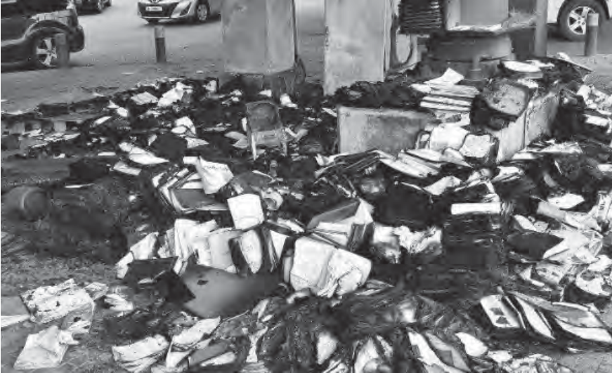
الحريق المفتعل للكتب

المغربي في المكان، إضافة إلى إحراق أغراضه الخاصة . وعليه، فإن وزارة الثقافة ممثلة بالوزير المرتضى تعمل بالتنسيق مع محافظ جبل لبنان القاضي محمد مكايي ومع الأمن العام اللبناني، ومع المراجع القضائية المختصة لجلاء ملابسات هذه الحادثة وتداعياتها والعمل على معالجة الموضوع في أسرع وقت ممكن، على أن يستكمل بعد ذلك العمل على معالجة أوضاعه المذكورة».