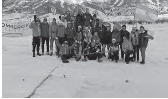
صورة تذكارية بعد التتويج