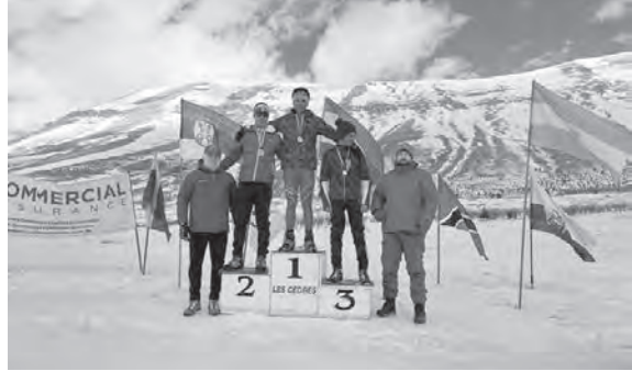
تتويج أبطال إحدى الفئات