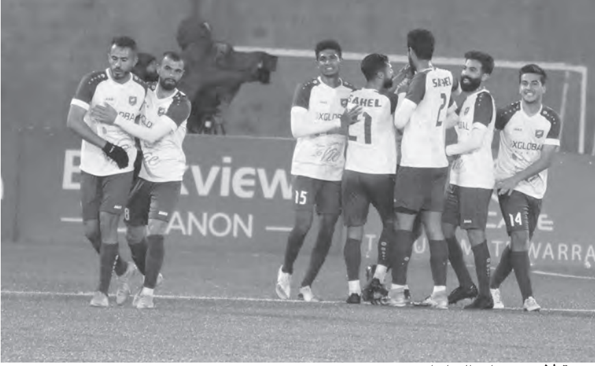
فرحة لاعبي شباب الساحل

ورفع التضامن صور رصيده إلى ١٤ نقطة، ليتربص مع نهاية المرحلة، لمعرفة إذا ما كان سيلعب ضمن سداسية اللقب أو الهبوط، في حين تجمد رصيده طرابلس عند ١٤ نقطة، ويتنظر نهاية الجولة لحسم مصيره.