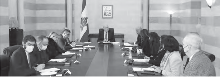
ميقاتي مترئسا الاجتماع

يشكل نهائي أن العقد لن يخضع لأي تداعيات سلبية جراء قانون قيصر، عندها يمكننا استقبال الكهرباء الأردنية والغاز المصري، والمفروض ان يتم ذلك في الشهرين المقبلين.