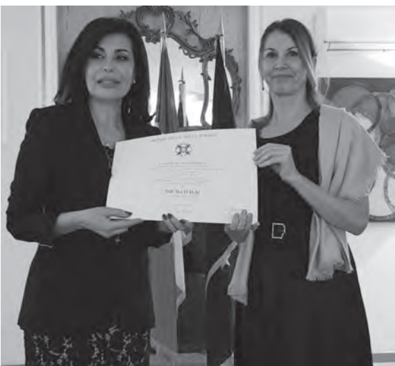
السفيرة الإيطالية سلمت الخليل الوسام

فقط أداة للصحة الجسدية، ولكن أيضا للصحة العقلية والتربية الأخلاقية والمصالحة الوطنية».