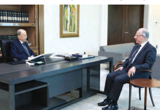
عون مستقبلاً سليم

زار وزير الدفاع الوطني مورييس سليم، رئيس الجمهورية العماد ميشال عون في قصر بعبدا، وعرض معه الأوضاع الأمنية في البلاد بشكل عام ووضع المؤسسة العسكرية بشكل خاص وحاجاتها.