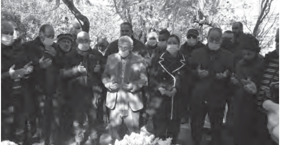
سعد يقرأ الفاتحة على الضريح

المقاومة الوطنية كانت خيار الضرورة لطرد الاحتلال واسترداد الكرامة الوطنية وكرامة الانسداد فوق أرضه. واليوم قد فاق القهر والتكيل بحقوق الناس كل حد. فمن يسترد كرامة الانسان في لبنان؟».