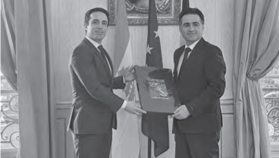
حمية مع نظيره الفرنسي

والحفاظ على خدماتها، والتعاون مع المديرية العامة للطيران المدني، بحيث ابدى جباري استعداداه «للتعاون وجراء ما يلزم من اتصالات لتحقيق ذلك».