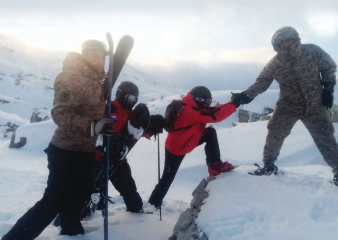
الجيش اللبناني انقذ شخصين عالقين في الثلوج في عيون السيمان

بالارض». وفي التفاصيل، تحدثت المصادر الحكومية عن ان يوم الاثنين ستكون الجلسة الاولى في بعدا لدرس جدول اعمال. ولاحقا بعد الظهر الاثنين وتوازي مع درس الموازنة، سيبدأ رسمياً عبر «زوم» التفاوض مع صندوق النقد الدولي بانتظار ان تخفف الولايات المتحدة الاجراءات المتخذة في مطاراتها حتى ياتي وفد الصندوق الى لبنان ويصبح التفاوض مباشرة. ولفتت الى ان جلسات ماراتونية ستعقد من الثلاثاء الى الخميس لمناقشة الموازنة في السراي الحكومي. اما عن الانتقادات التي تناولت الموازنة، فاعتبرت المصادر الحكومية ان هذه الشعبية والمزيدات هي استهداف سياسي لاهداف انتخابية واضحة. وتساءلت أن مشروع الموازنة توزع امس صباحا لدراسته قبل يومين فكيف بدأ المنظرون بالهجوم عليها؟ وتابعت ان الضرائب لم تكن يوما شعبية، ولكن الدولة بحاجة لايرادات وستكون تدريجية مع تحسن الوضع المالي مشددة على ان الموازنة ليست منفصلة عن الاصلاحات. ودعت كل الاطراف في الحكومة الى درسها علميا على طاولة مجلس الوزراء، مشيرة الى ان مناقشة الموازنة لا تكون عبر الاعلام. كما تمتد ان يكون الكلام الذي يقال داخل الحكومة لا يصبح كلاما مغايرا خارج الحكومة.