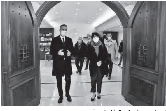
نصار مع السفيرة الفرنسية

في شهر نيسان ٢٠٢٢، بغية تعزيز الواقع السياحي فيها، وتم تأليف لجنة توجيهية تضم ممثلين عن الوزارة والجمعية، وستعقد اجتماعات دورية للتضير للمؤتمر السياحي، حيث سيكون اجتماعها الاول في مطلع الاسبوع المقبل، على أن يتضمن المؤتمر ورش عمل تتوزع على أربعة محاور هي: ١- الأولويات والاحتياجات لتطوير القطاع السياحي لقضاء جبيل، ٢- الموارد السياحية والثقافية والطبيعية والبشرية، ٣- سبل المشاركة والتكامل لتطوير القطاع السياحي لقضاء جبيل، ٤- التطلعات المستقبلية».