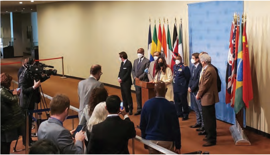
خلال بيان مجلس الأمن

«ضرورة تحميل المنفذين والمدبرين والممولين والمخططين مسؤولية هذه الأعمال الإرهابية، وإحالتهم على القضاء». ودعت الإمارات الأربعا الولايات المتحدة إلى دعم إعادة تصنيف جماعة الحوثيين