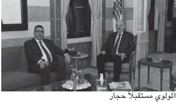
المولوي مستقبلاً حجار

لا يملكون حالياً بطاقة هوية، وبناء على هذه المعطيات، تم الإتفاق على آليّة العمل مع المولوي لمعالجة هذه المشكّلة والإسراع في إصدار بطاقات الهوية اللبنانية للراغبين بذلك.