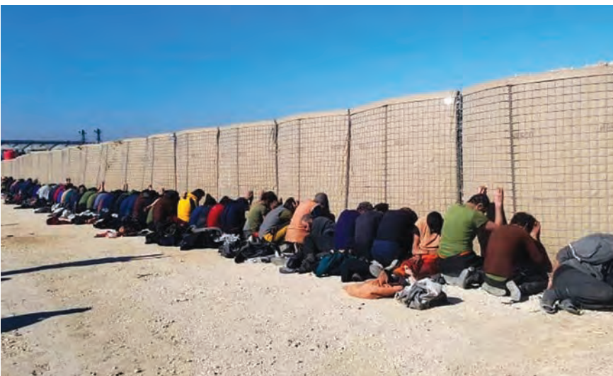
معتقلين من داعش

قالت قوات سوريا الديمقراطية إنها قتلت ٢٣ من عناصر تنظيم الدولة الإسلامية في اشتباكات بعد أن هاجم التنظيم سجن «غويران» في الحسكة شمال شرق سوريا الخميس، وجاء الهجوم سعياً من التنظيم لإخراج عدد من عناصره المعتقلين.