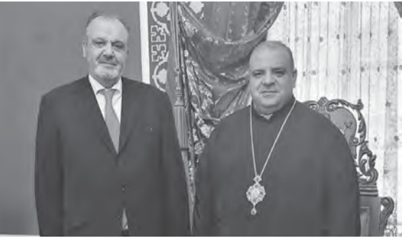
المطران ابراهيم مستقبلاً بوشكيان

استقبل رئيس اساقفة الفرزل وزحلة والبقاع للروم الملكيين الكاثوليك المطران ابراهيم مخايل ابراهيم وزير الصناعة جورج بوشكيان، برفقة وفد.