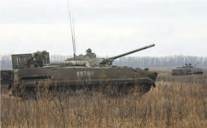
حشود روسية على حدود اوكرانيا

عملية مموهة وقرصنة وموجة تضليل واشنطن تكشف سيناريو غزو أوكرانيا بليكن : مستعدون لمواصلة الحوار مع روسيا