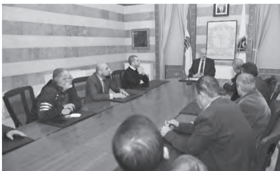
المولوي مجتمع مع فتفت والوفد المرافق

استقبل وزير الداخلية والبلديات القاضي بسام المولوي في مكتبه قبل ظهر امس، النائب سامي فتفت، يرافقه وفد من بلدة إيزال في الشمال، واستمع الى مطالبهم المتعلقة بالبلدة على كل المستويات.