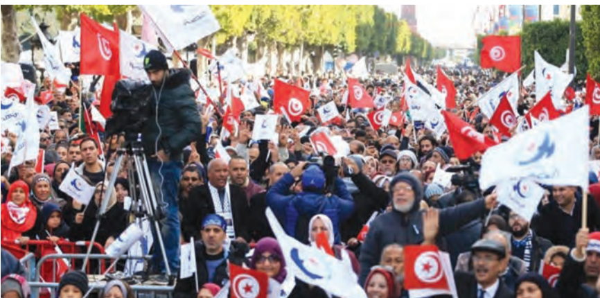
الاحتجاجات تعم شوارع العاصمة التونسية

بعد قمع المظاهرات في تونس النهضة تدعو للتنسيق لاستعادة الديمقراطية