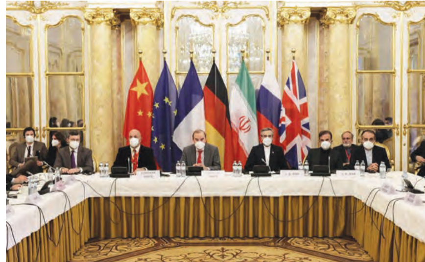
خلال الاجتماع اليوم

مشيدة بدور الصين وروسيا إيران تؤكد انحسار القضايا الخلافية في فيينا بايدن طلب خيارات بديلة للتعامل مع طهران