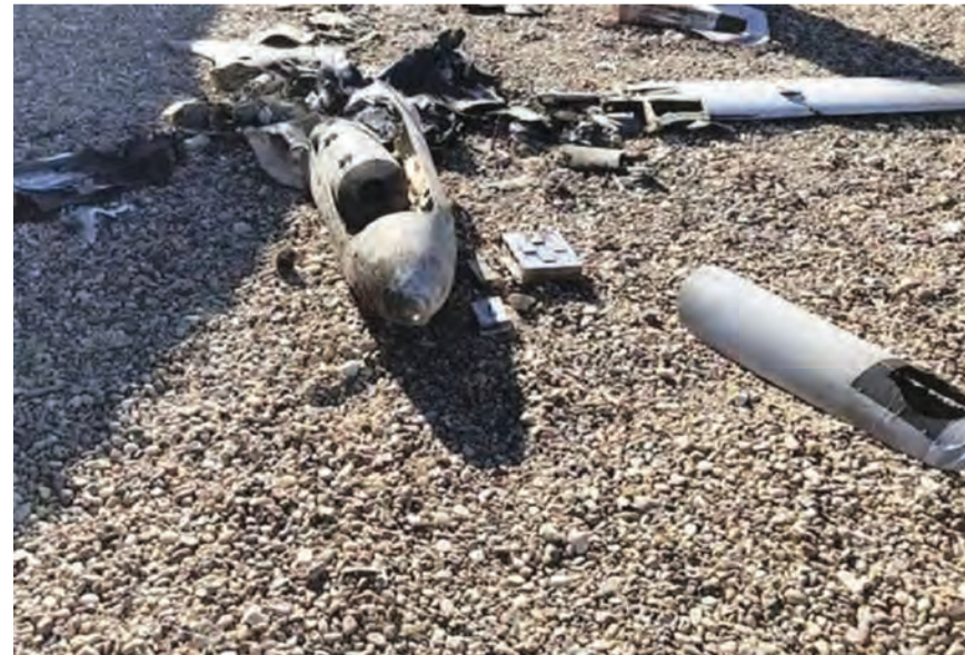
حطام إحدى المسيرات

إحباط هجمات بطائرات مسيرة على قاعدة بلد الجوية شمال العراق