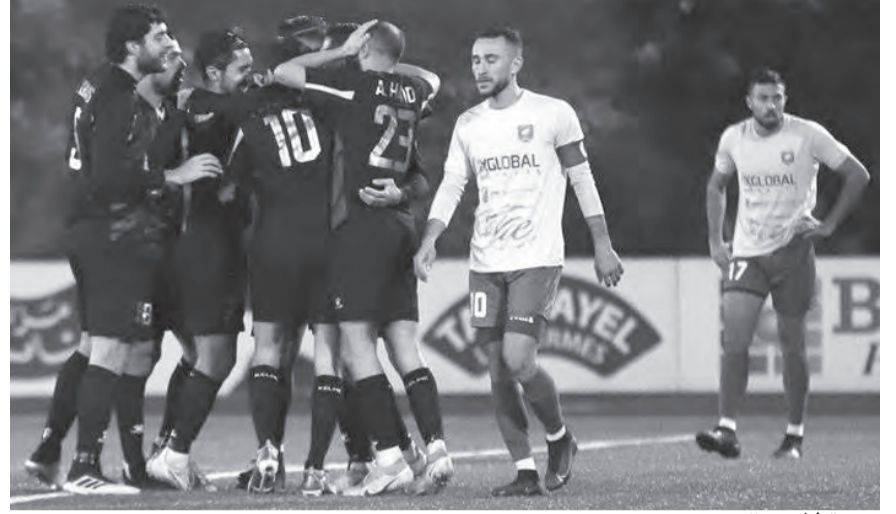
فرحة لاعبي العهد