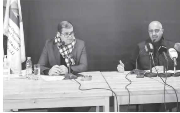
وزير البيئة متحدثاً

وغير المستدامة لهذا الملف منذ التسعينات، والاعتماد الأساسي على كبار المتعهدين وتجاهل السلطات المحلية، بالإضافة إلى أن طرق المعالجة النهائية كانت تنتهي بطريقة غير مكتملة وغير منظمة، مما أوصلنا إلى الأزمة الحالية..» وطرح «أفكاراً عدة من شأنها التأسيس لإدارة مستدامة ومتكاملة لهذا القطاع منها الفرز من المصدر، لا مركزية موسعة حقيقية لإدارة هذا القطاع من السلطات المحلية من خلال منح رئيس البلدية والاتحادات البلدية القدرة والصلاحيات لتقاضى رسوم كلفة جمع النفايات ومعالجتها وإدارتها، وتتم المعالجة النهائية للنفايات غير المعاد تدويرها أو استغلالها بتحويلها إلى وقود أو طاقة بديلة.»