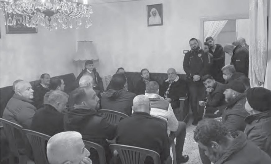
خلال اللقاء في القبة- طرابلس

وعقولنا، وانا واثق بأن قلوب وعقول الناس بدأت تتحرر من الاضاليل والاكاذيب التي جرى تسويقها على مدى ٢٠ سنة، وربما تكون هذه الحقيقة هي الفضيلة الوحيدة للانهار الذي نعيشه»، مضيفاً «لن يجدوا اليوم وعوداً وهمية يبيعونها للناس، كما باعهم خلال السنوات الماضية الوعود الكاذبة بالإمضاء والمشاريع والاستثمارات والوظائف، كما لن يجدوا الملفات الجذابة والكاذبة ايضاً التي يروجونها في مواسم الانتخابات..»