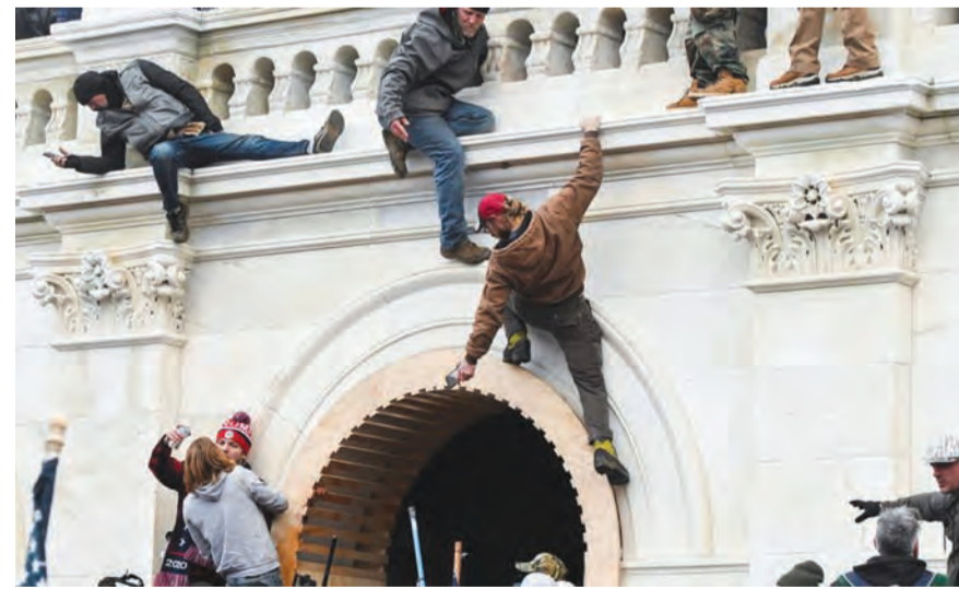
من اقتحام مبنى الكونغرس

القضاء الأميركي يتهم «حراس القسم» بقضية اقتحام الكونغرس... ويستدعي «فايسبوك» و«تويتر» و«يوتيوب» للاستجواب