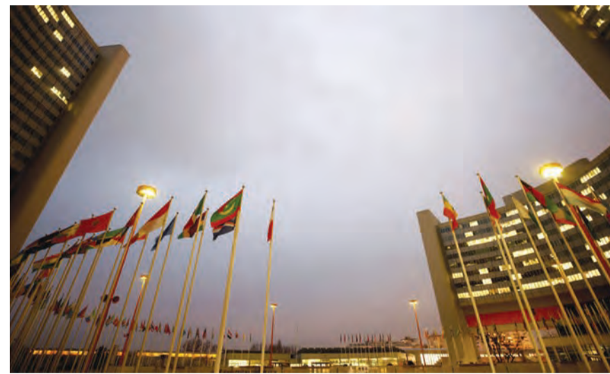
مركز مفاوضات فيينا

«مسار إيجابي» رغم أن الغرب يواصل استنكار «بطء» المسار في ظل استمرار إيران في تطوير برنامجها النووي.