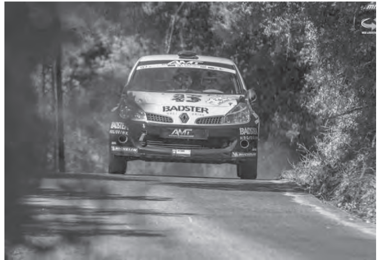
هنري قاعي وملاحه كارلوس حنا خلال احد الراليات