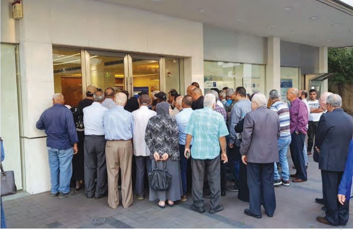
زحمة مواطنين على المصارف

يرفضه بري اضافة الى استياء بري من تحديد الرئيس عون في الدورة الاستثنائية لمجلس النواب جدول اعمال محدد وبالتالي لا جلسة تشريعية لمجلس النواب. وعليه، تبدو الامور مقلقة حتى الان حتى ان المصادر المتابعة للعلاقات بين الوطني الحر وبري وميقاتي تستبعد اي جلسة للحكومة قبل الانتخابات النيابية.