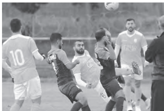
لقطة من مباراة طرابلس والأنصار