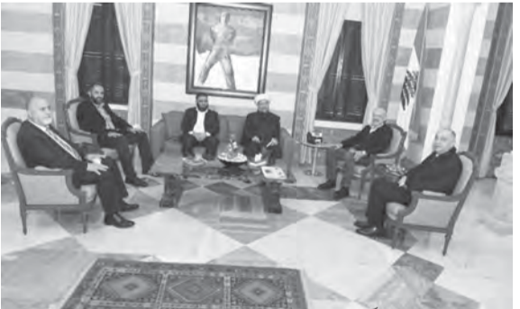
المولوي مستقبلاً وفد «هيئة العلماء المسلمين»

الامن الداخلي حتى الساعة». وأوضح المولوي أن «هدف حكومتنا هو اجراء الانتخابات، ومن باب الجدبة أصريت على فتح باب الترشيحات بسرعة ولحل المشاكل بدأت باكراً بالمعاملات والأمور الادارية لاجراء الانتخابات».