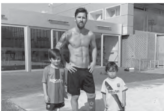
ميسي مع طفليه في المنزل

انتهى ليونيل ميسي نجم فريق باريس سان جيرمان الفرنسي من بناء قصره الجديد بمسقط رأسه روزاريو بتكلفة تبلغ ٣ ملايين جنيه إسترليني. وقالت صحيفة «ديلي ميل» البريطانية إن ميسي قام ببناء قصر جديد له أطلق عليه اسم القلعة على ٢ قطع من الأراضي في أفضل مناطق روزاريو، وأشرف على عمل المهندسين المعماريين خورخي والد اللاعب ووكيل أعماله. قصر ميسي الجديد يضم ٢٥ إلى ٢٥ غرفة، بالإضافة إلى قاعة سينما وصالة ألعاب رياضية «جيم» ومرآب كبير تحت الأرض يتسع لنحو ١٥ سيارة. ويضم القصر كذلك جناحاً مخصصاً للزوار فقط، معزولا عن غرف القصر الرئيسي لكن لم يتم الانتهاء منه بعد.