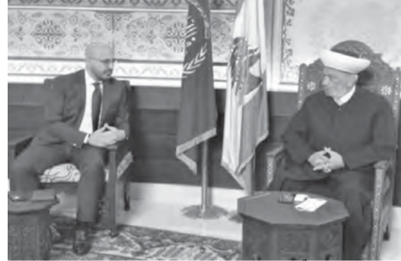
دريان مستقبلاً ياسين

استقبل مفتي الجمهورية اللبنانية الشيخ عبد الطيف دريان في دار الفتوى، وزير البيئة ناصر ياسين الذي قال بعد اللقاء: «تشرفت بزيارة مفتي الجمهورية واطلعت على برنامج عمل وزارة البيئة والأولويات التي تعمل عليها. واستمعت الى رأيه حول الأزمات المتعددة، وتناقشنا بطرق الخروج منها لتفادي تدهور المؤسسات وتداعبات ذلك على الناس ومعيشتهم».