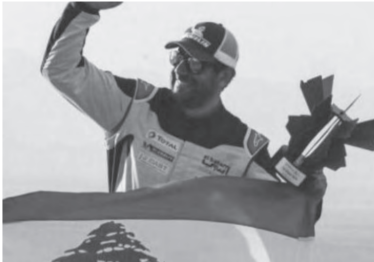
السائق البطل هنري قاعي يحتفل بفوزه حاملاً العلم اللبناني