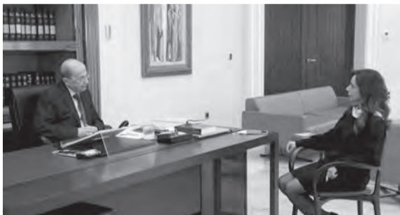
عون مستقبلاً عكر

استقبل رئيس الجمهورية العماد ميشال عون في قصر بعبدا، النائية السابعة لرئيس الحكومة ووزيرة الدفاع والخارجية بالوكالة سابقاً زينة عكر، وأجرى معها جولة افق تناولت الأوضاع العامة في البلاد والمستجدات السياسية. وقدمت عكر للرئيس عون التهاني بمناسبة الأعياد. واستقبل الرئيس عون الأمين العام لـ «حركة التنظيم» عباد زوين وأعضاء المجلس القيادية، جان مراد، إيلي مراد وطنوني هبر، وتداول معهم في الأوضاع العامة، حيث أكد زوين «وقوف الحركة إلى جانب رئيس الجمهورية في مواقفه ودعم الخطوات التي يتخذها من أجل مكافحة الفساد والمضي في التدقيق الجنائي».