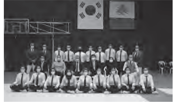
كبار الحضور مع الحكام

نظم الاتحاد اللبناني للتايكوندو بطولة لبنان في التايكوندو للناشئين والناشئات للعام الجاري تحت اسم «بطولة السفير الكوري الجنوبي» في نادي المون لاسال - عين سعاده شارك فيها ٨٧ لاعب ولاعبة من حملة الحزام الأسود من مختلف الأندية. وقد توزعت الجوائز على حبلتين.