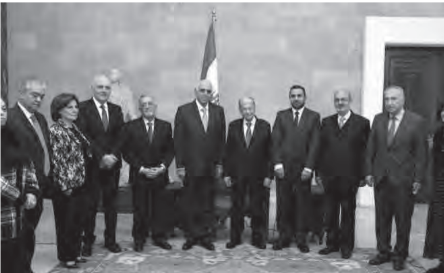
عون وفد نقابة المحررين برئاسة القصيفي (الداخلي ونهرا)

نجيب ميقاتي، وإن وجود اختلاف في الرأي أحياناً لا يعنى الخلاف. أما عن العلاقة مع حزب الله، فهناك امور يجب أن تقال بين الاصدقاء، ونحن ننادي بما يقوله الدستور». وترك عون الجواب على العلاقة مع «امل»، الى اعضاء الوفد.