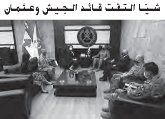
قائد الجيش مجتمعاً مع السفارة الأميركيَّة والوفد المرافق

غرَّدَ رئيس الحزب التقدمي الاشتراكي وليد جنبلاط عبر «تويتر»: «الى متى سننتظر التسوية المطلوبة والتي تقضي باجتماع الوزارة فوق كل اعتبار للمباشرة بعملية الإصلاح والتفاوض مع صندوق النقد الدولي؟ الى متى ستبقى الحسابات الفتوية الصغيرة اقوى من مصلحة الوطن؟ ماذا ينتظرون وقد بدأ الهيكل ينهار على رؤوس الجميع؟».