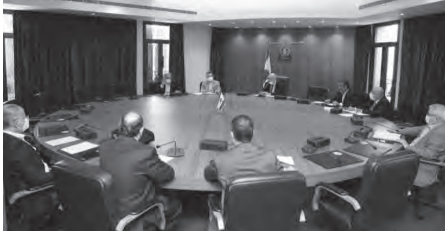
عراجي يترأس اجتماع اللجنة

عقدت لجنة الصحة العامة والعمل والشؤون الاجتماعية جلسة، قبل ظهر امس في المجلس النيابي، برئاسة النائب عاصم عراجي وحضور وزير الصحة فراس الأبيض وعدد من النواب.