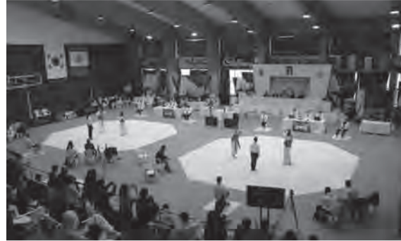
قاعة نادي المون لاسال خلال البطولة