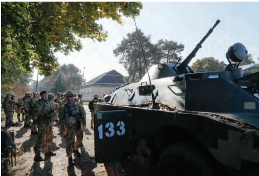
استنقار على الحدود امس

تتوجه مسؤوله في وزارة الخارجية الأميركية إلى موسكو لبحث التصاعد على حدود أوكرانيا الشرقية، وسط مخاوف غربية من غزو روسي محتمل، في حين أعلنت وزارة الدفاع الروسية أن قواتها تتعقب فرقاطة صاروخية فرنسية دخلت مياه البحر الأسود.