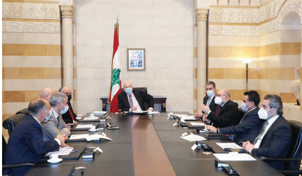
اجتماع الرئيس ميقاتي مع لجنة كورونا

واكد حمية حرصه على «عدم ارتهان القرار السياسي اللبناني بموضوع المال الذي سيأتي من الخارج، علماً اننا بحاجة اليه ونريده، انما ليس بالمعنى السلبي كسيف وصلت على رقابنا انما نريده بالمعنى الايجابي»، مشيراً الى سعيه ل «إيجاد حلول لتأمين إيرادات للخزينة العامة من اجل اعادة تعزيز دور لبنان بين دول العالم».