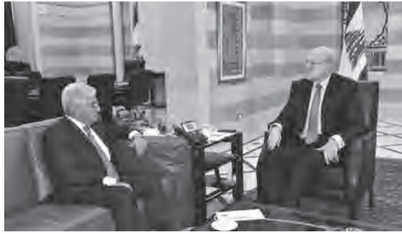
ميقاتي مستقبلاً صفير

الاستقرار الاقتصادي والمالي للبنان». وأعلن أنّ «رئيس الحكومة يولي موضوع حماية المودعين الأولوية».