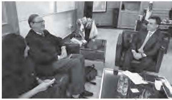
حمية مجتمعاً مع دوكان

لتأمين ايرادات للخزينة العامة من اجل اعادة تعزيز دور لبنان بين دول العالم».