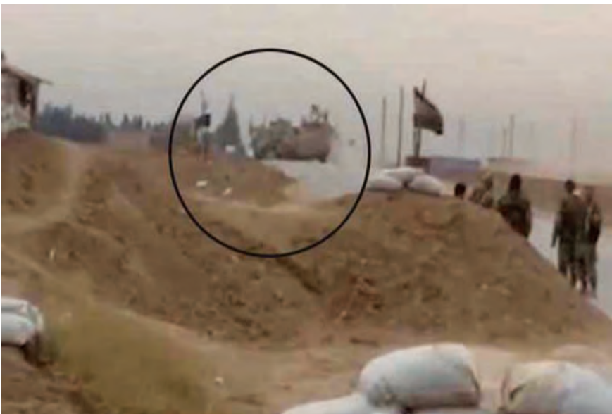
الجيش السوري يعترض الرتل الأميركي

من المرور عبر القرية، بعد رشقه بالحجارة وتكسير زجاج أحد العربات، وطردوه من المنطقة.