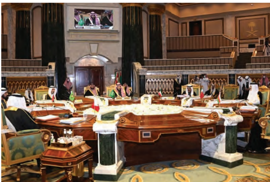
بن سلمان يترأس القمة امس

استضافت العاصمة السعودية الرياض امس أعمال اجتماع الدورة الـ ٤٢ لمجلس التعاون لدول الخليج العربية، وترأس الاجتماع نيابة عن الملك سلمان ولي العهد محمد بن سلمان. وتركز النقاش حول سبل تعزيز العلاقات بين الدول الأعضاء، إضافة إلى ملفات إقليمية ودولية، أبرزها سوريا واليمن وفلسطين. ووفقاً لوكالة الأنباء السعودية (واس) أن هذه الدورة ستناقش أيضاً تنفيذ رؤية الملك سلمان بن عبد العزيز آل سعود التي أقرها المجلس الأعلى لمجلس التعاون