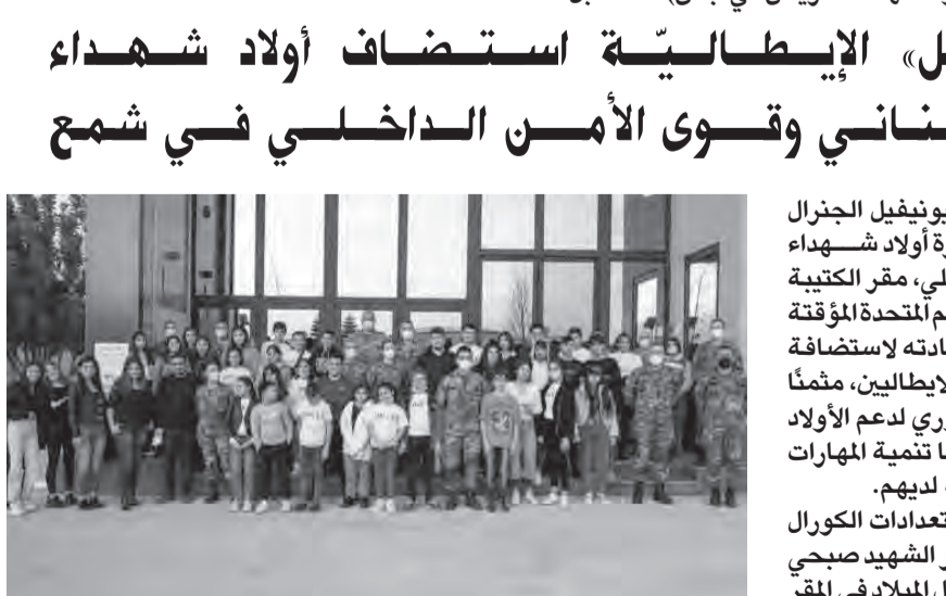
أولاد الشهداء من مقر الكتيبة الإيطالية

من ناحيته، أعرب الجنرال لاغوريو عن سعادته لاستضافة الأولاد، معتبرا إياهم إخوة للجنود الإيطاليين وتمنّ علماً الجهود التي تبذلها العقاقوري لدعم الأولاد في شتى المجالات وخصوصاً تنمية المهارات الرياضية والثقافية والاجتماعية لديهم.