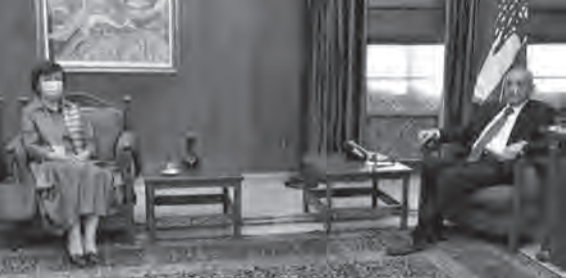
بري مستقبلاً فرونٲسكا