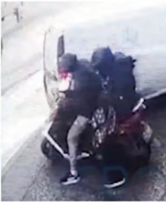
التقلت الامني بلغ الخطوط الحمراء امس