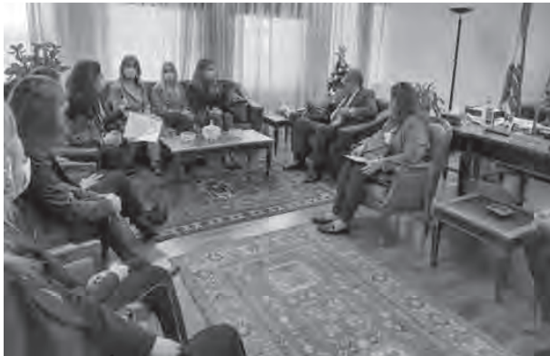
الخوري مجتمعا مع وفد اهالي موقوفي انفجار المرفأ

نسبة هذه المسؤولية في أعمالهم، كما نرفض أن يتحول الموقوفون الى كبش محرقة».