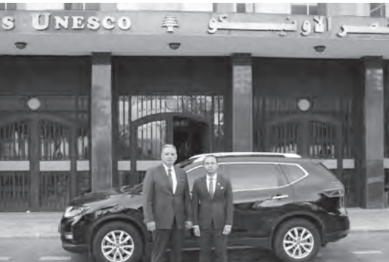
المرضى والسفير الماليزي

تفقد وزير الثقافة القاضي محمد وسام المرتضى امس، يرافقه السفير الماليزي في لبنان أزري مات ياكوب، قصر الاونيسكو، في إطار البحث في ما يمكن للدولة الماليزية ان تقدمه لإعادة تفعيل هذا المعلم الثقافي.