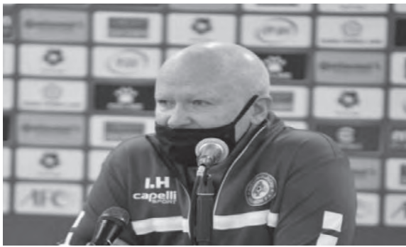
مدرب منتخب لبنان إيفان هاشيك

أمطر منتخب تونس شبك موريتانيا بخماسية مقابل هدف، أمس الثلاثاء، في افتتاح بطولة كأس العرب بقطر، ضمن المجموعة الثانية.