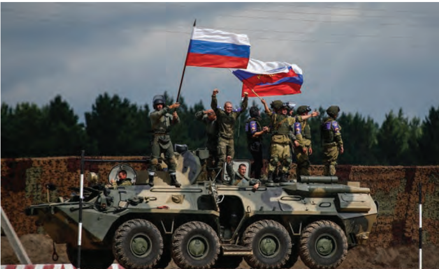
قوات روسية على الحدود مع أوكرانيا

أهمية الدفاع عما سماه «قيم الحلف» لمواجهة النظم الاستبدادية مثل الصين وروسيا، وفق وصفه. وطالب ستولتنبرغ الدول الأعضاء في الناتو بمواصلة استثماراتها لتعزيز قدرات الحلف الدفاعية، وشدد على أن وجود حلف شمال الأطلسي شرق أوروبا وفي كل من بحر البلطيق والبحر الأسود غرضه دفاعي وليس لاستفزاز أحد.