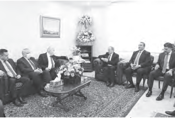
كسبار مستقبلاً زواره

استقبل نقيب المحامين في بيروت ناضر كسبار واعضاء مجلس النقابة، مهنتين، بينهم رئيس مجلس القضاء الاعلى سهيل عبود على رأس وقد ضمّه ورئيس هيئة التفقيش القضائي بركان سعد واعضاء المجلس القضاة عفيف الحكيم وحبيب مزهر وداني شلبي وميراي الحداد والياس ريشا، واعتذر مدعي عام التمييز غسان عويدات بداعي السفر.