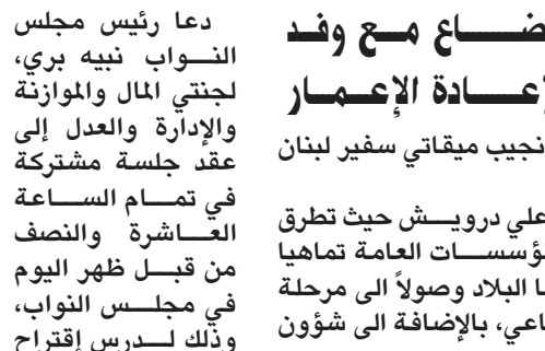
بري مستقبلاً كوهارجاه

التقى سفير سلطنة عمان ودرويش ميقاتي عرض الأوضاع مع وفد البنك الأوروبي لإعادة الإعمار والتنمية «EBRD» حيث تناول البحث البرنامج المشترك بين لبنان والبنك من أجل دعم الإصلاحات المتعلقة بسياسة التعافي الاقتصادي للبنان. رشيدي بحثت برامج الأمم المتحدة في لبنان مع بري وميقاتي زارت نائبة المسنقة الخاصة للأمم المتحدة في لبنان منسقة الشؤون الإنسانية نجاة رشيدي، رئيس مجلس النواب نبيه بري في مقر الرئاسة الثانية في عين التينة، حيث تم عرض للأوضاع العامة والبرامج التي تضطلع بها المنظمة الأممية في لبنان. كما التقت رشيدي على رأس وفد من مكتب المنسقة رئيس مجلس الوزراء نجيب ميقاتي، حيث جرى عرض للأوضاع العامة في لبنان والبرامج التي تضطلع بها المنظمة الأممية فيه.