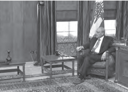
بري مستقبلاً كوهارجاه

دعا رئيس مجلس النواب نبيه بري، لجنتي المال والموازنة والإدارة والعدل إلى عقد جلسة مشتركة في تمام الساعة العاشرة والنصف من قبل ظهر اليوم في مجلس النواب، وذلك لدرس إقتراح قانون معجل مكرر يرمي إلى وضع ضوابط إستثنائية ومؤقتة على التحاويل المصرفية . من جهة ثانية، استقبل الرئيس بري في مقر الرئاسة الثانية في عين التينة، المدير الإقليمي لدائرة المشرق في البنك الدولي ساروج كوهارجاه، حيث تم البحث في مشاريع البنك الدولي في لبنان ومن بينها مشروع البطاقة التمويلية. بعد اللقاء قال كوهارجاه: «كان اللقاء جيداً مع الرئيس بري حول برامج البنك الدولي في لبنان، وكما تعلمون البنك الدولي يعمل على مشاريع وبرامج في لبنان خاصة في المجالات الاقتصادية وتطوير شبكات الآمان الإجتماعي وقدمت للرئيس بري ملخصاً حول هذه المشاريع وأهمها مشروع الطوارئ لدعم شبكة