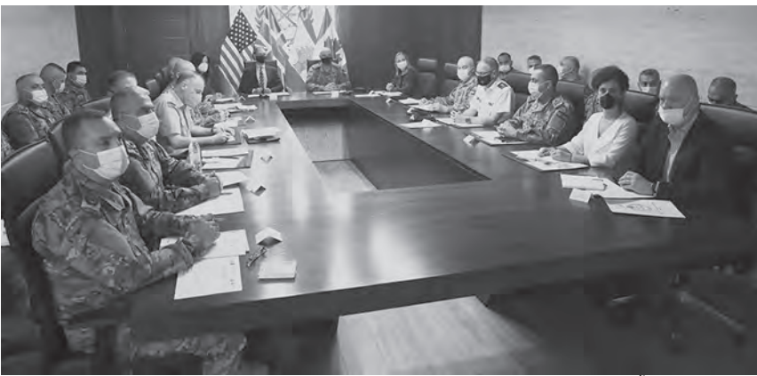
قائد الجيش يترأس الاجتماع

التسلل ودوره في مواجهة التنظيمات الإرهابية حفاظاً على أمن لبنان واستقراره»، مؤكداً التزام بلادهم بالاستمرار بدعم الجيش لتعزيز قدراته على مختلف الأصعدة وبخاصة في مجال مراقبة الحدود وضبطها». من جهته، شكر العماد عون السلطات الأميركية والبريطانية والكندية على دعمها المستمر للجيش.