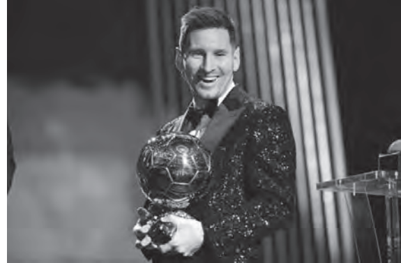
ميسي مع الكرة الذهبية

وأتم «وجوده رفقة غوريتسكا يسجل الفريق أكثر اندفاعا نحو الهجوم، ولقد أظهر بالفعل أمام أرمينيا بيليفيلد أنه خيارا مثاليا».