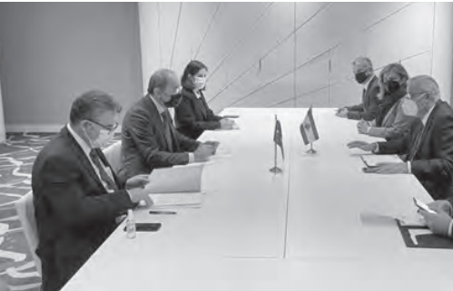
بو حبيب خلال لقاءاته

تحقيق التعافي الاقتصادي ولعب دورا اساسيا في المنطقة المتوسطة كما تمنى بو حبيب على المشاركين في الاجتماع «مواصلة دعم لبنان في ظل الظروف الصعبة التي يمر فيها حالياً». على هامش الاجتماعات، التقى بو حبيب وزير خارجية فنغاريا بيتر سيارتو، وتم تأكيد ضرورة تطوير العلاقات الثنائية والتنسيق في المحافل الدولية. ووقع الوزيران مذكرة تفاهم في المجال التربوي عن المنح الجامعية. كما التقى نظيره المونتينيغري، وتم البحث في كيفية تفعيل العلاقات الثنائية. وعقد بو حبيب لقاء مع الأمين العام للاتحاد من أجل المتوسط السفير ناصر كامل، وتمت مناقشة سبل تطوير انخراط لبنان في الاتحاد من خلال الاستفادة من مشاريع اضافية وسريعة ومن فرص العمل المتاحة..