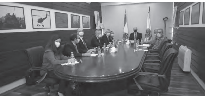
سليم مع الخبء

عرض وزير الدفاع الوطني مورييس سليم، مع وفد مشترك من خبراء بعثة الاتحاد الاوروبي، برئاسة مديرة برنامج مكافحة الارهاب لأجل أمن لبنان ACT انفسرغ زورن، وفريق خبراء المؤسسة الدولية والأيبيرية - الأميركية للإدارة والسياسات العامة FIAPP برئاسة خيسوس