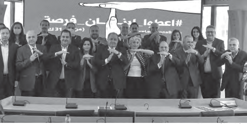
خلال إطلاق حملة

أطلق رئيس المجلس الاقتصادي والاجتماعي شارل عرييد ورئاسة تحرير مجموعة «النهار الإعلامية» نائلة تويني، حملة: «كانون الاول صفر اشتباك» مرفقا بهاشتاغ #اعطوا - لبنان فرصة في خلال مؤتمر صحافي مشترك عقد ظهر امس في مقر المجلس في بيروت، حضره: نائب رئيس المجلس الاقتصادي الاجتماعي سعد الدين حميدي صقر، نائب رئيس الاتحاد العمالي العام حسن فقيه، نقيب اصحاب الفناق رئيس اتحاد النقابات