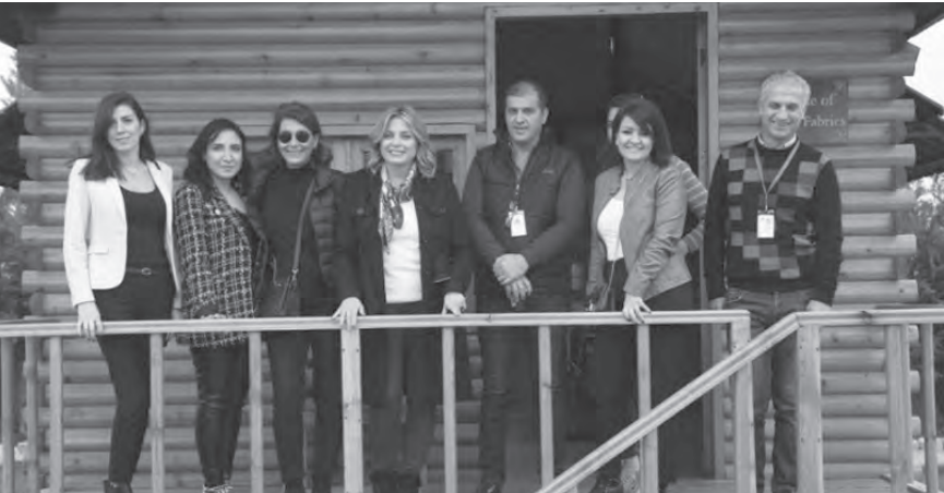
خلال الجولة في بعلبك

٥٥٠ وجبة غذاء مجانية يومياً للأسر في المنطقة، و«مؤسسة فلورا» وهي عبارة عن معمل لتصميم وإنتاج الملابس الجاهزة يعمل فيه رجال ونساء من بعلبك. واختتمت نشاطها بزيارة القرية الزراعية التي تهدف إلى تطوير القطاع الزراعي ودعم المزارعين وتأمين التدريب المهني للعاملين والحاملات في الزراعة، والتي تضم ١٤ مهندسة زراعية.