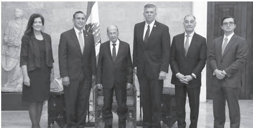
عون ووفد الكونغرس

وكان رئيس مجلس الوزراء نجيب ميقاتي استقبل في السري الوفد الأميركي. وخلال الاجتماع، أبدى ميقاتي تقديره «لوقوف الولايات المتحدة الأميركية على جانب لبنان ودعمها المستمر للجيش»، مشدداً على التزام لبنان بتطبيق القرارات الدولية والحفاظ على الأمن والاستقرار». بدوره، شدد الوفد الأميركي «على الوقوف الى جانب لبنان على مختلف الصعد وعلى دعم جهود الحكومة اللبنانية. كما شدد على ضرورة إنهاء الخلافات السياسية بما يتيح التركيز على معالجة الأوضاع الاقتصادية والاجتماعية».