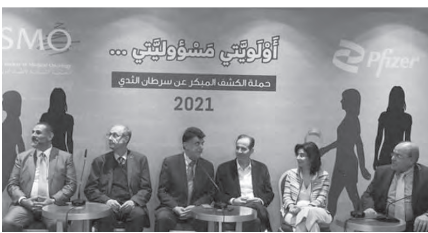
خلال إطلاق الحملة

ودعا السيدات إلى «التوجه إلى مراكز الأشعة على الأقل مرة واحدة في السنة وعندما تدعو الحاجة»، لافتاً إلى أن «سرطان الثدي هو أكثر أنواع السرطانات شيوعاً لدى النساء. وحسب آخر الإحصائيات في العام ٢٠١٦، فعقد الحاصلات الجديدة ٢٥٠٠ حالة ولكن أعلى نسبة وفيات هي الوفيات الناتجة عن سرطان الرئة»، محذراً من «التأثير المباشر للتدخين على الرئة، حيث ان ٩٠ بالمئة من الحالات هي نتيجة التدخين».