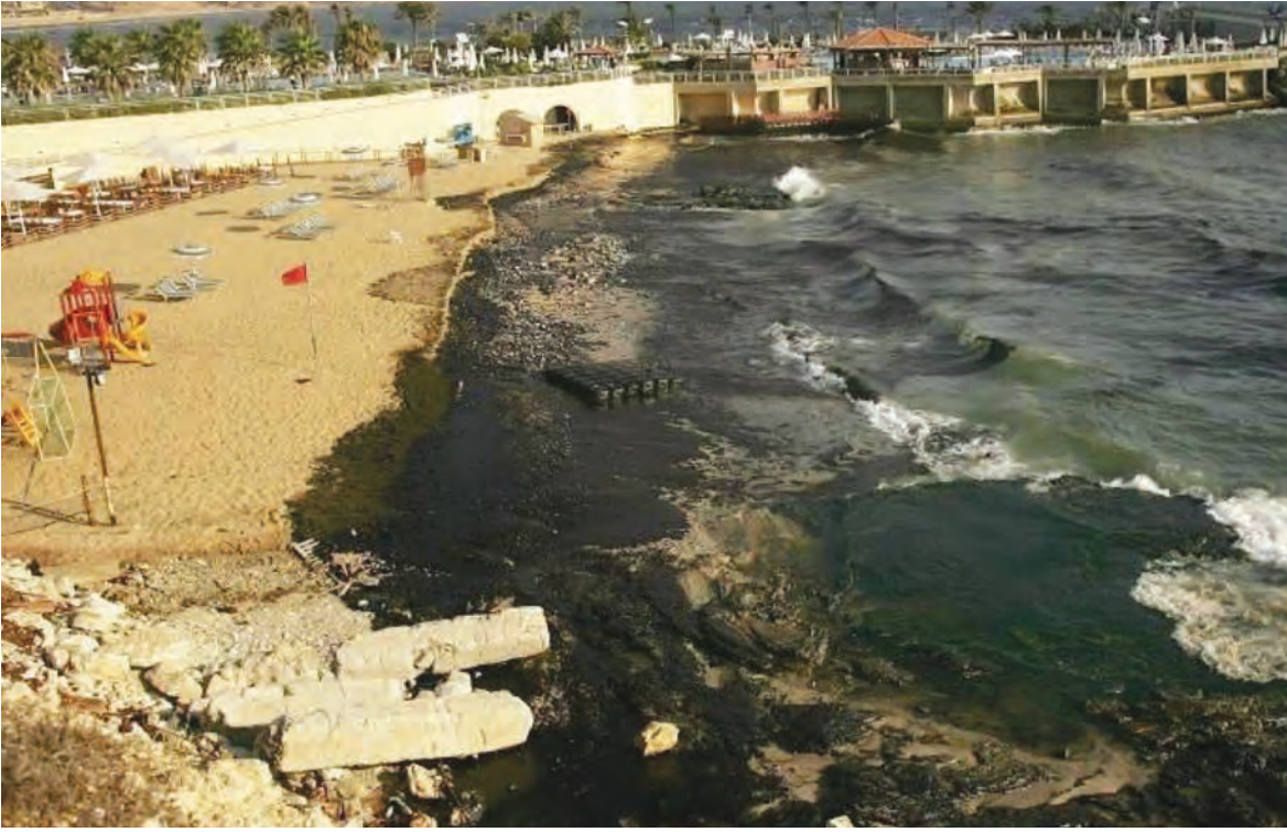
تلوث الشاطئ اللبناني بعد غارة جوية اسرائيلية في حرب تموز ٢٠٠٦

استخدامها من قبل الحكومة بالشكل المُناسب وليس على الدعم كما قامت به حكومة حسان دياب.