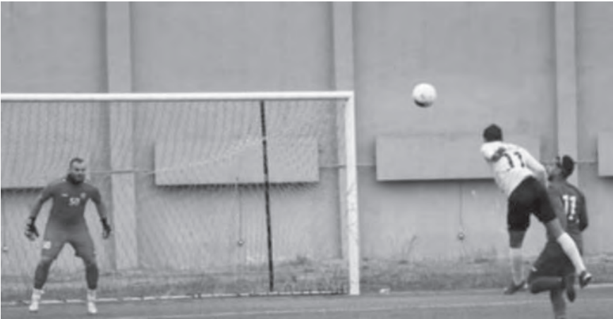
من لقاء الصفاء والبرج

تعادل فريقا الصفاء والبرج بنتيجة سلبية في المباراة التي جرت على ملعب أمين عبد النور في بجمدون ضمن منافسات افتتاح الجولة السادسة من الدوري اللبناني لكرة القدم، أمس السبت.