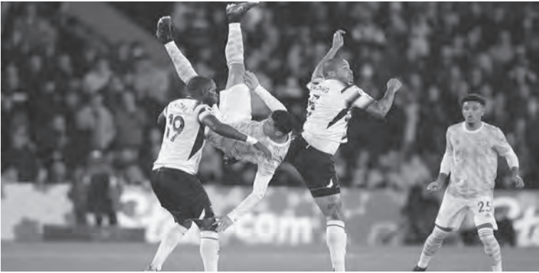
من مباراة واتفورد ومانشستر يونايتد

وبايبر ليفركوزن على بوخوم (١-٠) وتعادل أرمينيا بيلفيلد مع فولفسبورغ (٢-٢).