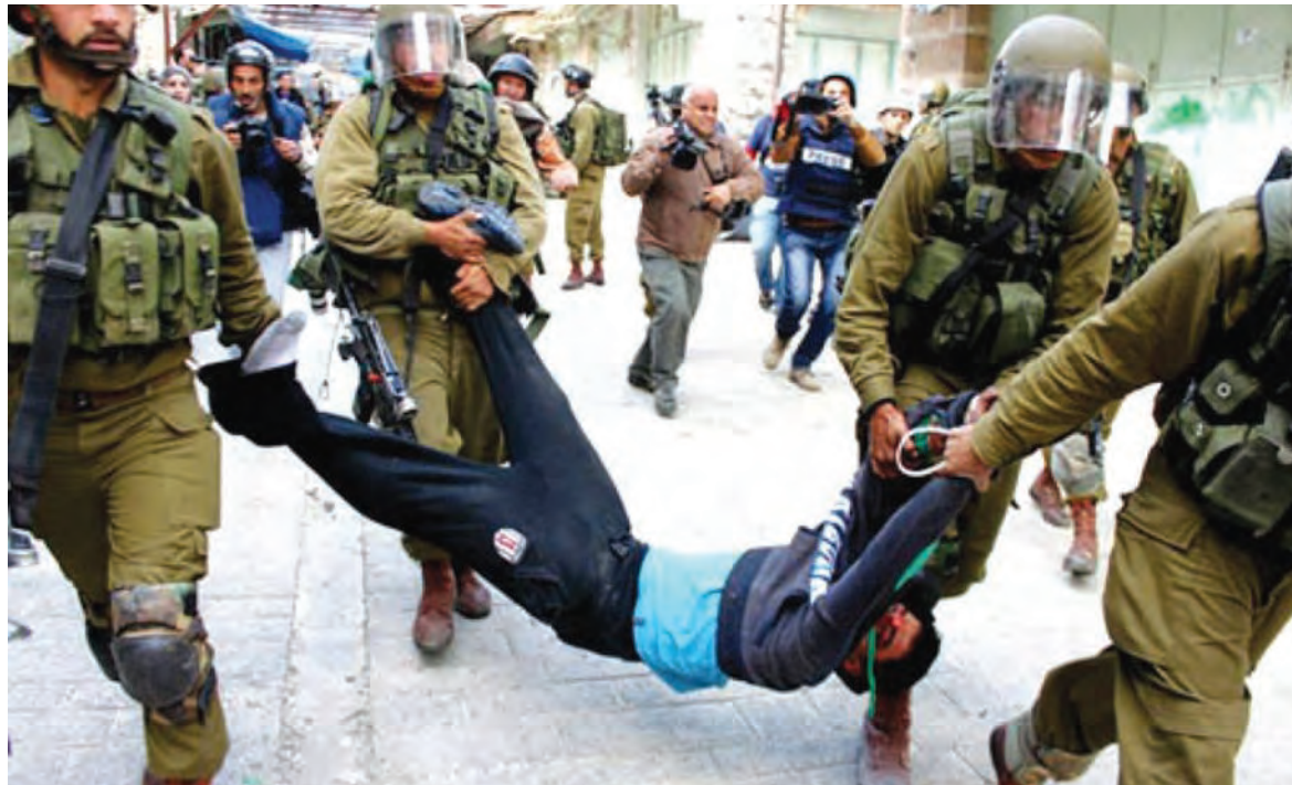
وحشية الاحتلال ضد الاطفال

اعتسقت قوات الاحتلال الإسرائيلي امس فلسطينيين اثنين في الضفة الغربية. وذكرت وسائل إعلام فلسطينية، أن قوات الاحتلال اقتحمت بلدة العيسوية في القدس المحتلة، واعتقلت فلسطينياً، كما اعتقلت آخر على أحد حواجزها في أريحا.