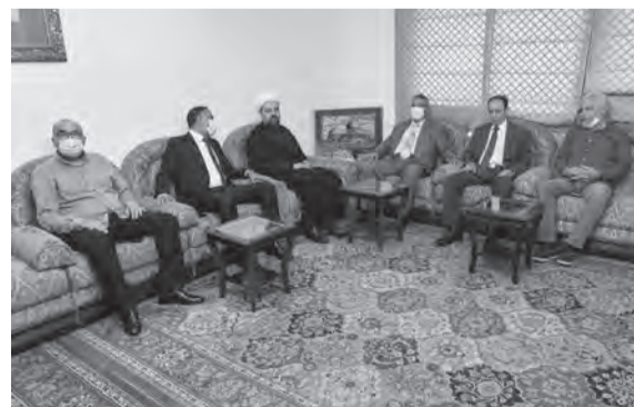
قبلان مستقبلاً رمضاني والوفد المرافق

كما التقى رمضاني على رأس وفد من المجمع، السيد علي فضل الله وكان عرض للاوضاع الإسلامية العامة والمهمات الملقة على عاتق المسلمين عموماً وأتباع أهل البيت خصوصاً ولا سيما في هذه المرحلة الدقيقة التي تمر فيها المنطقة والعالم الإسلامي.