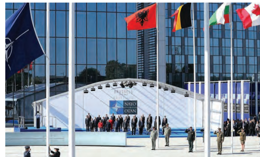
اجتماع الناتو امس

انطلقت في العاصمة البلجيكية بروكسل، أمس الخميس، أعمال اجتماع وزراء دفاع حلف شمال الأطلسي (ناتو). ومن أهم الملفات التي يبحثها الاجتماع: العلاقات مع روسيا، مكافحة الإرهاب، الصعود الصيني، التطورات في أفغانستان. وفي كلمته الافتتاحية، قال الأمين العام للحلف ينس ستولتنبرغ إن الاجتماع سيشهد الاستماع إلى آراء وزراء الدفاع، لتحديد أهداف جديدة حول قدرات وإمكانات أعضاء الحلف.