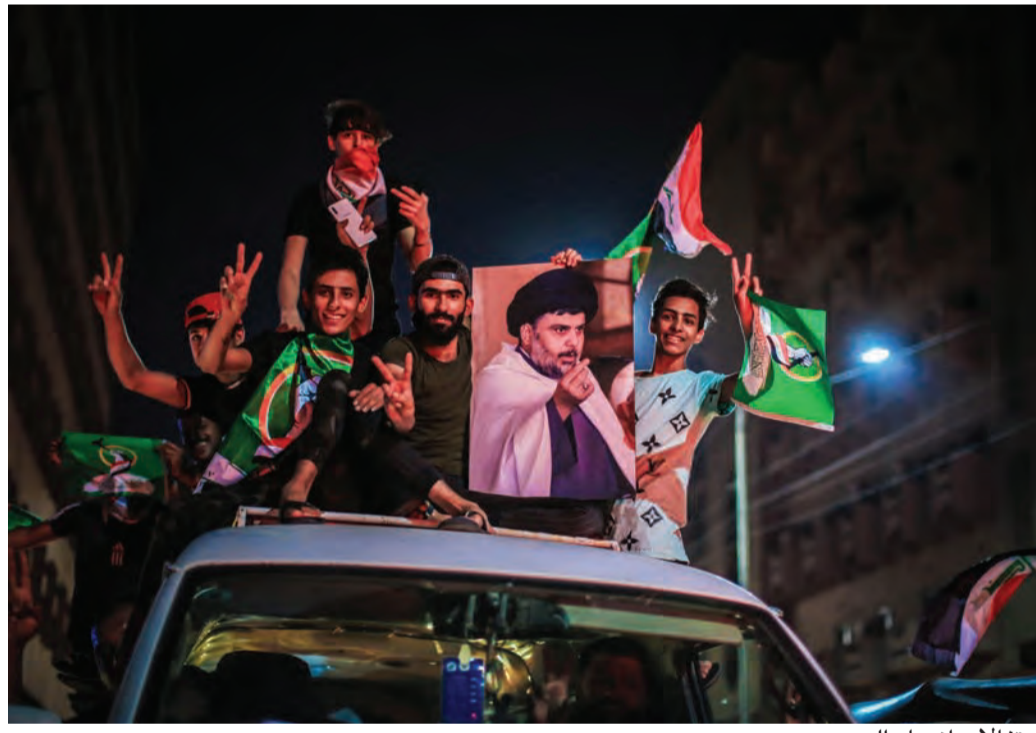
احتفالات انصار الصدر

أعلنت وكالة الأنباء العراقية أن كتلة «التيار الصدري» بزعمارة مقتدى الصدر جاءت -حسب النتائج الأولية- في المركز الأول بالانتخابات البرلمانية، في حين أعلنت قوى سياسية شيعية وفصائل مسلحة من الحشد الشعبي رفضها النتائج. وذكرت الوكالة الرسمية أن الكتلة الصدرية تصدرت النتائج بـ٧٣ مقعدا من أصل ٣٢٩، في حين حصلت كتلة «تقدم» بزعمارة رئيس البرلمان المنحل محمد الحلبوسي على ٣٨ مقعدا، وفي المرتبة الثالثة حلت كتلة «دولة القانون» بزعمارة رئيس الوزراء الأسبق نوري المالكي بـ٣٧ مقعدا. ويص الدستور العراقي على أن الكتلة التي تستطيع جمع ١٦٥ مقعدا في البرلمان الجديد يمكنها تشكيل الحكومة الجديدة.