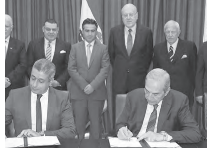
توقيع الاتفاق بحضور الرئيس ميقاتي

في الاستقرار السياسي وتوافر النية الواضحة لإقرار الإصلاحات»، وشدد على «أن أي حل يجب أن يؤدي الى حماية أموال المودعين».