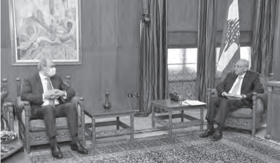
بري مستقبلاً الشامي

استقبل رئيس مجلس النواب نبيه بري في مقر الرئاسة الثانية في عين التينة، رئيسة الهيئة الوطنية لشؤون المرأة اللبنانية السيدة كلودين عون روكز وأعضاء المكتب التنفيذي للهيئة.