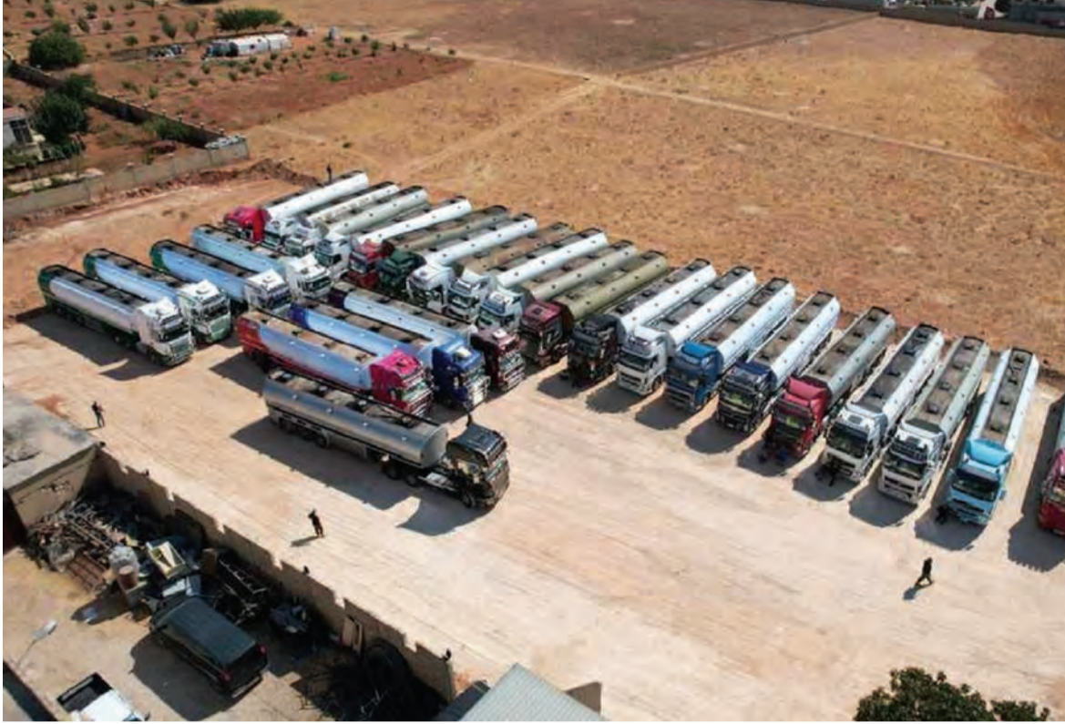
وصول المزيد من المحروقات الإيرانية الى لبنان