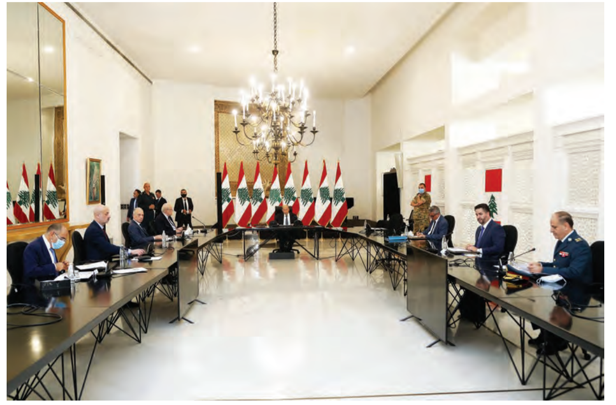
اجتماع مجلس الدفاع الاعلى