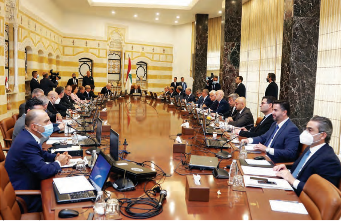
جلسة مجلس الوزراء امس (الاتي ونهرا)

زعبتر، ما استدعى تعليق التحقيق ووقف كل الجلسات، الى أن تبت محكمة التمييز المدنية برئاسة القاضي ناجي عيّد بقبول هذه الدعوى أو رفضها. علما انه وبحسب معلومات «الديار»، كان عيد يعزّم إصدار قراره يوم امس مع ترجيح اصداره اليوم الاربعاء وان يكون مائلا للقرارات القضائية السابقة برفض كف يد البيطار. ويتبّع البيطار طلب رده من الغرفة الأولى في محكمة التمييز، أو قصف تحقيقاته حين بثّ الطلب من المحكمة، ما ادى حكما لتأجيل جلساتي الاستجواب اللتين كانتا مقررتين اليوم لزعبت والنائب نهاد المشنوق. وبالتوازي، أحال المحامي العام التمييزي القاضي عماد قبيلان امس الى البيطار قرار وزير الداخلية بسام مولوي الذي رفض فيه اعطاء انب بملاحقة اللواء عباس ابراهيم. فيما أعلن المجلس الأعلى للدفاع الذي عقد برئاسة رئيس الجمهورية العماد ميشال عون في قصر بعبدا، انه عقد جلسة للنظر في طلب المحقق العدلي في جريمة انفجار مرفأ بيروت الحصول على انب بملاحقة المدير العام لأمن الدولة اللواء طوني صليبا ليصار الى استجوابه بصفة مدعى عليه، واتخذ القرار المناسب بشأنه. ورجحت (تتمة المانشيت ص ١٢)