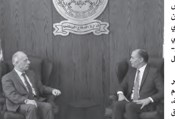
سليم مستقبلاً السفير التونسي

بحث وزير الدفاع الوطني مورييس سليم، مع سفيرة اليونان كاترين فونتولاكي برفاقها الملحق العسكري Konstantinos Antinatos، في مجالات التعاون الثنائي والأورو-متوسطي، وسبل تطويرها وتبادل الدعم في المحافل الدولية. كما عرض سليم مع السفير التونسي في لبنان يوراوي الامام برفاقه الوزير المفوض رضا شهيدية، للعلاقات الثنائية، وجرى التوافق على اهمية تطويرها، والتنسيق في المسائل المشتركة بين البلدين.