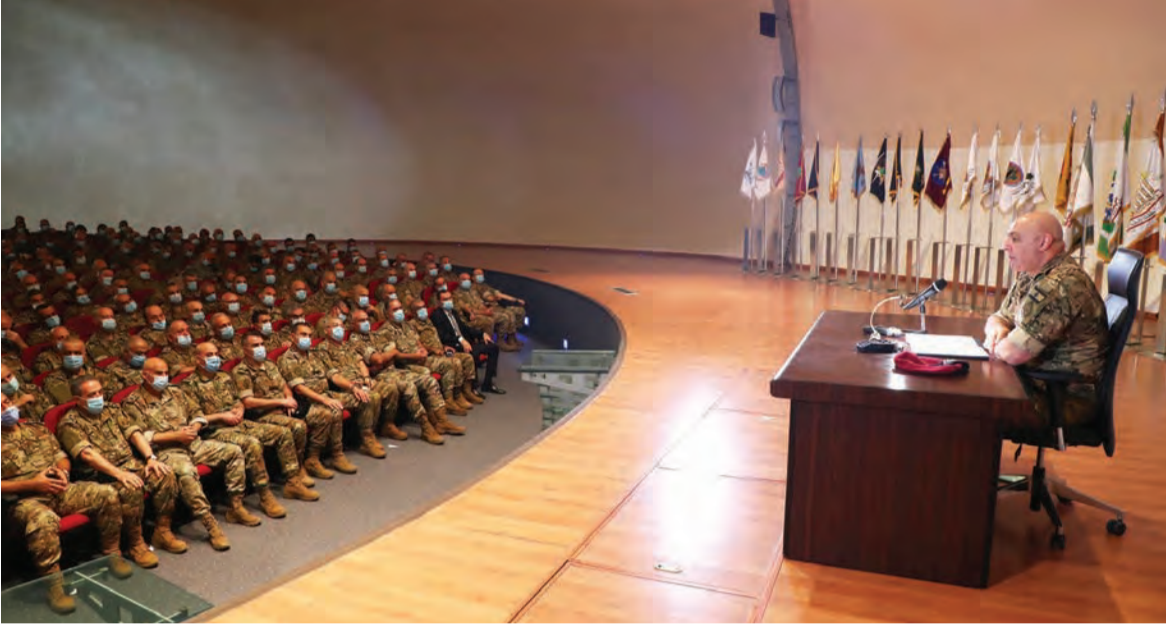
لقاء قائد الجيش مع الضباط امس

نجيب ميقاتي حيث يتمحور العمل اليوم على وضع برنامج اصلاحي يؤدي الى نهوض البلد تدريجيا من الازمة التي تعصف بلبنان، ولم تعط المصادر اهمية لقيام البعض