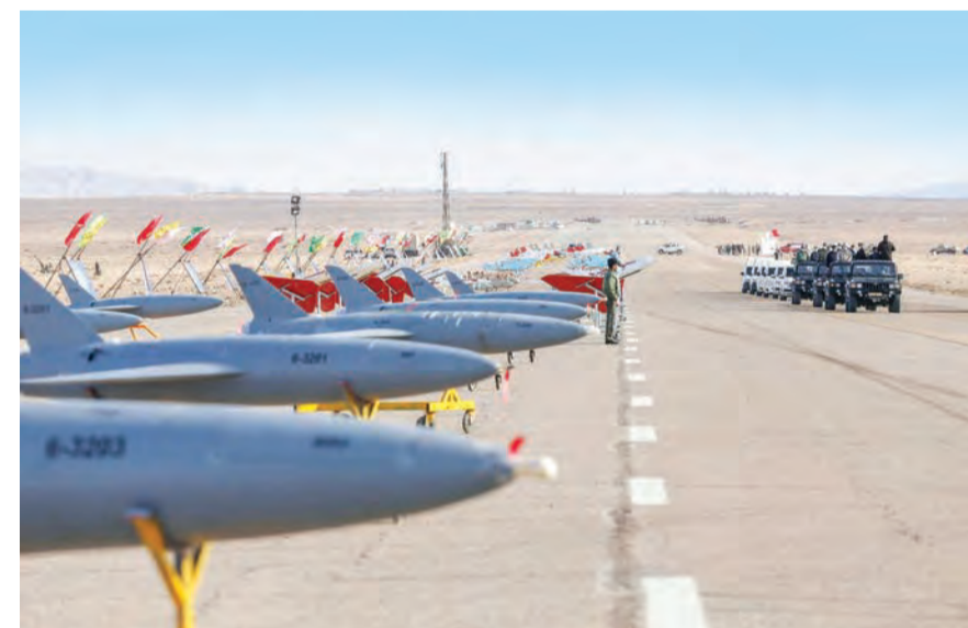
تطور القدرات الإيرانية

إلى قطع العلاقات الدبلوماسية بين الدولتين. على صعيد آخر، قال العميد أحمد علي كودرزي قائد حرس الحدود في الشرطة الإيرانية إن طهران ترصد تجسس إسرائيل في النقاط المهمة التي يتركزون فيها بجمهورية أذربيجان. (التتمة ص ١٢)