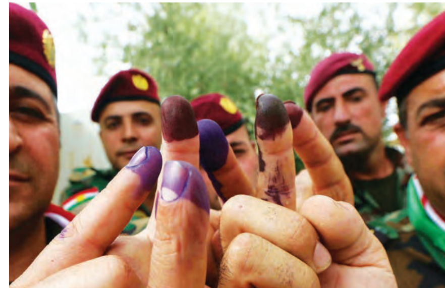
عناصر من الجيش بعد الإدلاء بأصواتهم

بدورها، أكدت خلية الاعلام الأمني مشاركة سلاح الجو في خطة تأمين الانتخابات من خلال تنفيذ طلعات جوية استطلاعية.