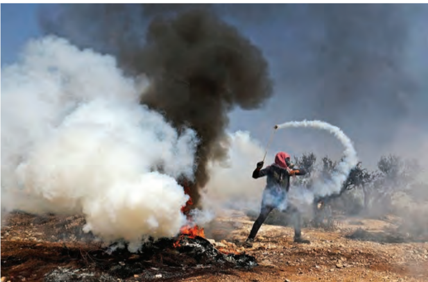
المواجهات على حدود غزة امس

انطلقت دعوات للرباط في المسجد الأقصى أمس الجمعة عقب صدور قرار يسمح للمستوطنين بأداء الطقوس التلمودية الصامتة خلال اقتحامهم المسجد. هيئات ومرجعيات إسلامية في القدس وفصائل المقاومة دعت إلى الرباط في المسجد الأقصى، وقالت إن قرار الاحتلال هو بمثابة عدوان خطير. كما أوضحت أن هذا القرار الخبيث هو مقدمة لمؤامرة التقسيم الزماني والمكاني ما يساعد المستوطنين على الاستمرار في جرائمهم ودعت جماهير الشعب الفلسطيني للاحتشاد والرباط في المسجد الأقصى رفضاً لهذا التعدي.