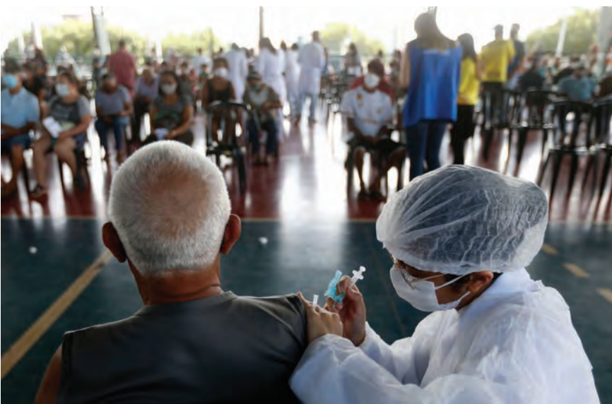
القاح يجب ان يصل للجميع

وصف الأمين العام للأمم المتحدة أنطونيو غوتيريش، سيطرة الدول الغنية على اللقاحات المضادة لفيروس كورونا بأنه أمر «لا أخلاقي» و«غبي»، مؤكداً أن ذلك يفتح الطريق لظهور متحورات قد تكون خطيرة. وقال غوتيريش في مؤتمر صحفي مشترك مع المدير العام لمنظمة الصحة العالمية تيدروس أدهانوم غيبريسوس إن عدم المساواة في الحصول على اللقاحات «هو أفضل حليف لوباء كوفيد-١٩».