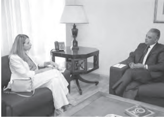
المرتضى مستقبلاً السفارة الإيطالية

مؤكدًا، تقدير لبنان دولة وشعباً لكل الجهود المبذولة في هذا المجال من الدولة الإيطالية ومن السفارة بومباردييري شخصياً..