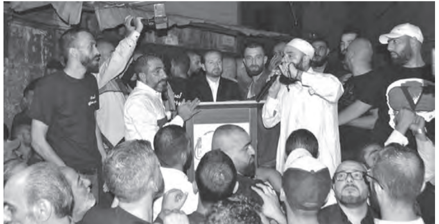
كرامي يلقي كلمته خلال اللقاء الشعبي

لمى رئيس «تيار الكرامة» النائب فيصل كرامي دعوة الناشط خلدون حجازي واهالي منطقة الحارة البرانية في طرابلس الى المشاركة في اللقاء الشعبي في منطقة الحارة البرانية الذي شهد مشاركة كثيفة من كل المناطق الطرابلسية. وكانت كلمة الختام لكرامي توجه فيها: «الى الحاضرين بالقول: «الباس ممنوع والاستسلام ممنوع، ولن نقبل بالمذلة والحلول الترقيعية. وبالتالي قروي وقدركم العودة إلى النضال، تحديداً النضال السلمي ونحت سقف القانون وبالوسائل الديموقراطية المتاحة وأهمها