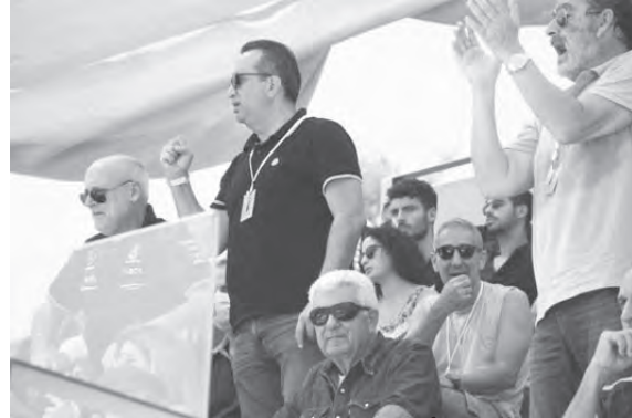
رئيس اتحاد التنس أوليفر فيصل يتفاعل خلال المباراة