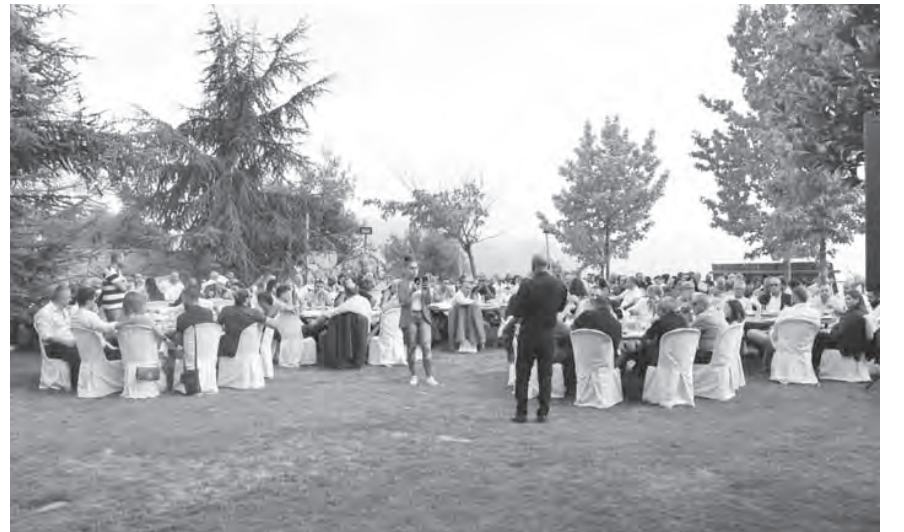
خلال اللقاء في دارة أبي رميا

جمع النائب سيمون أبي رميا، في لقاء حاشد في دارته في إهمج، منسقي وأعضاء الهيئات المحلية ل«التيار الوطني الحر» في قضاء جبيل، وألقى كلمة قال فيها: «كلنا أمل بعود الرئيس العماد ميشال عون الذي امتص بحكمته ومسؤوليته الانهيار المبرمج والمخسر له منذ ١٧ تشرين الأول ٢٠١٩.»