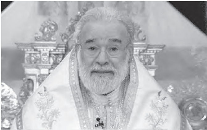
عودة يلقي عظته

الذي منه ينبع الغفران والقيامة للعالم أجمع».. وتابع «منظما هي العائلة، كذلك هو الوطن. ما نشهده في بلدنا هو طغيان حب الأنا، إذ إن كل طرف يريد مصلحته الشخصية فقط، على حساب عائلة الوطن. هذا ما جعل من العلاقة العائلية، بين الشعب والمسؤولين علاقة فاشلة، فاقدة للمحبة، ممتلئة بالكراهية والنزاعات. كل ما ينطبق على العائلة الصغيرة ينطبق على الكبيرة، وخصوصاً من جهة حضور الله في العلاقات، والحرية التي يجب أن يتحلى بها أبناء الشعب الذي لا يعيش حالياً سوى الإحباط، والشعور بقد الكرامة. عندما يكون الله حاضراً في حياة جميع مكونات الوطن من زعماء ومسؤولين ومواطنين، وعندما تسود المحبة والتواضع والصدق والوفاء للوطن، وتعم الفضائل يصبح البلد فردوساً أرضياً. إذ، ندعو الجميع إلى العودة إلى الله، عندئذٍ يستقيم عمل الجميع ونجو جميعاً». وختم عوده: «في النهاية، على المسيحي أن يكون جاهزاً دوماً لحمل الصليب، في كل أعماله، جاهزاً للموت المحيي الذي يدع الإنسان إلى الكرامة المنوحة من الله، والأل يخلج من أن يعيش مسيحيته أينما حل، لأن الشهادة للرب وإنجيله تحتاج إلى جرأة على مثال الأنبياء والرسل والشهداء والمُعتَرَفِين، الذين لم يهابوا موتاً ولا أحداً أو شيطاناً، بل كان جل هدفهم أن يخلصوا البشر من الشيطان المترص بهم».