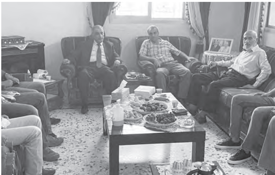
هاشم مستقبلاً زواره

المطوّلات، والأفضل أن تكون مرحلة أفعال لا أقوال، لأنّ هناك الكثير من المشاكل الطارئة التي تتطلب تفاهماً وتوافقاً وطنياً». وأشار إلى أنّ «ما طرحه رئيس مجلس النواب نبيه بري حول إقدام العدو الإسرائيلي على تزييم المنطقة المتنازع عليها من مياها، للاستيلاء على ثروتنا النفطية، يستحقّ التعاطي معه من منطلق العدولان الصهيوني الجديد على وطننا، وهو ما يفرض التفاهماً وطنياً حول سُبل مواجهة هذا الاعتداء والقرصنة، وفق كلّ السبل والآليات التي تحفظ حقوقنا وسيادتنا»، مبيّناً أنّ «هذه واحدة من الكثير من التعقيدات التي تواجه الحكومة، وتتطلّب التفاهماً وطنياً حولها لتكون قادرة على حماية الوطن وتحصينه».