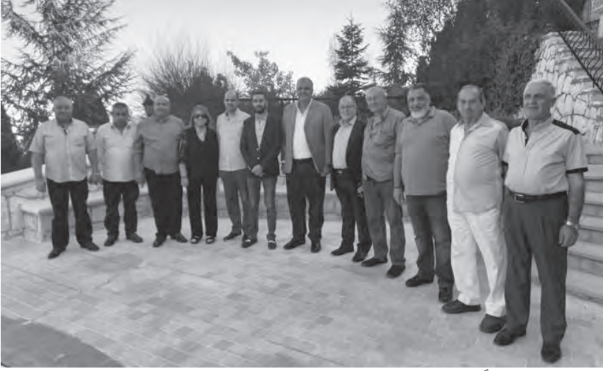
بوشكيان مستقبلاً المهنيين في دارته

يوجد أمر مستحيل أمام الإرادة الوطنية الجامعة، وتمسك اللبنانيين بأرضهم، وتضامهم بين بعضهم وثقتهم بالدولة معالجة الملفات الشائكة والمعقدة. ونحن نتفهم قلق الناس أمليين في نيل ثقتهم لأننا آتون للعمل وليس لإضاعة الوقت. صعوبات وتحديات أكبر مما نواجهه اليوم.»