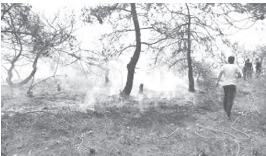
في منطقة وادي جهنم

يسيطر طقس صيفي مستقر وحر نسبيا على الحوض الشرقي للمتوسط حتى مساء يوم الأربعاء حيث يتحول الى خريفي متقلب بسبب تأثير منخفض جوي متمركز فوق البحر الأسود.