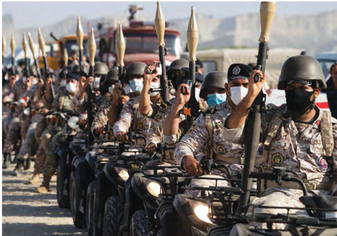
الجيش الإيراني على الحدود مع العراق

لفت المتحدث باسم وزارة الخارجية الإيرانية، سعيد ختیب زادة، إلى أن «الولايات المتحدة الأمريكية مارست الأحادية والتفرد في محادثات فيينا بشأن الاتفاق النووي مع إيران»، مركزاً على أنه «إذا تخلت أميركا عن هذه الأحادية، فإن مسار محادثات فيينا سيُتجه نحو الأحسن».