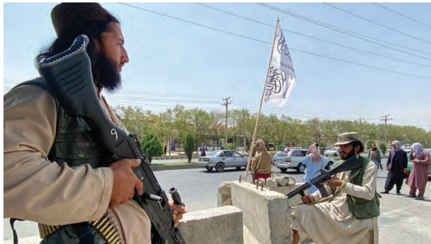
عناصر طالبان في كابول

قال الأمين العام للأمم المتحدة أنطونيو غوتيريش إن على مجلس الأمن الدولي النظر في مسألة تطوير خطة لاستثناء حركة طالبان من بعض العقوبات مستقبلاً، في حين طلبت واشنطن من مجلس الأمن الدولي تمديد إعفاء من العقوبات لبعض قادة الحركة.