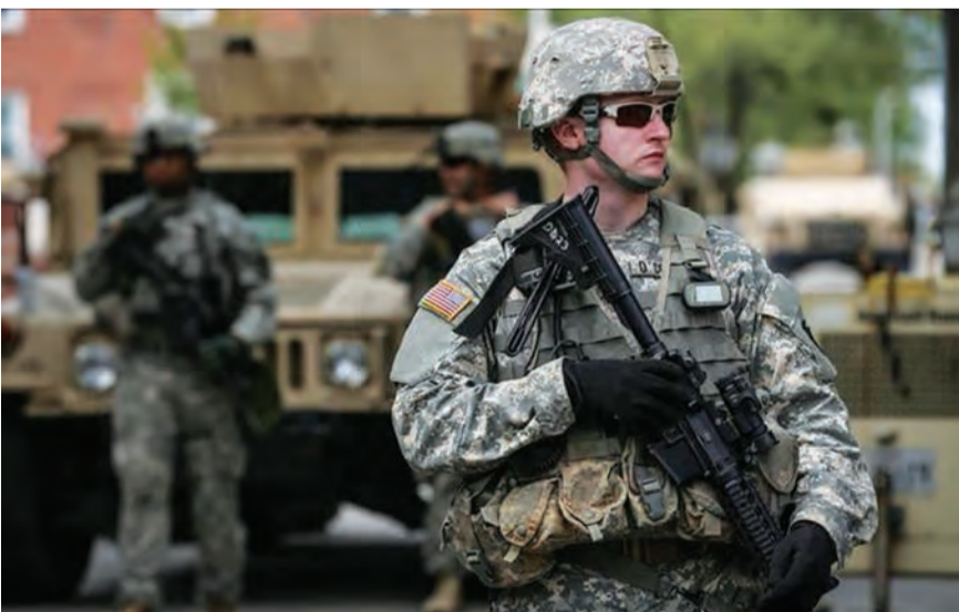
جنود اميركيون في العراق

مع السيادة العراقية. وتشكّل التحالف الدولي بقيادة الولايات المتحدة من أكثر من ٦٠ دولة في ٢٠١٤ لمحاربة تنظيم الدولة الإسلامية في سوريا والعراق. وقدم التحالف إسناداً جويًا لقوات حليفة في البلدين، إلى جانب تدريب وتسليح تلك القوات وأحياناً المشاركة معها في العمليات القتالية لغاية طرد التنظيم من كل تلك الأراضي عام ٢٠١٩.