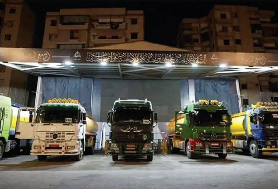
صهاريج النفط الإيراني في الضاحية الجنوبية تمهيدا لتوزيعها

حزب الله بدا امس بعد نقله اكثر من مليون غالون من المازوت الإيراني الى لبنان عبر سوريا انه المنقذ الوطني وتدخّل حيث فشلت الحكومة اللبنانية وداعموها الغربيون اثر تعرض لبنان لواحد من اسوأ الانهيارات الاقتصادية في التاريخ الحديث.