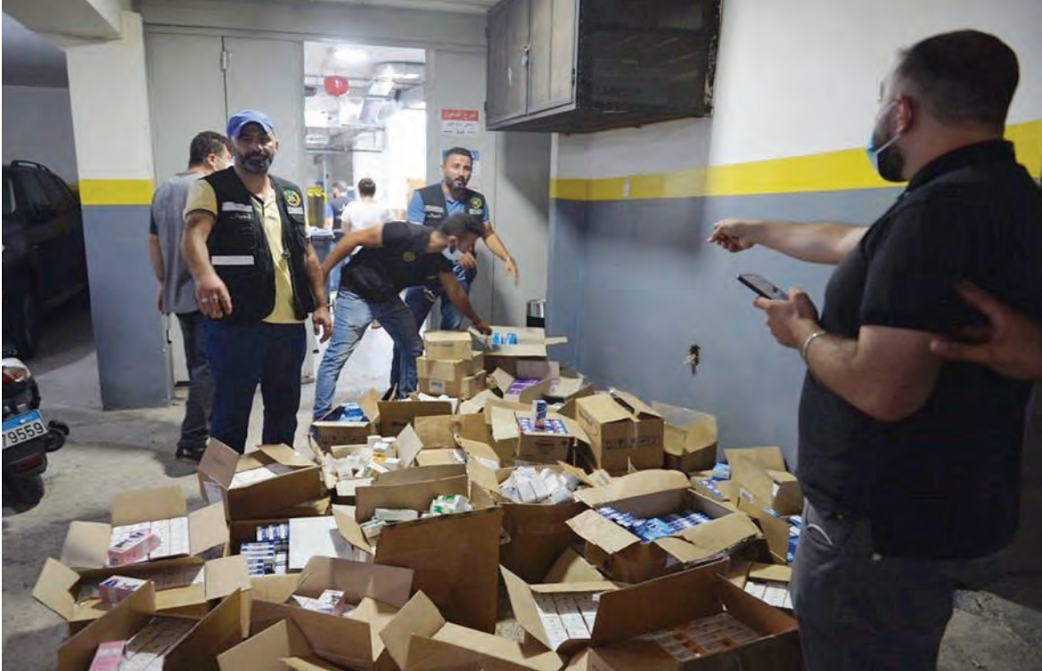
مداومة مستودع ادوية في عين المريسة منذ يومين

سقط لبنان في الهاوية التي دفع نفسه من حافتها نتيجة غياب التخطيط الاقتصادي السليم.