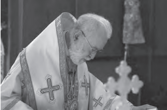
عودة يلقي عظته

سلعة فاسدة؟ وكيف لمواطن أن يصدق من انتخبهم لحماية مصالحه والنطق باسمه، فإذا بهم لا يفكرون إلا بمصالحهم ولا ينطقون إلا بالفض، محولين حياته جحيما ومستقبله مجهولا؟».