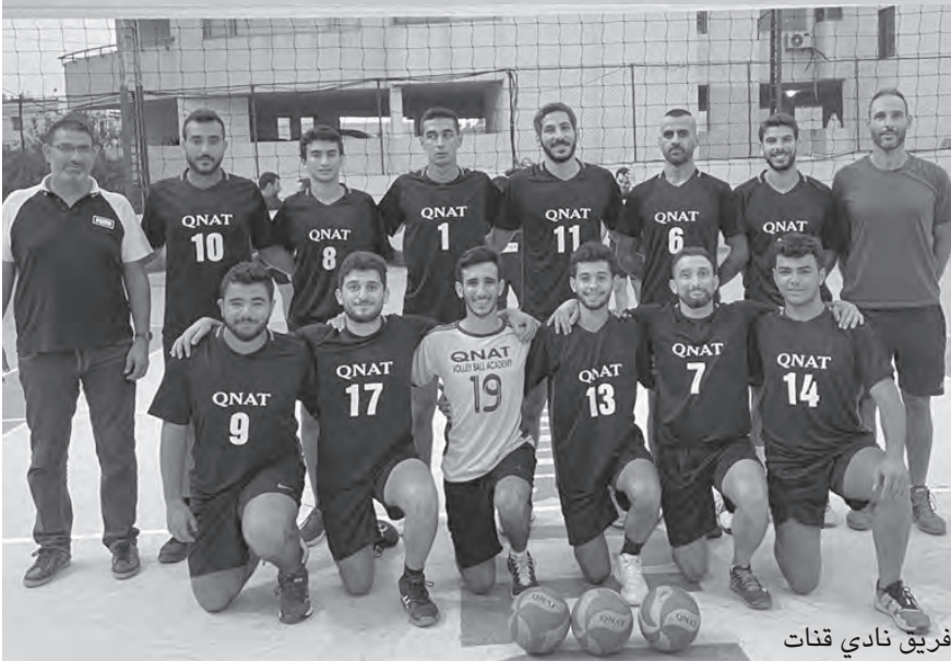
فريق نادي قنات