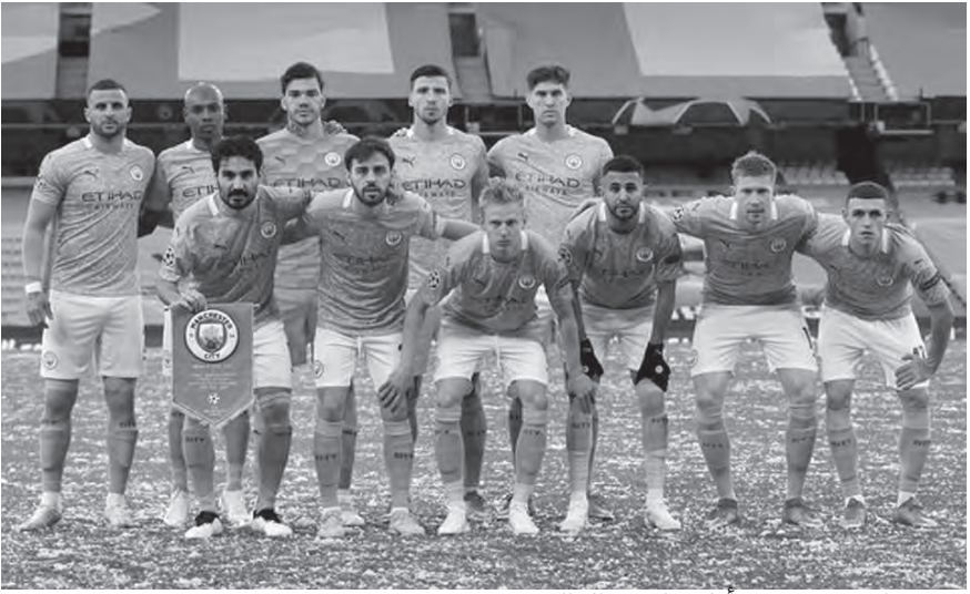
فريق مانشستر سيتي أعلى ناد في العالم

ويظهر المقطع مدى عدم رضا كيليني عن أداء يوفنتوس تحت قيادة أليغري حتى الآن.