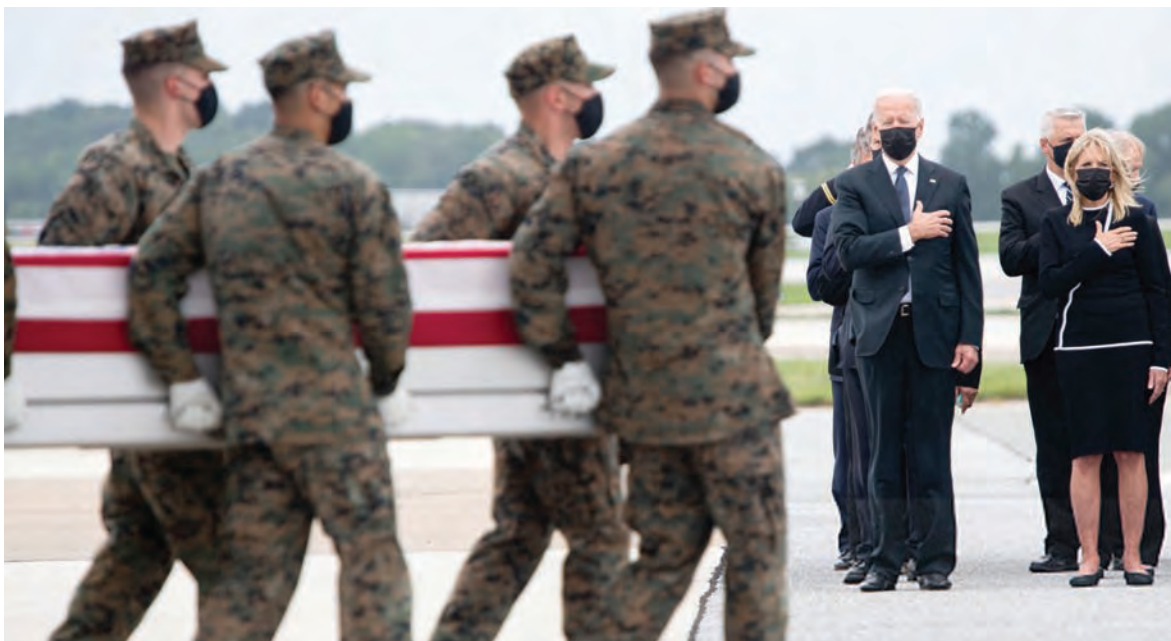
بايدن مستقبلاً رفاة الجنود الأميركيين الذين سقطوا في أفغانستان

أكد مسؤولان أميركيان و«حركة طالبان» ان الولايات المتحدة الاميركية نفذت ضربة عسكرية في كابول. ونقلت وكالة «رويترز» عن المسؤولين الأميركيين الذين رفضوا ذكر اسمهما، ان اميركا نفذت ضربة استهدفت سيارة في كابول، والهجوم استهدف مشتبهين بينهم عناصر لجماعة «ولاية خراسان» التابعة لـ «دواعش».