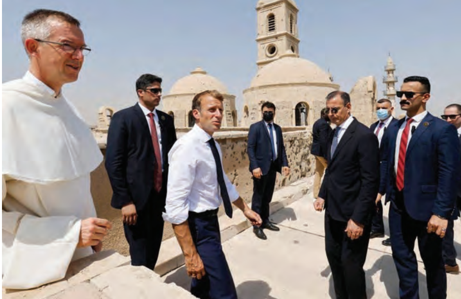
ماكرون في زيارة كنيسة «سيدة الساعة» في الموصل

الساعة القديمة التي يرجح بعض المؤرخين أنها تعود لألف عام «نحن هنا للتعبير عن مدى أهمية الموصل وتقديم التقدير لكل الطوائف التي تشكّل المجتمع العراقي. وأرغم العديد من مسيحيي العراق، بفعل الحروب والنزاعات وتردي الأوضاع المعيشية، على الهجرة. ولم يبق في العراق اليوم سوى ٤٠٠ ألف مسيحي من سكانه البالغ عددهم ٤٠ مليوناً بعدما كان عددهم ١,٥ مليون عام ٢٠٠٣ قبل الإجتياح الأميركي. ويشكو المسيحيون خصوصاً من تمييز وعدم الحصول على مساعدة من الحكومة لاستعادة منازلهم وممتلكاتهم صودرت خلال النزاع على أيدي مجموعات مسلحة نافذة».