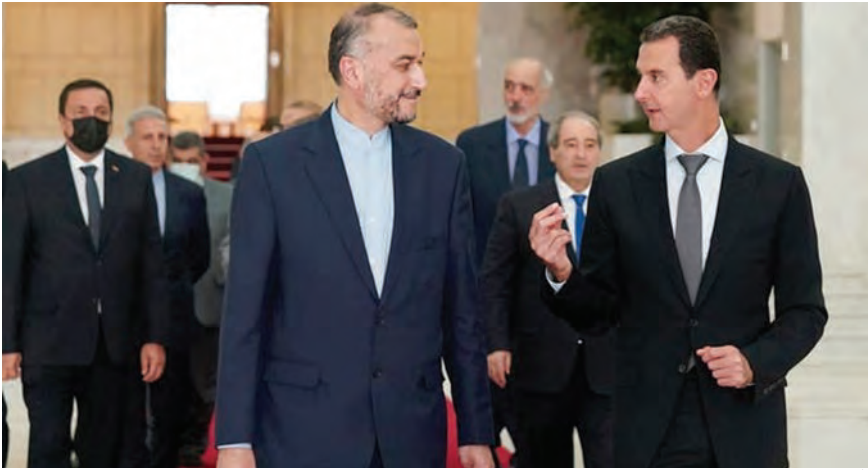
الاسد مستقبلاً عبد اللهيان

الاسد، ووعد بمرحلة جديدة مع الحكومة السورية، مؤكداً ان «بلايه دخلت مرحلة جديدة من العلاقات التجارية والاقتصادية