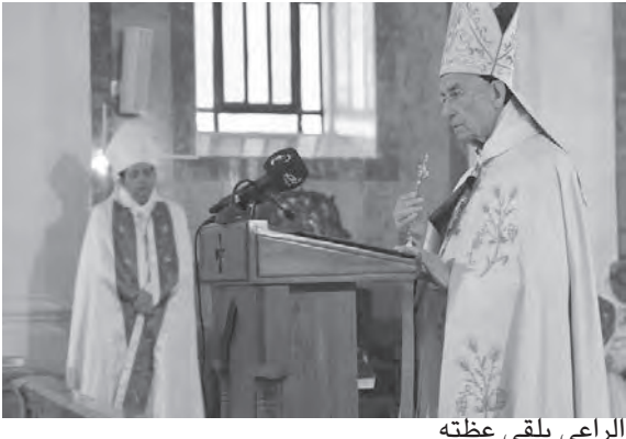
الراعي يلقي عظته

أصاف «إن المداهمات التي قامت بها الأجهزة الأمنية أخيراً على مستودعات المحروقات ومخازن الأدوية ومخابئ الأغذية، تكشف أن الفساد ليس محصوراً في الطبقة السياسية، بل هو منتشر بكل أسف في المجتمع اللبناني. وإن نشع هذه الأجهزة على توسيع مدهاماتها لتشمل جميع المتحرّكين وحاجبي الحاجات الحياتية والصحية عن الناس، ندعوها أيضاً وبخاصة إلى إغلاق المعابر الحدودية ومنع التهريب. فكل إجراء إداري يتخذ يبقى ناقص المفعول ما لم تفلق معابر التهريب بين لبنان وسوريا. وندعو القضاء إلى ملاحقة المتحرّكين والمهربين بعيداً من الضغوط السياسية والطائفية والمذهبية. فكل مسؤول سياسي أو مالي أو أمّني