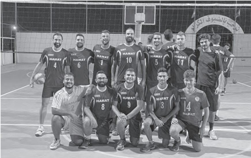
فريق نادي حمامات