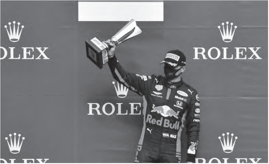
ماكس فيرشتابن على منصة التتويج

وحقق بذلك فريق ويليامز النقاط النقط عبر سيارتيه معاً للسباق الثاني على التوالي بعد نتيجة سباق المجر القوية.