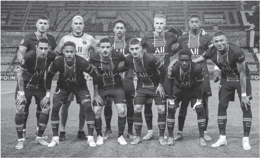
فريق باريس سان جرمان في المركز الثاني