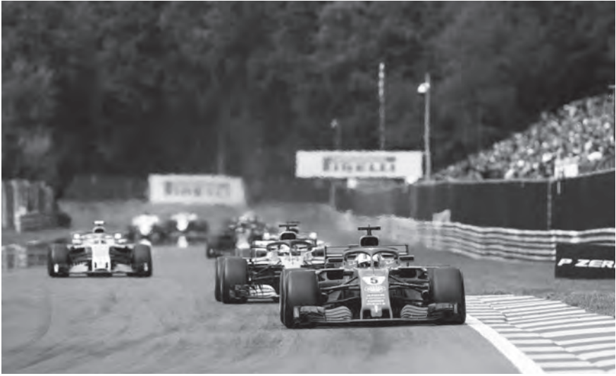
لقطة من سباق بلجيكا

ثانياً ضامناً منصةً تتويجه الأولى في الفورمولا واحد، بينما أكمل لويس هاميلتون ترتيب الثلاثة الأوائل.