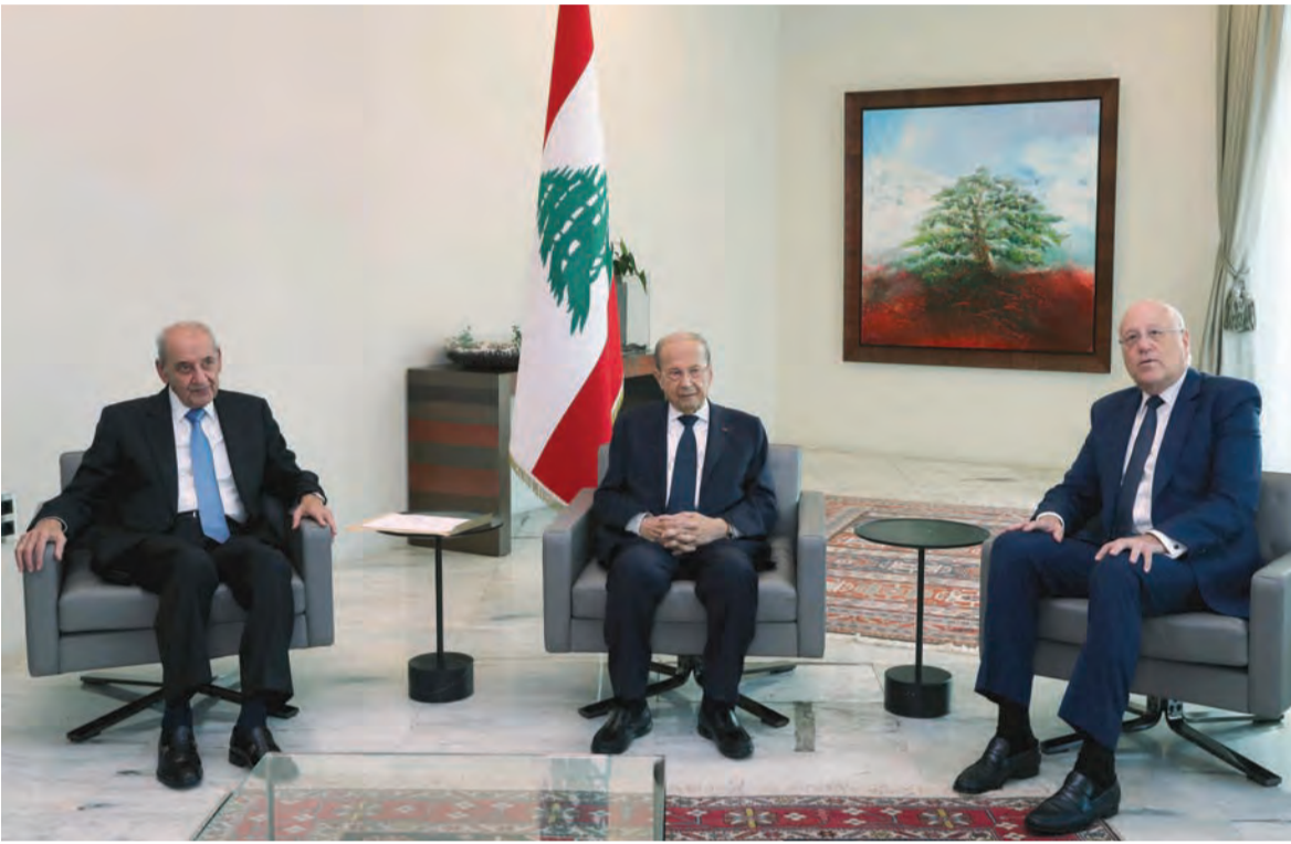
عون وبري وميقاتي

في مجلس النواب، تشير اوساط الرئيس المكلف ان «النوايا الحسنة» ستبدأ بالظهور بدءاً من اليوم بعد كل الكلام الإيجابي الذي سمعه في القصر الجمهوري، لان العبرة في التنفيذ. في هذا الوقت وفيما يباشر ميقاتي اتصالاته البروتوكولية مع رؤساء الحكومة السابقين ينتظر ان يجيب عن سلسلة من الاسئلة بعدما تعهد تنفيذ مندرجات المبادرة الفرنسية، فالمطلوب منه وضوح حول شكل الحكومة، هل ستكون حكومة تكنوقراط أم تكنوسياسية؟ كيف سيتبرجج الاتفاق مع رئيس الجمهورية على تسمية الوزراء المسيحيين؟ هل سيكون الوزراء بمن فيهم رئيس الحكومة خارج معمعة الانتخابات المقبلة بما ان الحكومة ستدير الانتخابات؟ كيف سيدبر التفاوض مع صندوق النقد الدولي؟ هل سيتبنى خطة حكومة دياب للتعاقي المالي، ام سيعاد وضع خطة جديدة؟