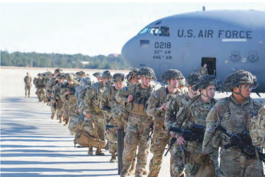
جنود اميركيون يغادرون العراق

أكد البيت الأبيض، أمس، إن الولايات المتحدة ستعلن عن تغيير المهمة في العراق من قتالية إلى تدريبية واستشارية. وقالت جين بساكي المتحدث باسم البيت الأبيض في مؤتمر صحفي، إن «القيادة العراقية طلبت من الولايات المتحدة تحويل مهمة قواتنا من القتال إلى الدعم الاستشاري، سنعلن عن تغيير مهمتنا في العراق من قتالية إلى تدريبية واستشارية». وأضافت، انه «لن فنصح عن أي تفاصيل بشأن عدد