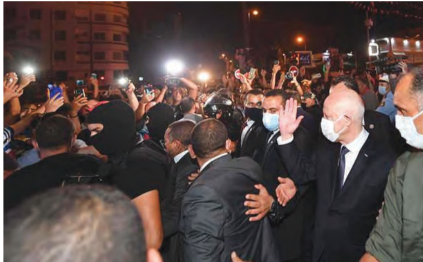
قيس سعيد بين الحشود

بنفسه، وتولى رئاسة النيابة العامة لتحريك المتابعة القضائية ضد من تحوم حولهم شبهات فساد. وقال سعيد -عقب اجتماع طارئ عقده في قصر قرطاج مع مسؤولين أمنيين وعسكريين- إنه قرر «عملا بأحكام الدستور- اتخاذ تدابير يقضيها (...) الوضع، لإنقاذ تونس، وإنقاذ الدولة التونسية وإنقاذ المجتمع التونسي». وأضاف الرئيس التونسي «تلاحظون -من دون شك- المرافق العمومية تهاوى، وهناك عمليات نهب وحرب، وهناك من يستعد لدفع الأموال في بعض الأحياء للاقتتال الداخلي»، مؤكدا أنه اتخذ هذه التدابير بالتشاور مع رئيس الحكومة، ورئيس مجلس النواب راشد الغنوشي.